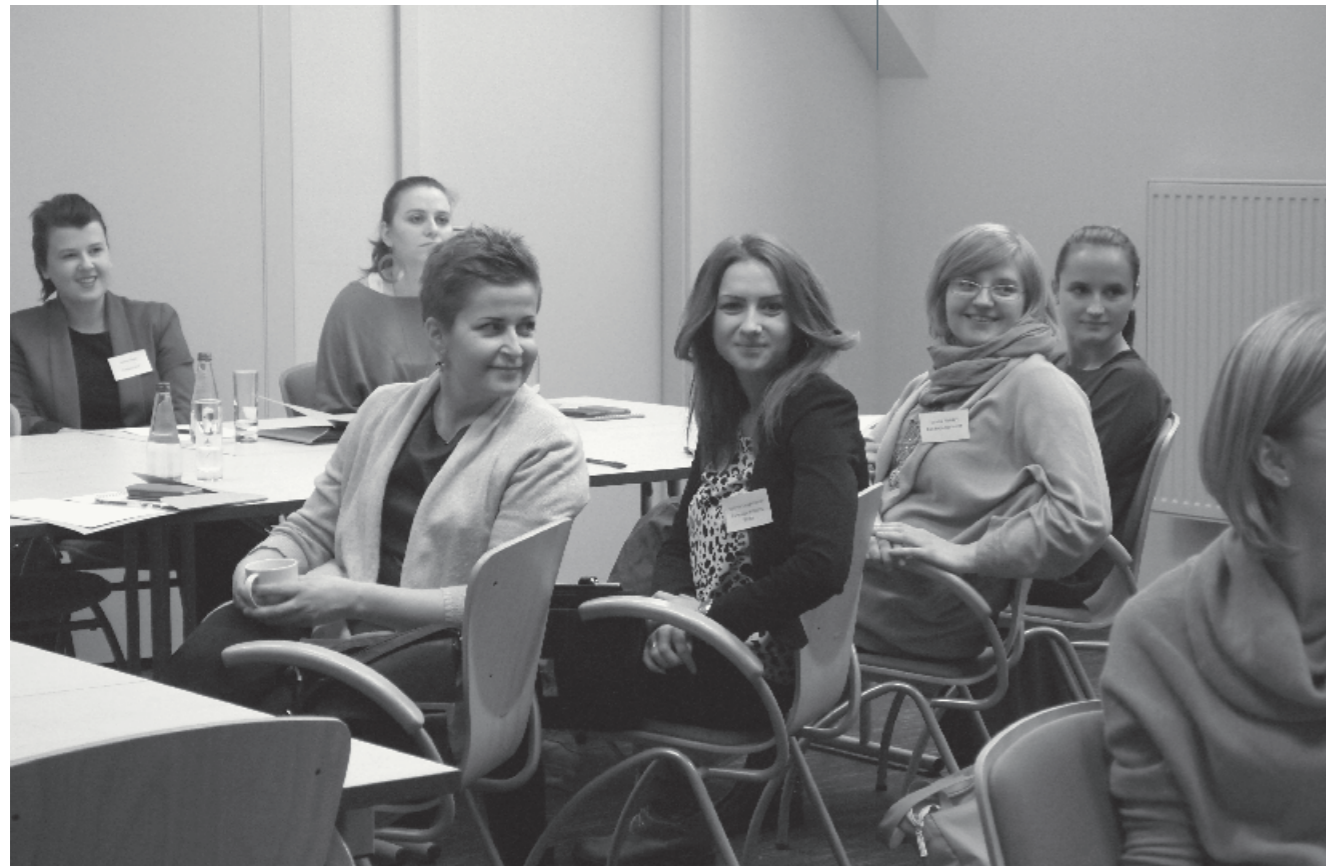
Drugi zjazd uczestników projektu, 12 lutego 2015 r.

Opracowywanie standardów zweryfikowało naszą dotychczasową wiedzę, tym samym dając impuls do doskonalenia działań grantodawczych.