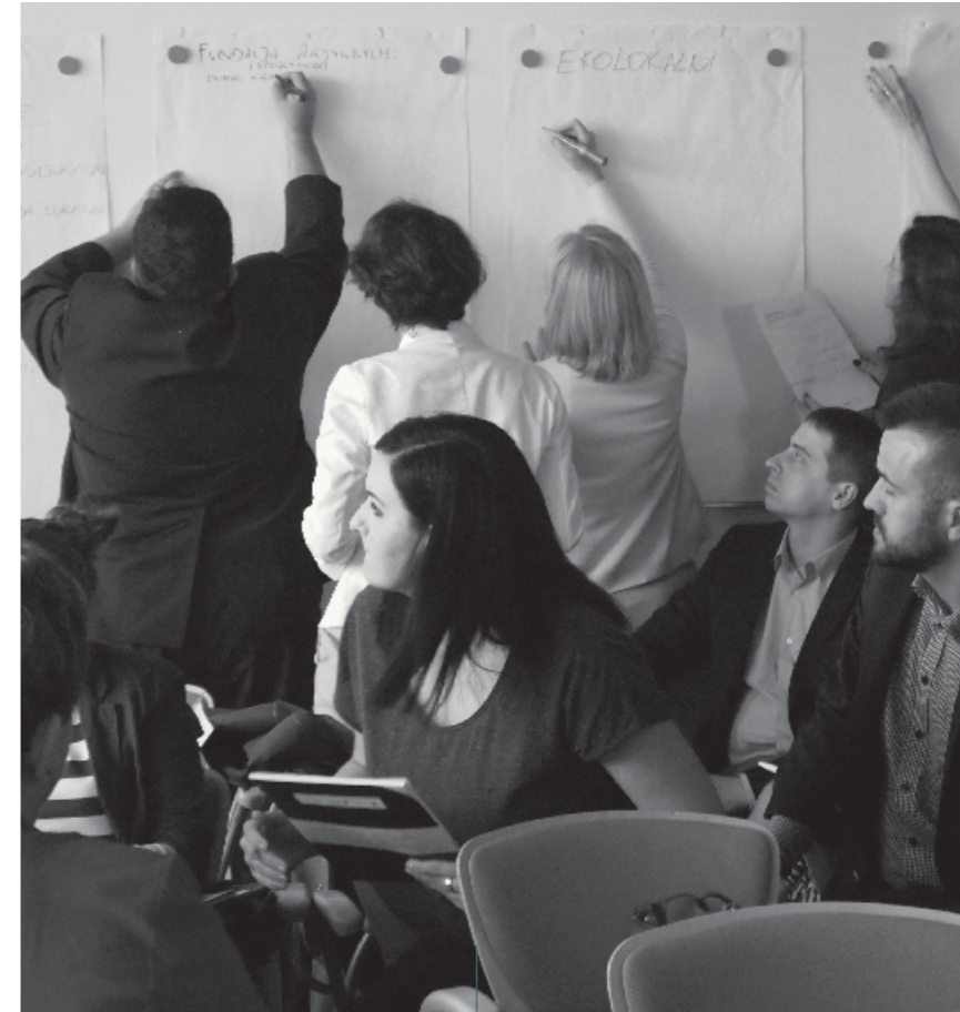
Seminarium pt. „Jak skutecznie komunikować się i współpracować?”, 5 czerwca 2014 r.

Planowanie działań fundacji, w tym projektowanie konkretnych programów pomocowych, poprzedzone jest analizą danych, badaniami własnymi (m.in. w terenie), oceną dotychczasowych działań innych podmiotów w danej dziedzinie i w danym regionie. Przykładowo, w 2014 roku fundacja zainicjowała program „Pokolenie Plus”, dedykowany aktywizacji osób po 60. roku życia na terenach wiejskich województwa opolskiego. Analiza danych z regionu wskazała na rosnącą depopulację i szybkie starzenie się społeczności na tym obszarze. Przygotowanie programu poprzedzone było serią spotkań z beneficjentami, podczas których ustalono, że potrzebują oni przede wszystkim integracji oraz wiedzy z zakresu zdrowego trybu życia, bezpieczeństwa i obsługi komputera. Na etapie przygotowań fundacja korzystała ze wsparcia ekspertów z Fundacji Wspomagania Wsi. W efekcie powstał program szkoleń i animowanych spotkań dla seniorów, w których udział wzięło 130 osób, oraz Klub Pokolenia Plus.