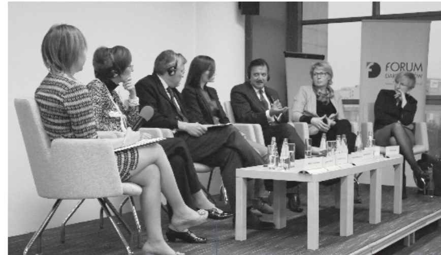
Seminarium pt. „Fundacja zaufania publicznego. Przejrzystość, legalizm i etyka działań”, 27 listopada 2014 r.

Fundacja BGK ma trzyosobowy Zarząd powołany przez fundatora na dwa lata. W jego skład wchodzi przedstawiciele fundatora – osoby kompetentne, posiadające doświadczenie odpowiednie do powierzonej funkcji i korespondujące z misją fundacji. Prezesem Zarządu jest osoba odpowiedzialna za departament komunikacji fundatora, mająca doświadczenie w dziedzinie społecznej odpowiedzialności biznesu oraz filantropii, a także w pracy w organizacji pozarządowej. Do reprezentowania fundacji upoważnionych jest dwóch członków Zarządu działających łącznie.