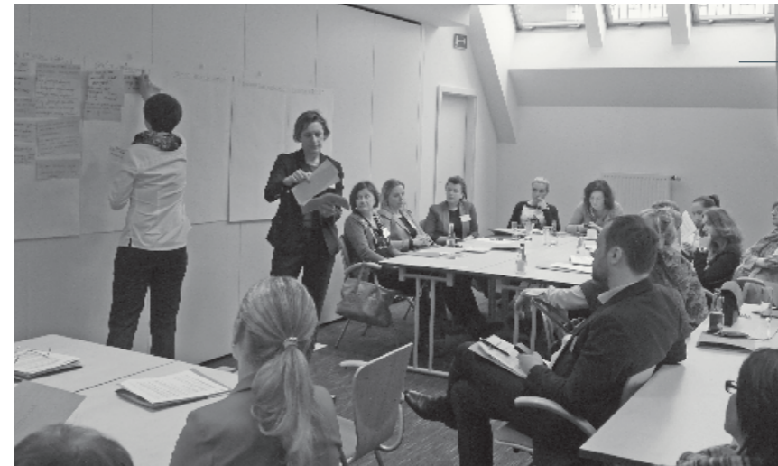
Drugi zjazd uczestników projektu, 13 lutego 2015 r.

Ewaluacja programu zaprojektowana została w odniesieniu do celu programu – było nim stworzenie samodzielnych (a więc z czasem niezależnych od fundacji) centrów aktywności oraz sieci współpracujących ze sobą lokalnych liderów,