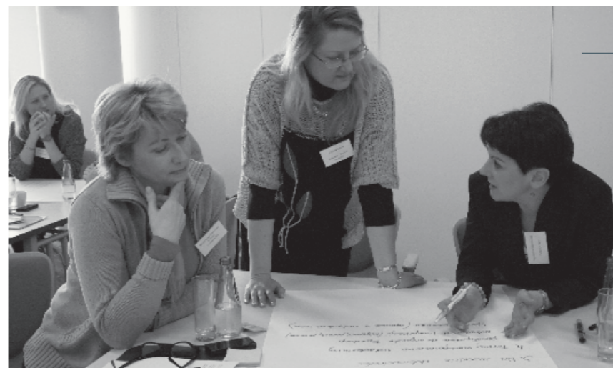
Warsztat pt. „Pracownicy i wolontariusze w fundacjach korporacyjnych”, 7 marca 2014 r.

— Kształtując swoje relacje z otoczeniem, fundacja powinna samodzielnie kontaktować się z interesariuszami. Korzystanie z pośredników typu agencja PR buduje niepotrzebne bariery oraz może powodować nieporozumienia. To fundacja wie najwięcej o swoich działaniach i najrzetelniej potrafi o nich informować. Kontakty bezpośrednie pomagają w budowaniu wiarygodności organizacji.