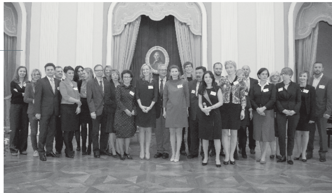
10-lecie Forum Darczyńców w Polsce, 17 października 2014 r.

Forum to grono otwarte na nowych członków, którzy są gotowi przestrzegać wysokich standardów działania, dbać o swój rozwój i wymianę doświadczeń z innymi, troszczyć się o przyszłość filantropii i sektora pozarządowego w Polsce.