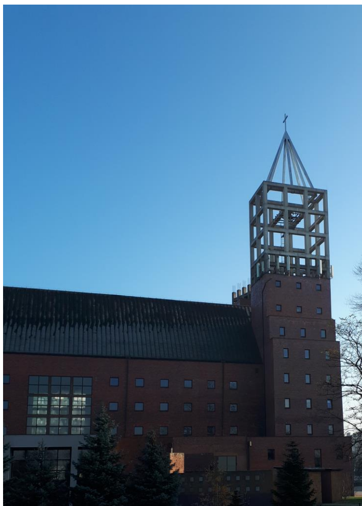
Fot. 1: Widok anten stacji bazowych: ID: WRO1156, ID: 46432 (76432N!), ID: BT30604, zlokalizowanych pod adresem: ul. Macedońska 2, 51-113 Wrocław