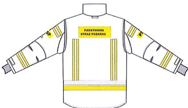
Przykładowy widok kurtki