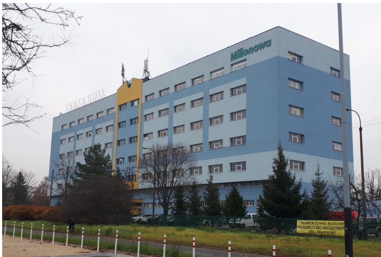
Fot. 1: Widok anten stacji bazowych: ID: BT33908 oraz ID: LOD1195, zlokalizowanych: ul. Częstochowska 38/52, Łódź