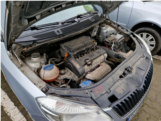
Dok. fot. z dnia 13.03.2023 fot. nr 15