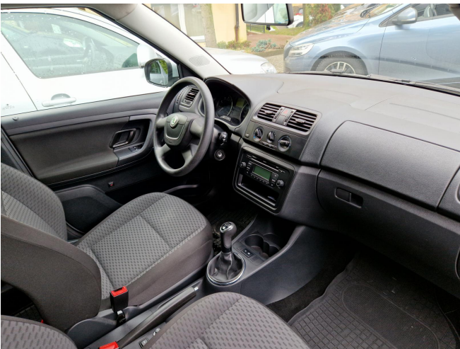
Dok. fot. z dnia 13.03.2023 fot. nr 5