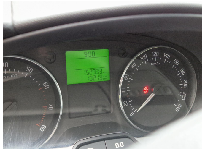
Dok. fot. z dnia 13.03.2023 fot. nr 10