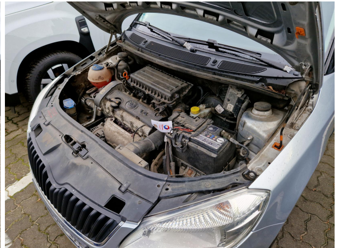
Dok. fot. z dnia 13.03.2023 fot. nr 16