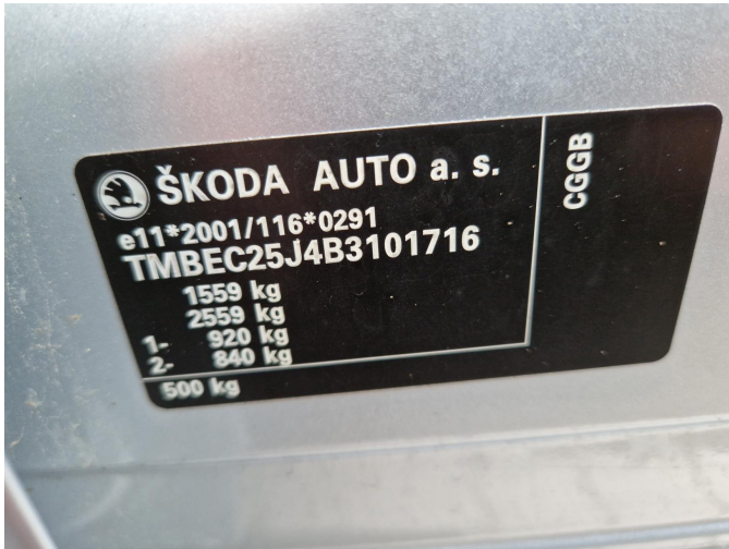
Dok. fot. z dnia 13.03.2023 fot. nr 7