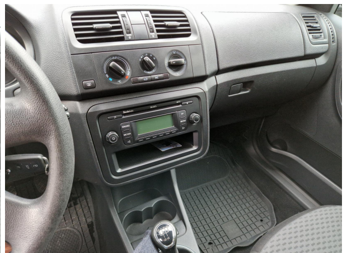
Dok. fot. z dnia 13.03.2023 fot. nr 12