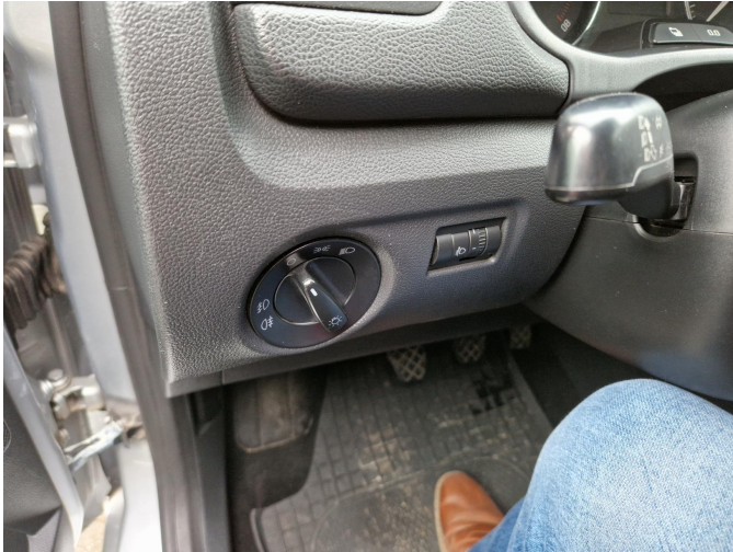
Dok. fot. z dnia 13.03.2023 fot. nr 13