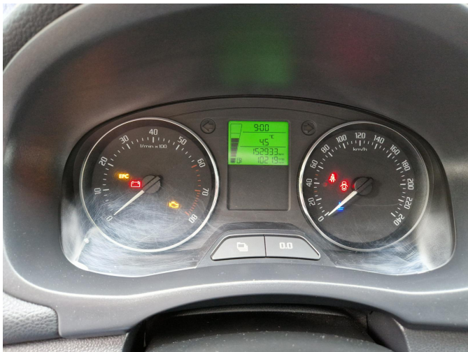
Dok. fot. z dnia 13.03.2023 fot. nr 9