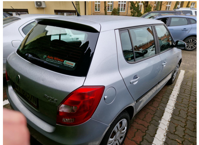
Dok. fot. z dnia 13.03.2023 fot. nr 4