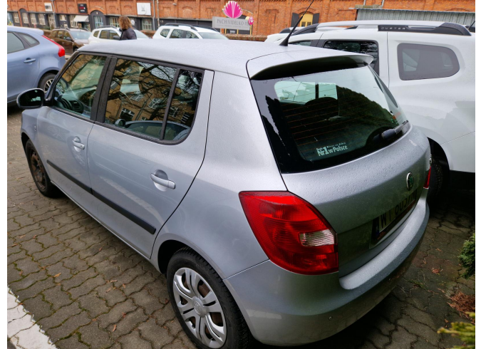
Dok. fot. z dnia 13.03.2023 fot. nr 2