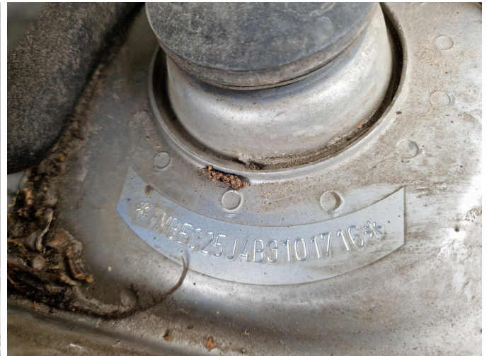
Dok. fot. z dnia 13.03.2023 fot. nr 8