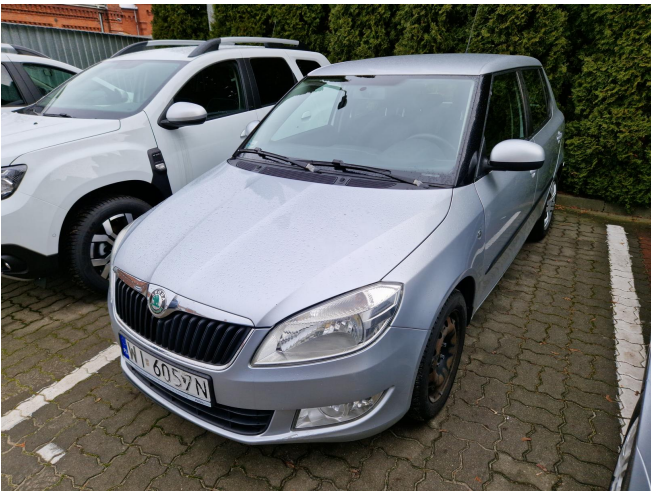
Dok. fot. z dnia 13.03.2023 fot. nr 3