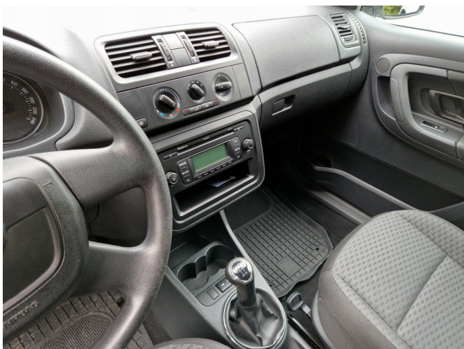
Dok. fot. z dnia 13.03.2023 fot. nr 11