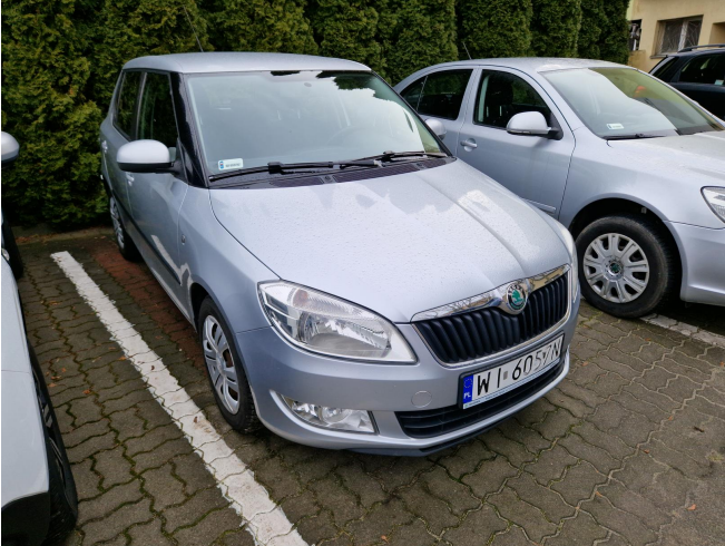
Dok. fot. z dnia 13.03.2023 fot. nr 1