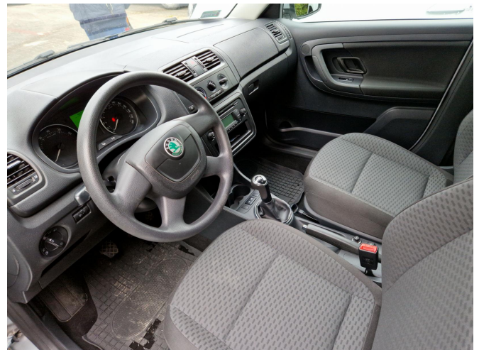
Dok. fot. z dnia 13.03.2023 fot. nr 6