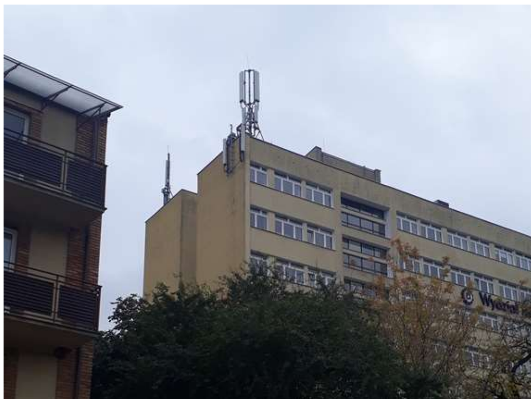
Fot. 1: Widoki anten stacji bazowej ID: BT12046, zlokalizowanej: ul. Nadbystrzycka 36, 20-618 Lublin