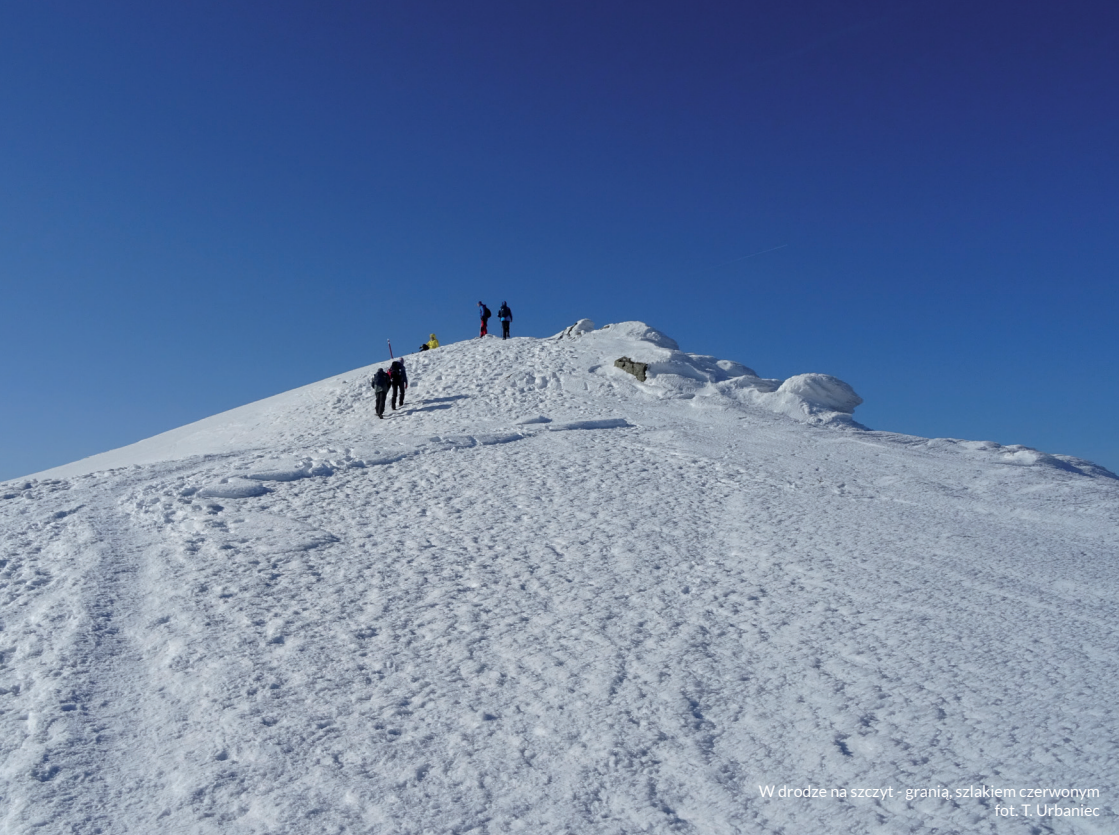
W drodze na szczyt - granią, szlakiem czerwonym