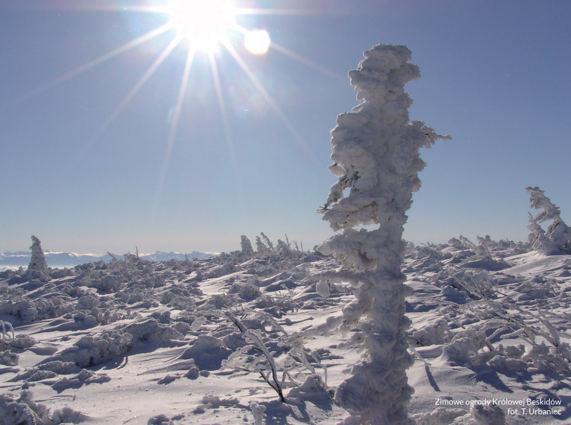
Zimowe ogrody Królowej Beskidów