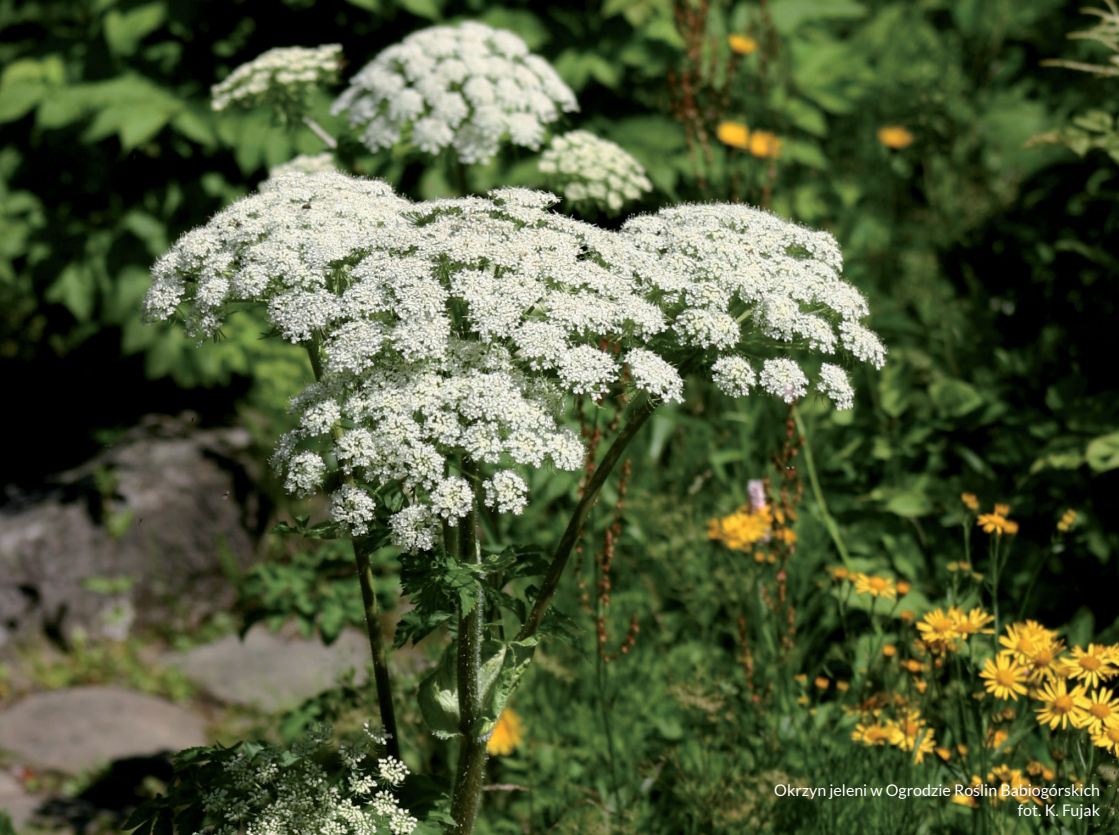
Okrzyn jeleni w Ogrodzie Roślin Babiogórskich