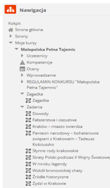
Obraz 2. Widok materiałów zawartych na platformie

Na platformie stwierdzono brak: zagadki matematyczno-przyrodniczej, 12 szkoleń (lekcji) online dedykowanych zagadce matematyczno-przyrodniczej, 2 szkoleń (lekcji) online dedykowanych zagadce humanistycznej, tj. działań do realizacji których, zgodnie z ofertą, zobowiązał się Zleceniobiorca. Nie było również zakładki „baza wiedzy”.