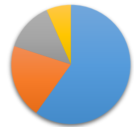
Wykres 3. Pracownicy korzystający ze wsparcia KFS w 2023 r. wg wieku.

■ Mikropracodawcy ■ Mali pracodawcy ■ Średni pracodawcy ■ Duży pracodawcy