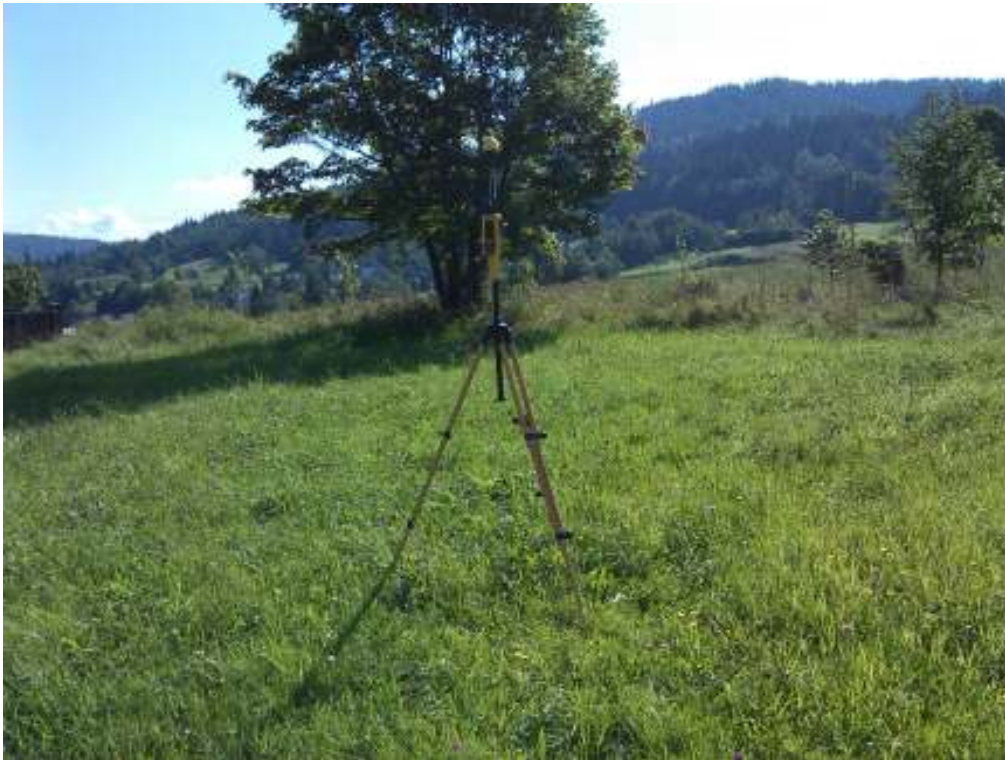
Fot.3. Rejon badań, widok w kierunku północnym