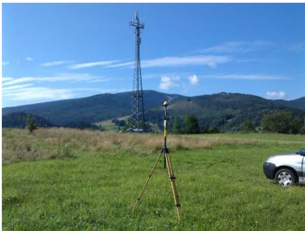
Fot.1. Rejon badań, widok w kierunku masztu radiokomunikacyjnego