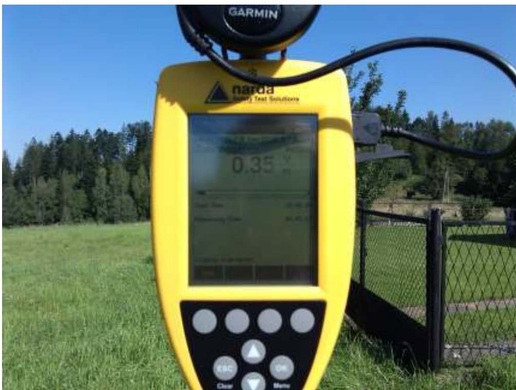
Fot.4. Przyrząd pomiarowy w trakcie prowadzonego badania