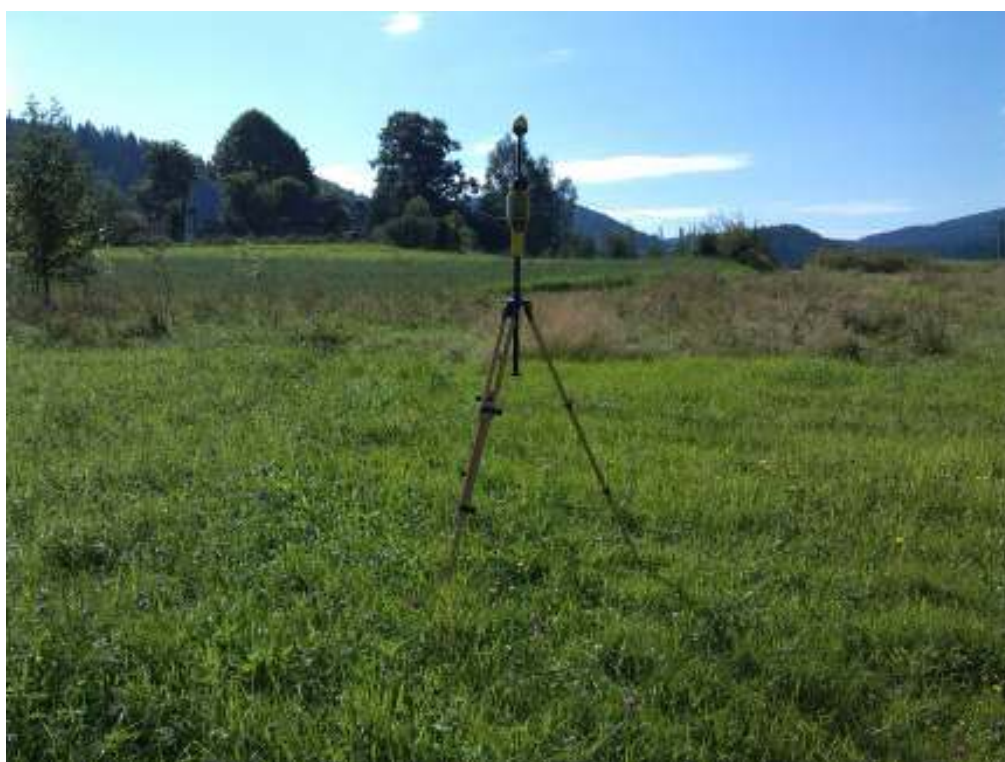
Fot.2. Rejon badań, widok w kierunku budynku mieszkalnego przy ul. Widokowej