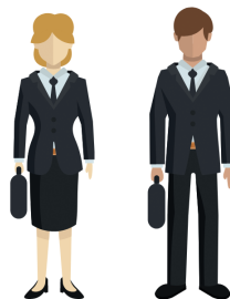
Rysunek 2 – Infografika „Warto pamiętać”

Istotne jest zarówno to jak naprawdę wykonujemy obowiązki służbowe, jak i sposób, w jaki jest to odbierane. Zła opinia może być równie szkodliwa jak rzeczywiste uchybienia.