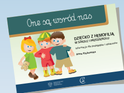
DZIECKO Z HEMOFILIĄ W SZKOLE I PRZEDSZKOLU