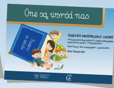
DZIECKO PRZEWLEKLE CHORE PSYCHOLOGICZNE ASPEKTY FUNKCJONOWANIA DZIECKA W SZKOLE I PRZEDSZKOLU