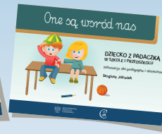
DZIECKO Z PADACZKĄ W SZKOLE I PRZEDSZKOLU