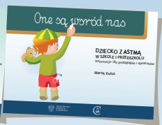
DZIECKO Z ASTMĄ W SZKOLE I PRZEDSZKOLU