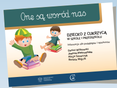
DZIECKO Z CUKRZYCĄ W SZKOLE I PRZEDSZKOLU

Dotychczas w serii „One są wśród nas” ukazały się: