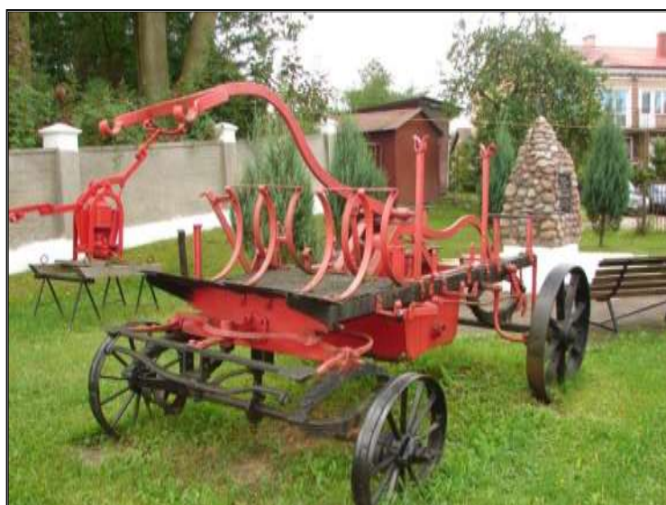
Fot. 18. Sikawka konna czterokołowa.

W Izbie Tradycji znajdują się obecnie między innymi eksponaty takie jak: - Sikawki czterokołowe konne 1869 r. - szt. 2