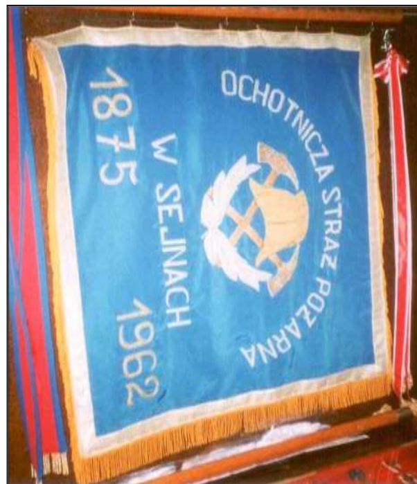
Fot. 8. Sztandar jednostki nadany w 1962 roku, obecnie wiszący w gablocie Izby Tradycji Pożarniczej przy KP PSP w Sejnach.