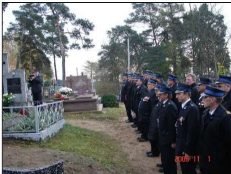
Fot. 43. Święto zmarłych 1 listopad 2006 r.

Strażacy OSP Sejny pamiętają o swoich zmarłych kolegach i jak co roku zapalają symboliczną świeczkę na ich grobach.