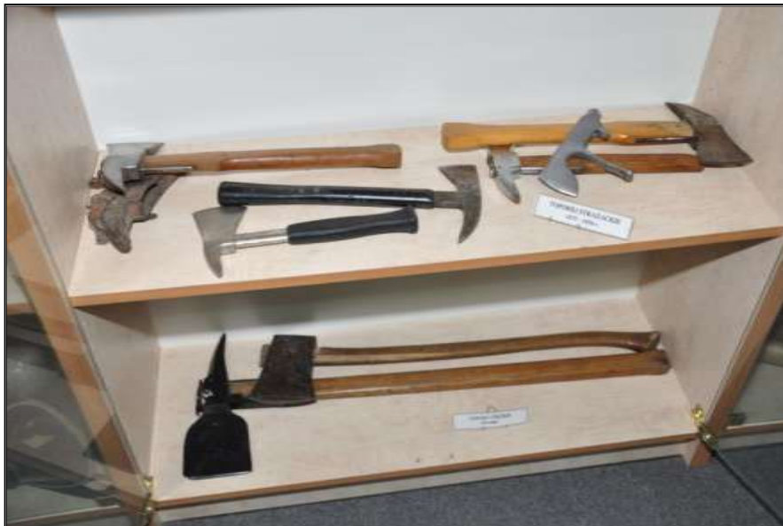
Fot. 22. Toporki i topory strażackie.

- Smok, zbieracze itp. Toporki, topory, sagany, bosaki - XX wiek - szt. 6