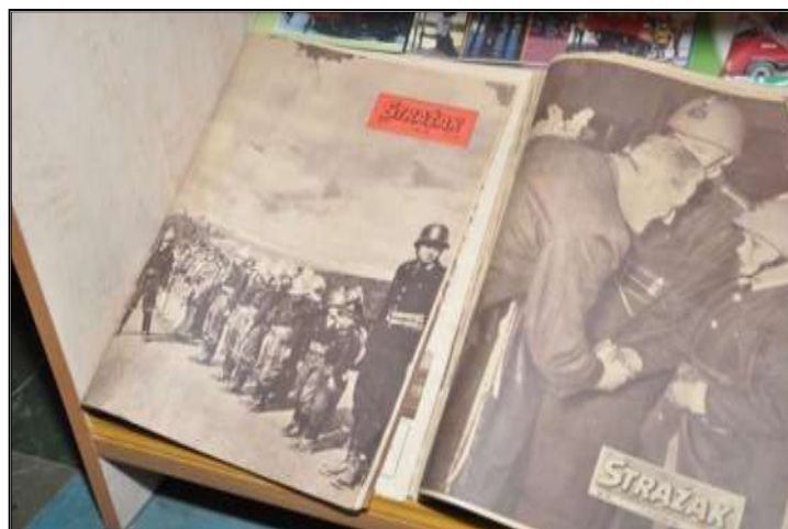
Fot. 31. Prasa pożarnicza.

- Roczniki prasy pożarniczej Strażak, Przegląd Pożarniczy, Biuletyn Techniczny itp.