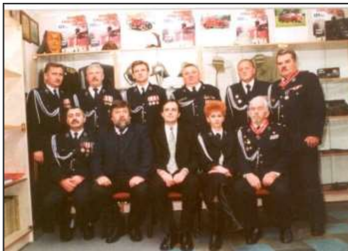
Fot. 33. Zarząd OSP Sejny w latach 2001-2006.