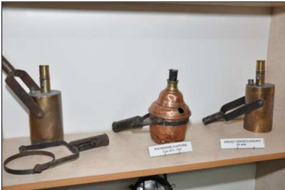
Fot. 25. Pochodnie naftowe miedziane i mosiężne.

- Pochodnie naftowe miedziane i mosiężne z lat 1875 - 1943 - szt. 5