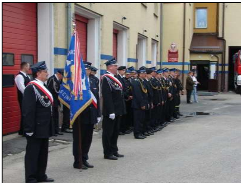
Fot. 47. Poczest sztandarowy OSP Sejny oraz strażacy podczas obchodów „Dnia Strażaka”.

Strażacy OSP Sejny wspólnie ze strażakami Państwowej straży Pożarnej uczestniczą w dniu 29 maja 2009 roku w obchodach „Dnia Strażaka”