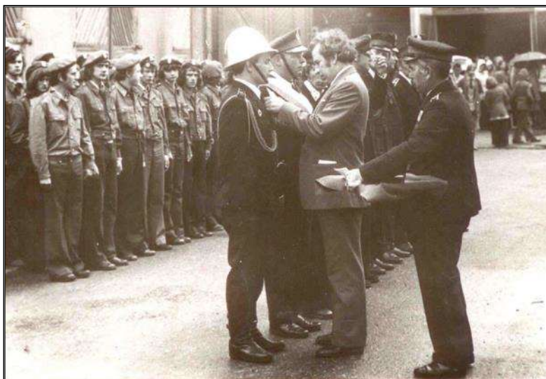
Fot. 13. Uroczysta zbiórka z okazji obchodów 100-lecia OSP w Sejnach.

Z okazji jubileuszu odbywa się uroczysta zbiórka, na której wręczono odznaczenia i medale wyróżniającym się strażakom.