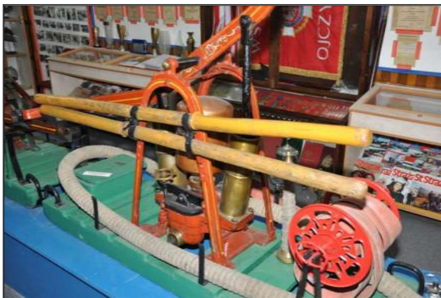
Fot. 19. Sikawka przenośna dwucylindrowa.

- Sikawki przenośne dwu i jedno cylindrowe przewożne na dwukołowym wózku z 1850 r. i 1855 r. szt. 3