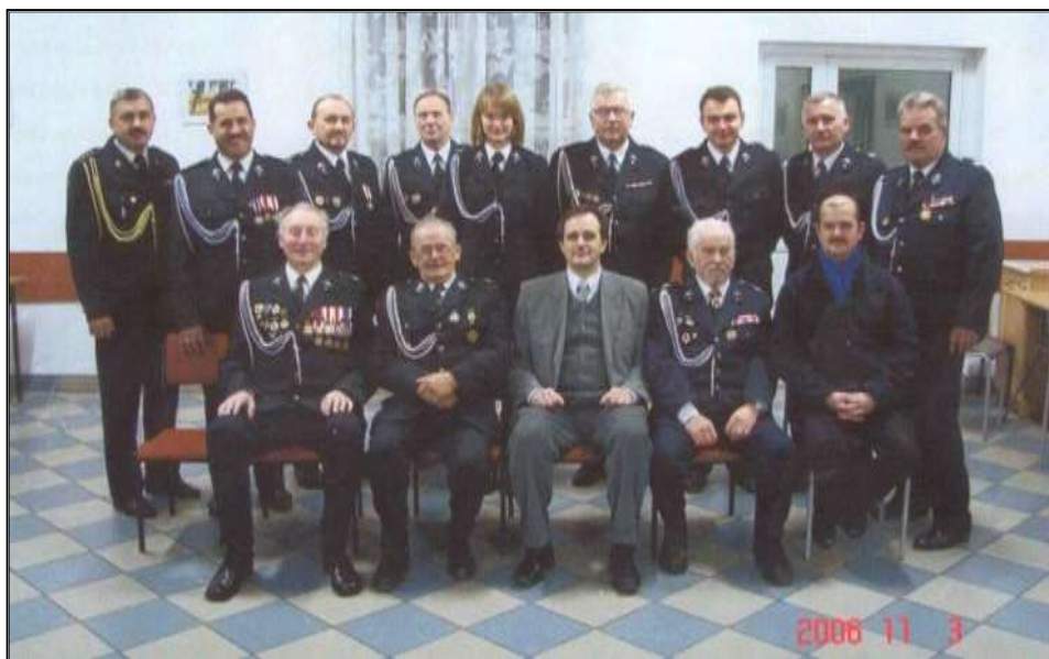
Fot. 39. Zarząd OSP Sejny w latach 2006 do dnia dzisiejszego z Burmistrzem Miasta Sejny Janem Stanisławem Kapem.

W dniu 16 lutego 2006 roku walne zebranie poszerza Zarząd OSP Sejny do szesnastu osób wraz z komisją rewizyjną.