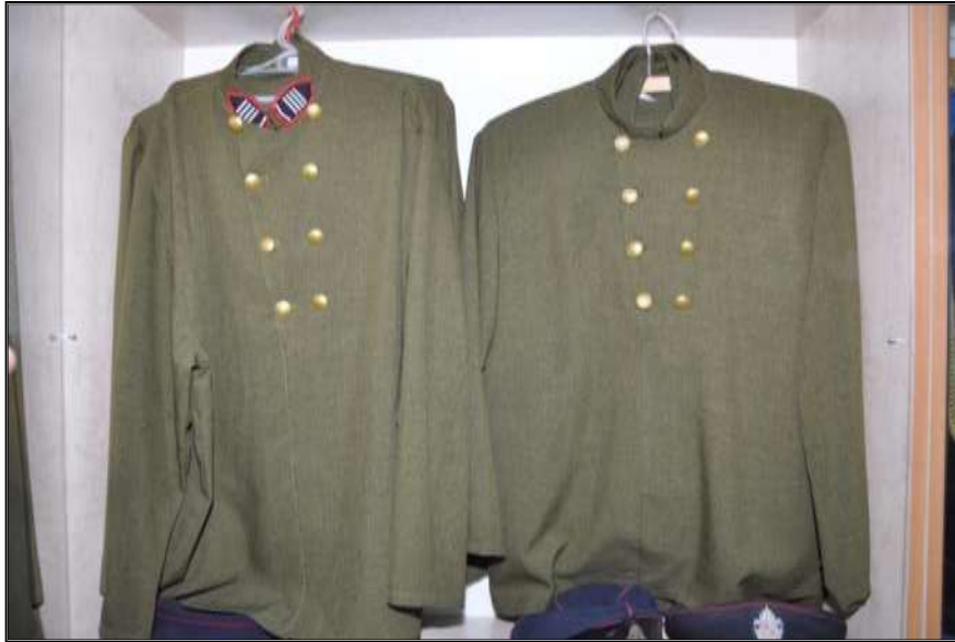
Fot. 30. Repliki mundurów strażackich z XIX wieku.