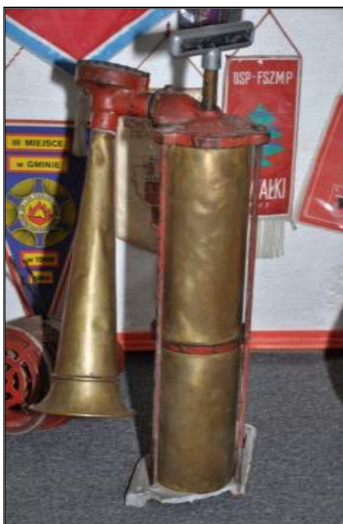
Fot. 24. Mosiężny tyfon.