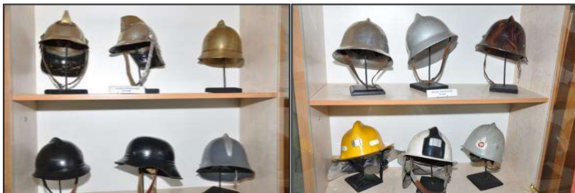
Fot. 26. Hełmy strażackie.

- Kaski i hełmy mosiężne, żelazne, ebonitowe - XIX - XX wiek - szt. 19