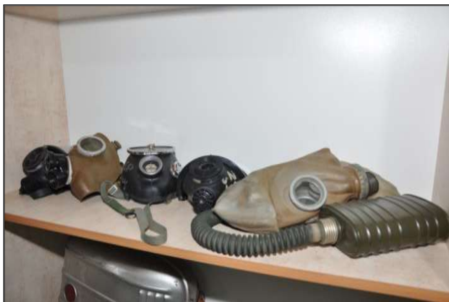
Fot. 27. Maski wojskowe i strażackie.