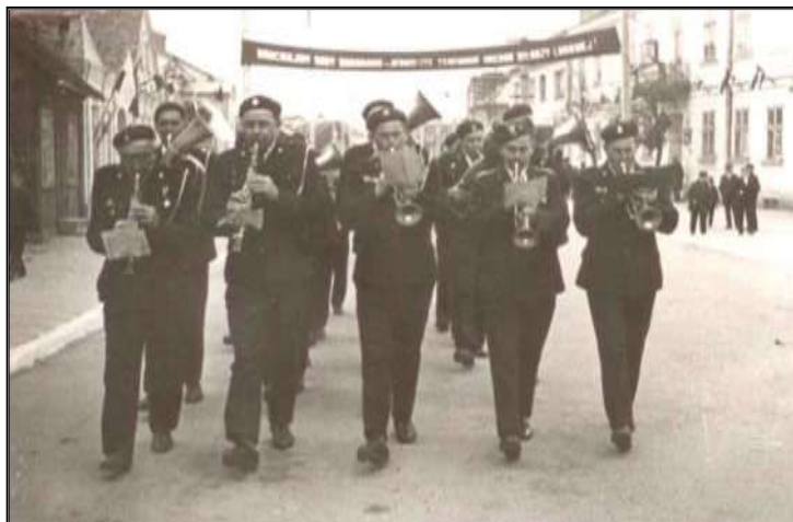
Fot. 9. Orkiestra OSP Sejny podczas przemarszu ulicami miasta.