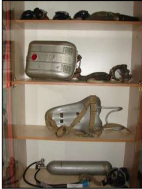
Fot. 28. Aparaty tlenowe polskie.

- Aparaty tlenowe polskie z 1955 r. - szt. 2