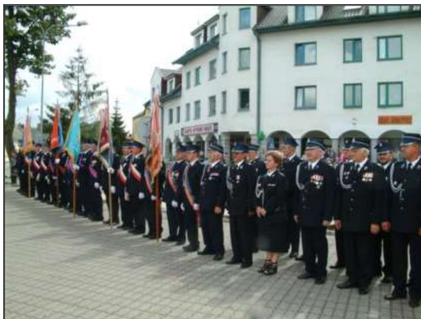
Fot. 35. Poczty sztandarowe oraz strażacy OSP przybyli na uroczystość 130-lecia OSP Sejny.

Z placu przed jednostką nastąpił uroczysty przemarsz pododdziału na Mszę Świętą do Sejneńskiej Bazyliki a dalsza część uroczystości odbywała się na placu przy „Pomniku Powstania Sejneńskiego”.