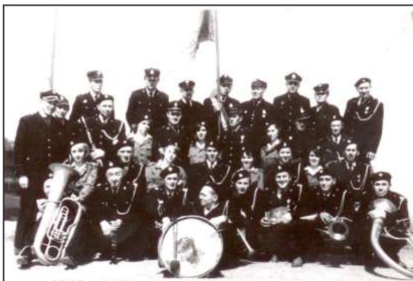
Fot. 16. Orkiestra Strażacka przy OSP w Sejnach rok 1975.

Przy Ochotniczej Straży Pożarnej prężnie działa orkiestra strażacka.