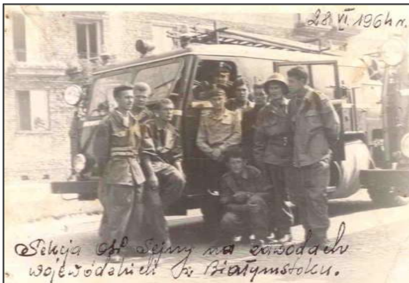
Fot. 8. Sekcja OSP Sejny na zawodach wojewódzkich w Białymstoku 28 czerwca 1964 r.

pożar mimo starań strażaków rozprzestrzenił się i objął swym zasięgiem 100 ha lasu. Zadymienie odczuwalne było w promieniu 10 km. Pożar został zatrzymany na wysokości zrównanej z ziemią w czasie wojny przez Niemców wsi Czerwony Krzyż. W 1964 roku prawie w rok po największym pożarze lasu w Maćkowej Rudzie wybucha kolejny, jeszcze większy powierzchniowo pożar lasu w Mułach. Odległość miejsca powstania pożaru od najbliższych jednostek straży pożarnych wynosiła 20 km. Długi czas dojazdu oraz mała wówczas ilość pojazdów pożarniczych spowodowały swobodne rozprzestrzenienie się pożaru na powierzchnię 181 ha. W 1964 roku organizowane są I Powiatowe Zawody Pożarnicze, w których jednostka OSP Sejny zajmuje pierwsze miejsce. W tymże roku, jako reprezentacja powiatu sejneńskiego Ochotnicza Straż Pożarna w Sejnach startuje 13 czerwca 1964 roku w zawodach wojewódzkich w Białymstoku. 16