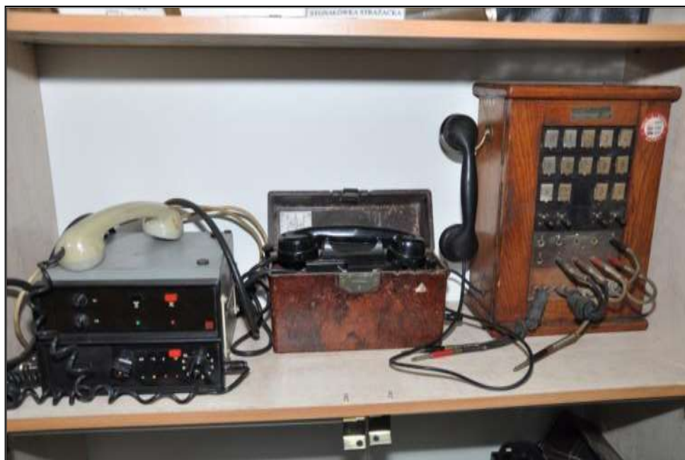
Fot. 25. Aparaty telefoniczne.

- Aparat telefoniczny typu wojskowego w obudowie ebonitowej 1930 r. - szt. 2