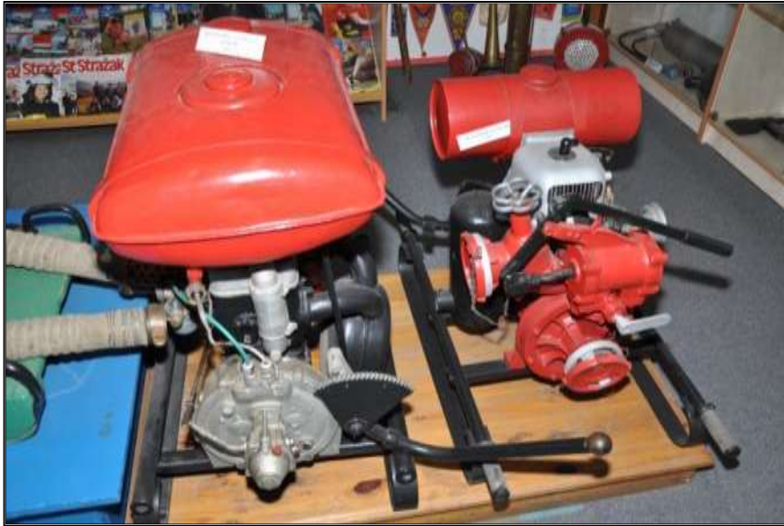
Fot. 21. Motopompy pożarnicze.

- Motopompy LEOPOLIA typu M-800 z 1948 r. i M-400 z 1956 r. - szt. 2