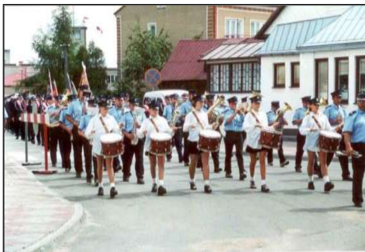
Fot. 32. Przemarsz strażaków ulicami miasta z remizy do Bazyliki w Sejnach podczas obchodów 125-lecia istnienia jednostki OSP Sejny.

W 2000 roku jednostka obchodzi jubileusz 125-lecia powstania.