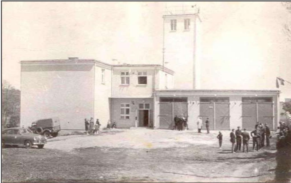
Fot. 7. Remiza OSP Sejny wybudowana w latach 1959 -1962.