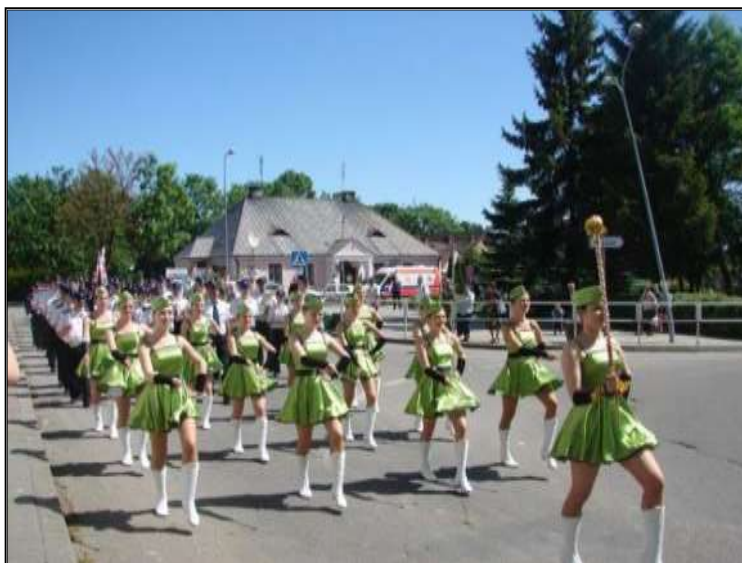
Fot. 45. Zespół Marżonetek „Ladys” wraz z orkiestrą dętą przy OSP w Sejnach podczas obchodów Dnia Strażaka 31 maja 2008 r.