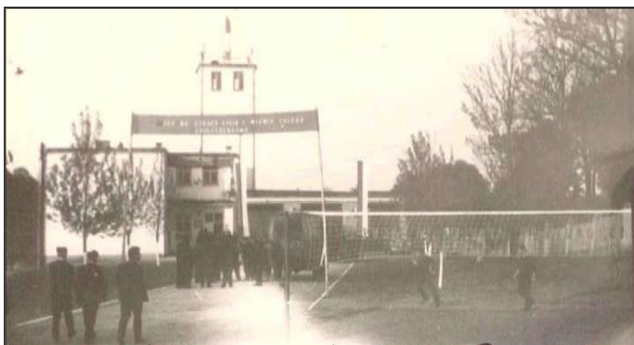
Fot. 10. Obchody „Dnia Strażaka” 22 maj 1964 r. Na zdjęciu widoczne wybudowane boisko do piłki siatkowej.

W roku 1964 z inicjatywy dh. Ryszarda Tomczyka jednostka przystępuje do budowy boiska do piłki siatkowej przy budynku strażnicy.