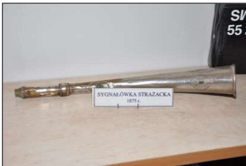
Fot. 23. Sygnałówka mosiężna 1875 r.