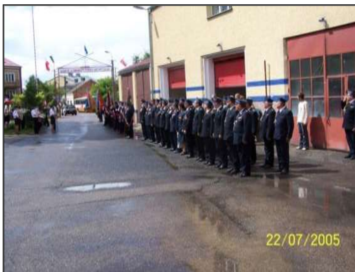
Fot. 34. Uroczysta zbiórka strażaków z okazji 130-lecia OSP Sejny.

W dniu 22 lipca 2005 jednostka Ochotniczej Straży Pożarnej w Sejnach obchodzi 130 lecie.