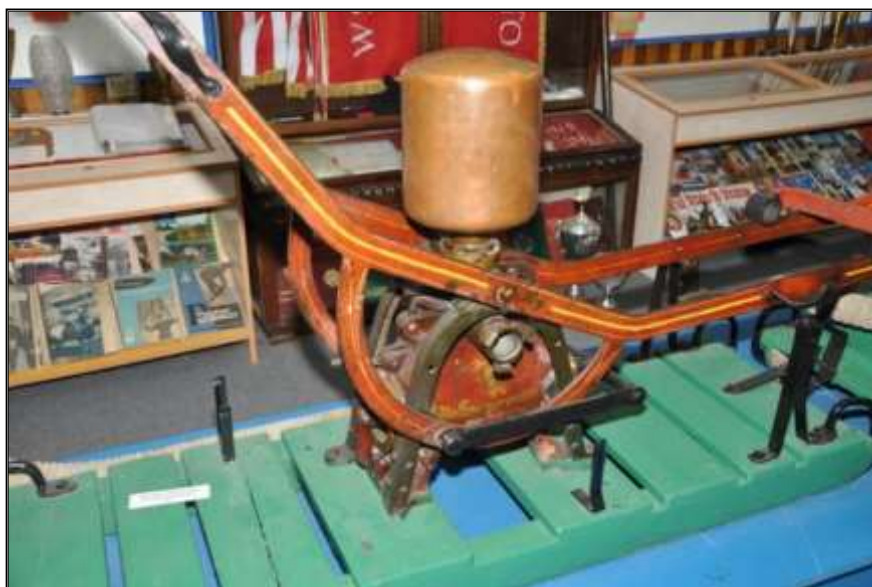
Fot. 20. Sikawka przenośna jednocylindrowa.