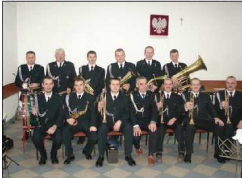
Fot. 40. Orkiestra Dęta przy OSP w Sejnach.

W dniu 11 czerwca 2006r. w Puńsku nad jeziorem Sejwy przeprowadzono IV Powiatowe Zawody Sportowo - Pożarnicze jednostek OSP. W zawodach wzięło udział 10 drużyn OSP z Powiatu Sejny. Jednostka OSP Sejny w konkurencji ćwiczenie bojowe zajmuje II miejsce a w konkurencji sztafeta pożarnicza III miejsce. W klasyfikacji ogólnej zdobywa W-ce Mistrzostwo Powiatu zaraz za OSP Smolany.