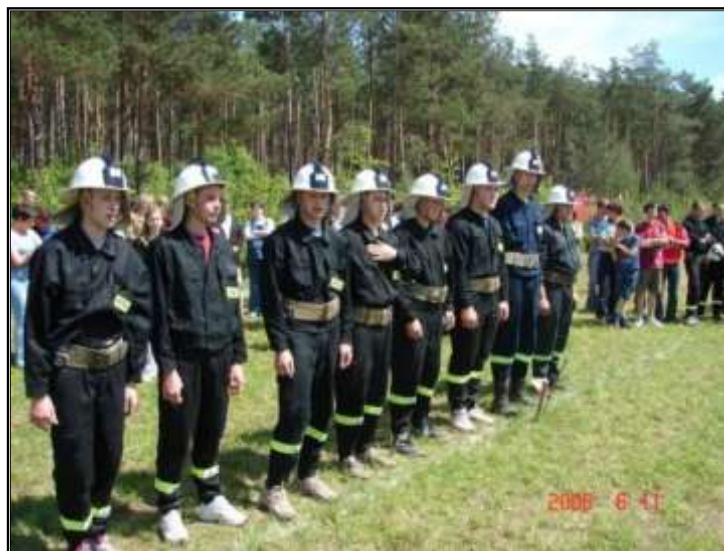
Fot. 42. Drużyna OSP Sejny przygotowująca się do startu w zawodach powiatowych jednostek OSP.

W dniu 11 czerwca 2006r. w Puńsku nad jeziorem Sejwy przeprowadzono IV Powiatowe Zawody Sportowo - Pożarnicze jednostek OSP. W zawodach wzięło udział 10 drużyn OSP z Powiatu Sejny. Jednostka OSP Sejny w konkurencji ćwiczenie bojowe zajmuje II miejsce a w konkurencji sztafeta pożarnicza III miejsce. W klasyfikacji ogólnej zdobywa W-ce Mistrzostwo Powiatu zaraz za OSP Smolany.