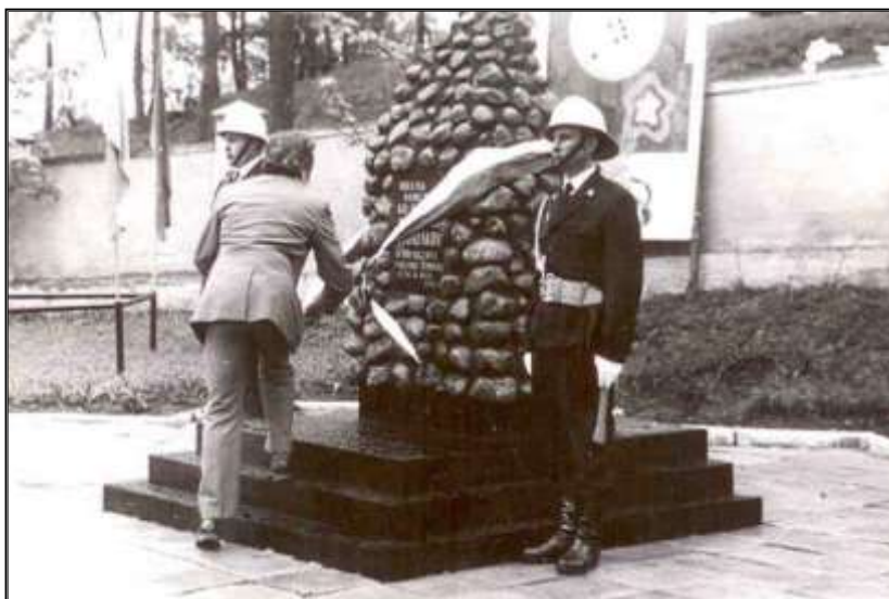
Fot. 14. Odsłonięcie obelisku poświęconego zmarłym strażakom.

Z okazji obchodów 100-lecia powstania jednostki, na placu przy komendzie zostaje odsłonięty obelisk poświęcony pamięci po zmarłych strażakach.