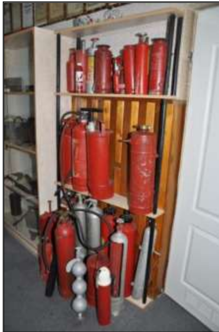
Fot. 29. Gaśnice: wodne, pianowe, śniegowe, proszkowe, tetrowe, halonowe - Źródło: Zdjęcie ze zbiorów własnych.

- Gaśnice produkcji polskiej, niemieckiej, radzieckiej - wodne, pianowe, śniegowe, proszkowe, tetrowe, halonowe z lat 1930 - 1970 - szt. 24