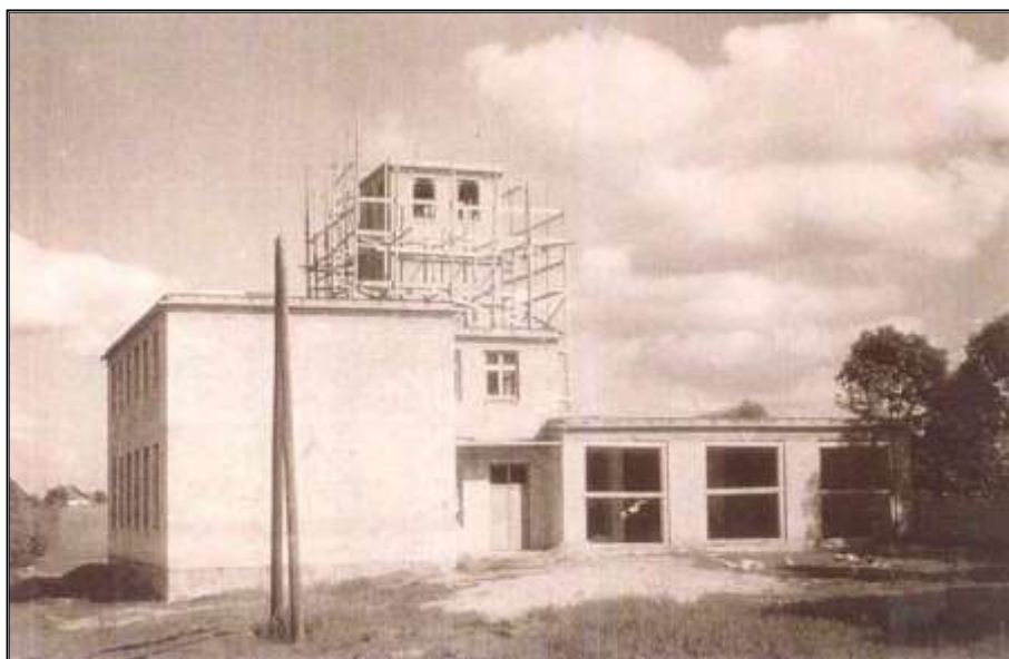
Fot. 6. Budowa wieży remizy OSP Sejny.

zostały zalane zbrojoną płytą. Tu również szczególnym zaangażowaniem wykazali się: Franciszek Kap, Kazimierz Kap, Witold Sikorski, Bronisław Radzewicz. 14