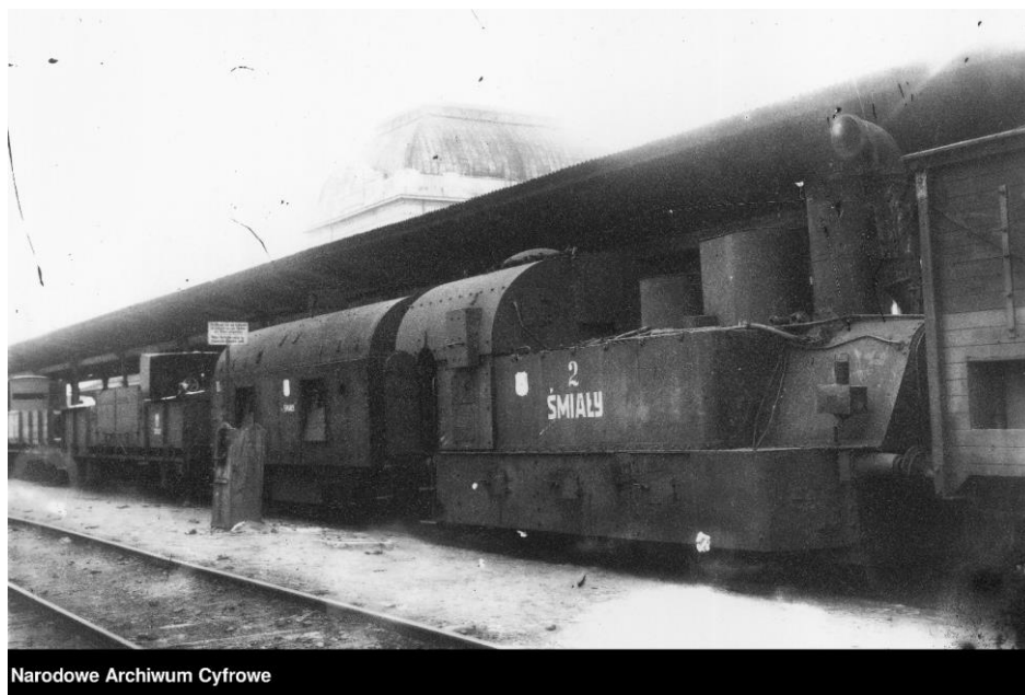
Pociąg pancerny „Śmiały”.