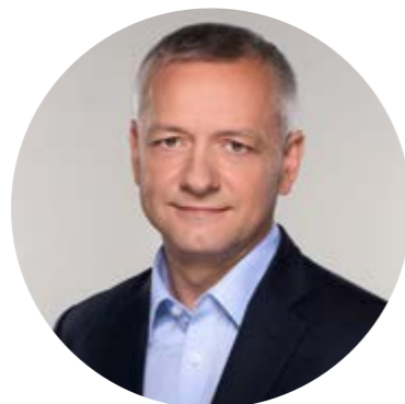
Marek Zagórski Minister of Digital Affairs