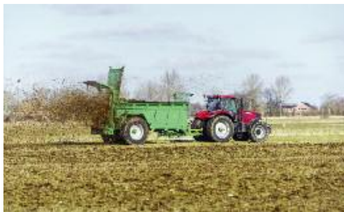
W ramach PROW 2014-2020 przewidziano wsparcie na zakup nowych maszyn i urządzeń do aplikowania nawozów naturalnych

W ramach PROW 2014-2020 przewidziana jest realizacja instrumentu, który pozwoli na ukierunkowanie pomocy na doposażenie gospodarstw, w których jest prowadzona produkcja zwierzęca, w płyty lub zbiorniki do przechowywania nawozów naturalnych lub pasz soczystych oraz na zakup nowych maszyn i urządzeń do aplikowania nawozów naturalnych. Pomoc będzie przyznawana w formie refundacji części kosztów kwalifikowalnych operacji. Poziom refundacji wyniesie 50% kosztów kwalifikowalnych (60% w przypadku młodych rolników). Maksymalna wysokość pomocy udzielonej jednemu beneficjentowi i na jedno gospodarstwo rolne wyniesie do 100 tys. zł. Nabór wniosków w ramach ww. operacji planowany jest w grudniu 2018 r.