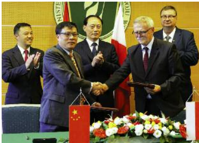
Podpisanie Memorandum of Understanding o współpracy między Chińską Akademią Nauk Rolniczych i Instytutem Uprawy Nawożenia i Gleboznawstwa – PIB w Puławach

– To kolejne dobre spotkanie po wizycie, którą w Polsce na początku lipca br. złożył chiński minister generalnej administracji celnej (GACC) Ni Yufeng, a także po ubiegłorocznej wizycie w Polsce ministra rolnictwa Chińskiej Republiki Ludowej Han Changfu – powiedział chiński wiceminister i dodał, że strona chińska zainteresowana jest korzystaniem z polskich doświadczeń w zakresie zarządzania obszarami wiejskimi i produkcją ekologiczną. Właśnie z uwagi na zainteresowanie rolnictwem ekologicznym, delegacja chińska odbyła wizytę studyjną w Centrum Doradztwa Rolniczego w Radomiu, połączoną z wizytą w gospodarstwie ekologicznym w Radzanowie.