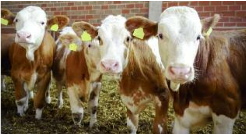
oraz zakup inwentarza żywego

ści składek i rozłożenia ich na dogodnie raty, a także umorzenie w całości lub w części bieżących składek; • zastosowanie przez Krajowy Ośrodek Wsparcia Rolnictwa na podstawie art. 23a ustawy z dnia 19 października 1991 r. o gospodarowaniu