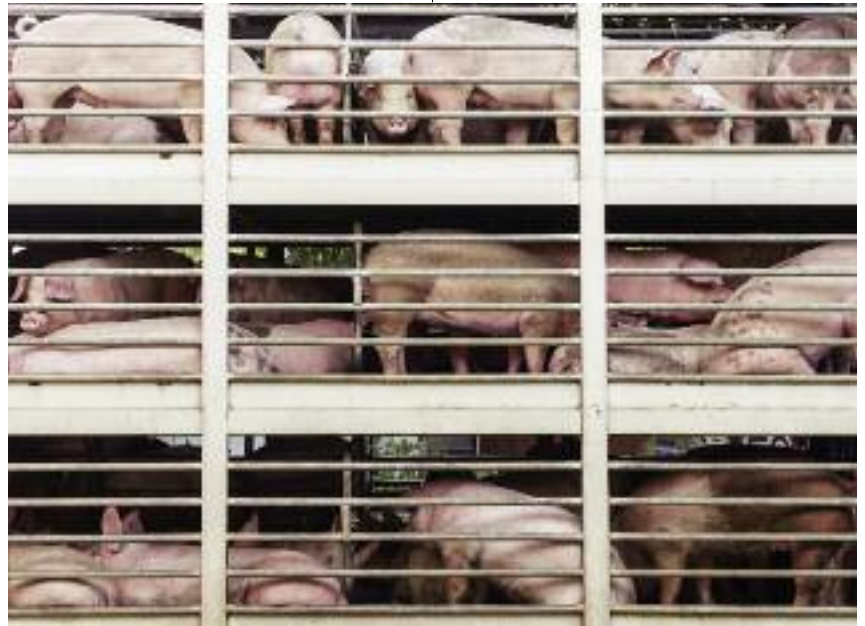
Konieczne jest prowadzenie rejestru środków transportu do przewozu świń wjeżdżających na teren gospodarstwa

również pracownicy stali, jak i sezonowi, nie mogą pracować w innych gospodarstwach, gdzie obsługują świnie lub posiadają własnych świń. Istnieje duże zagrożenie, że w przypadku zakażenia świń w innym gospodarstwie, wirus ASF zostanie przez nich przypadkowo lub celowo