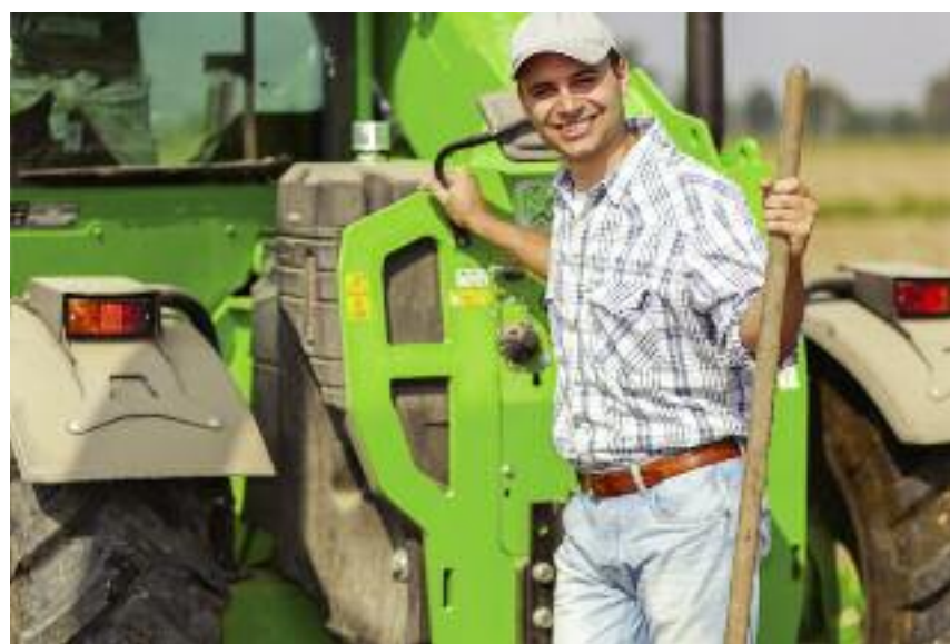
W ramach I filaru zaproponowano dodatkowe, dobrowolne wsparcie dla młodych rolników rozpoczynających działalność

Łącznie z II filarem na wsparcie wymiany pokoleń musi zostać przeznaczona kwota odpowiadająca co najmniej 2% środków I filara.