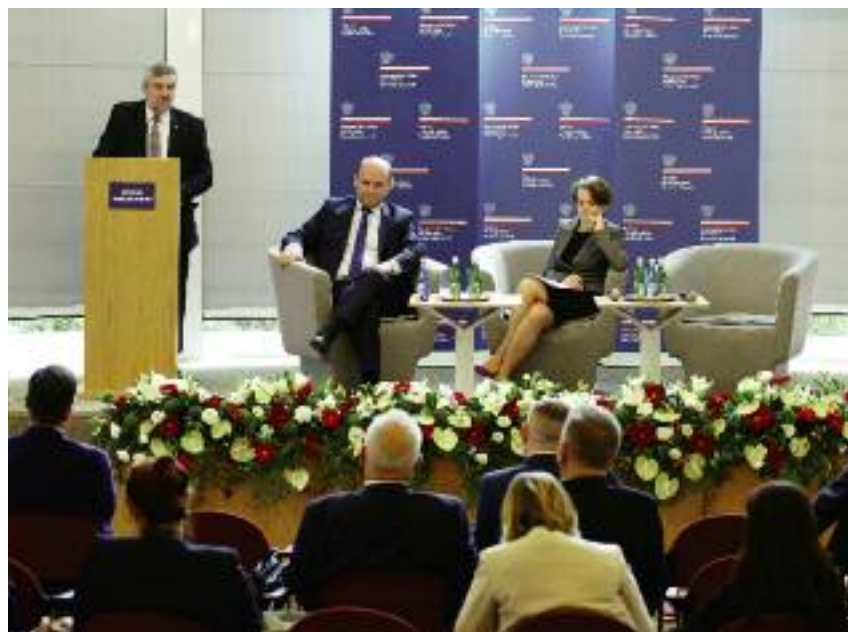
Szef resortu rolnictwa uczestniczył w pierwszych dniach lipca w organizowanym przez MSZ dorocznym spotkaniu szefów placówek

Minister Jan Krzysztof Ardanowski przedstawił rolę Krajowego Ośrodka Wsparcia Rolnictwa w systemie promocji polskiego sektora rolno-spożywczego. Zwrócił uwagę