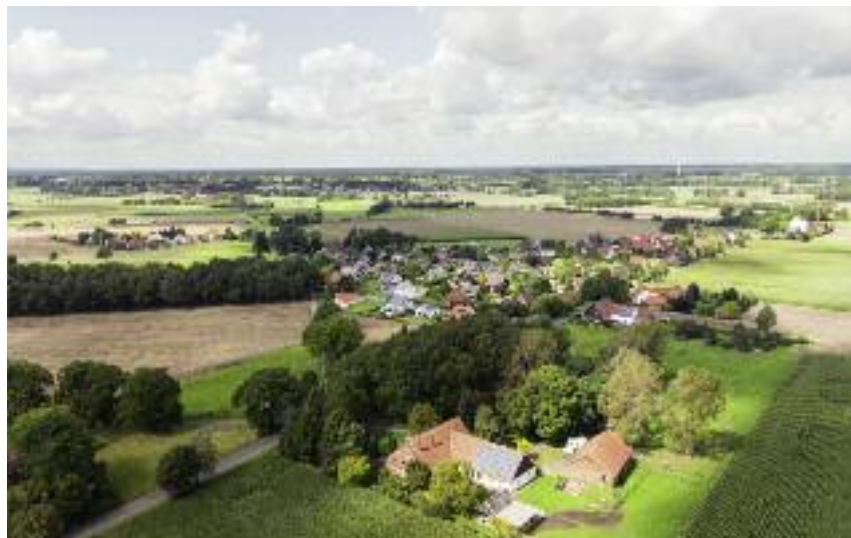
1 czerwca br. Komisja Europejska opublikowała pakiet propozycji legislacyjnych, dotyczących WPR na lata 2021-2027, otwierając tym formalny proces dyskusji nad przepisami prawnymi dotyczącymi przyszłego kształtu tej polityki

Plany strategiczne będą kluczowym elementem nowego sposobu wdrażania WPR. Każde państwo członkowskie będzie przygotowywać kompleksowy plan wsparcia, w którym zaprogramowane będzie wdrożenie instrumentów obu filarów WPR: płatności bezpośrednich, tzw. programów sektorowych (przeniesionych ze wspólnej organizacji rynków, np. wsparcie sektora owoców i warzyw, sektora pszczelarstwa) oraz instrumentów rozwoju obszarów wiejskich. Każdy plan strategiczny ma obejmować: ocenę potrzeb, strategię interwencji, opis elementów wspólnych dla kilku interwencji, opis płatności bezpośrednich i interwencji dotyczących rozwoju obszarów wiejskich określonych w strategii, opis programów sektorowych i ich interwencje, plan finansowy, opis struktur zarządzania i koordynacji, ocenę uwarunkowań ex-ante. Każdy plan zawierać ma też opis elementów