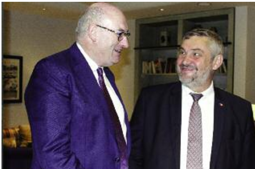
Spotkanie z komisarzem Philem Hoganem dotyczyło głównie problemów związanych z suszą w Polsce oraz konieczności podjęcia odpowiednich działań by pomóc rolnikom, którzy ponieśli dotkliwe straty