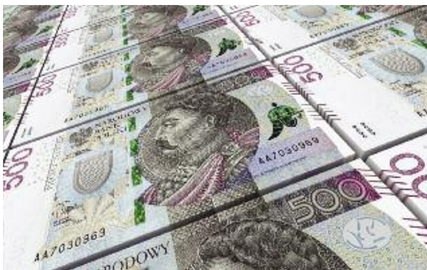
Dzięki zwiększeniu limitu dostępnych środków finansowych na „Modernizację gospodarstw” wsparciem zostanie objęte ponad 15,5 tys. wniosków. Maksymalna kwota pomocy wynosi 500 tys. zł

Na opublikowanych 18 czerwca 2018 r. listach określających kolejność przysługiwania pomocy w naborze z 2018 r. na inwestycje w Modernizację gospodarstw rolnych w limicie dostępnych środków mieściło się 11 986 wniosków. Dzięki nowelizacji rozporządzenia wsparciem zostanie objęte 15 539 wniosków. Liczba ta będzie ulegać zmianom ze względu na zmieniający się kurs wymiany euro na złote oraz toczący się proces weryfikacji wniosków. Wsparcie przyznawane jest w postaci dofinansowania kosztów poniesionych na realizację danej inwestycji. Poziom dofinanso-