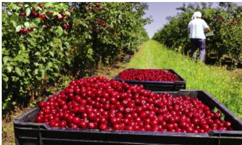
Łączny czas świadczenia przez pomocnika pomocy na podstawie zawartych umów nie może przekroczyć 180 dni w danym roku kalendarzowym

Rolnik jest zobowiązany do samodzielnego wyliczenia składek i ich terminowego opłacenia, bez wezwania ze strony KRUS. Szczegółowy sposób ustalania wymiaru składki dziennej na ubezpieczenie wypadkowe, chorobowe i macierzyńskie oraz tabela z wyliczoną wysokością składek dziennych oraz wysokością składki na ubezpieczenie zdrowotne w danym miesiącu dostępna jest na stronie internetowej KRUS. Składki na ubezpieczenie wypadkowe, chorobowe i ma-