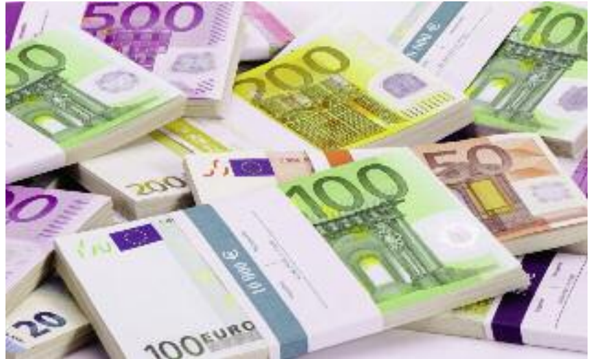
Ustanowiona zostanie specjalna rezerwa kryzysowa finansowana ze środków I filara WPR

KE proponuje możliwość przesunięcia do 15% środków pomiędzy filarami WPR. W przypadku przesunięcia z I do II filara państwa członkowskie mają możliwość zwiększenia tego przesunięcia o maksymalnie 15 punktów procentowych na finansowanie działań klimatycznych i środowiskowych (te przesunięte środki nie wymagałyby współfinansowania krajowego) i o maksymalnie 2 punkty procentowe, w przypadku gdy te dodatkowe przesuwane środki wykorzystane będą na premie dla rolników rozpoczynających działalność.