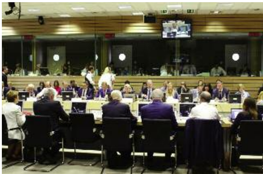
Polskiej delegacji na posiedzeniu Rady Ministrów rolnictwa UE przewodniczył minister Jan Krzysztof Ardanowski

– Nowy model wdrażania WPR poprzez plan strategiczny wymagać będzie wielu dodatkowych analiz i ocen co nie służy uproszczeniu. Zaproponowana wspólna dla obu filarów procedura zatwierdzania i zmiany planu strategicznego rodzi ryzyko opóźnień lub wręcz braku możliwości uruchomienia na czas płatności bezpośrednich – podkreślił polski minister.