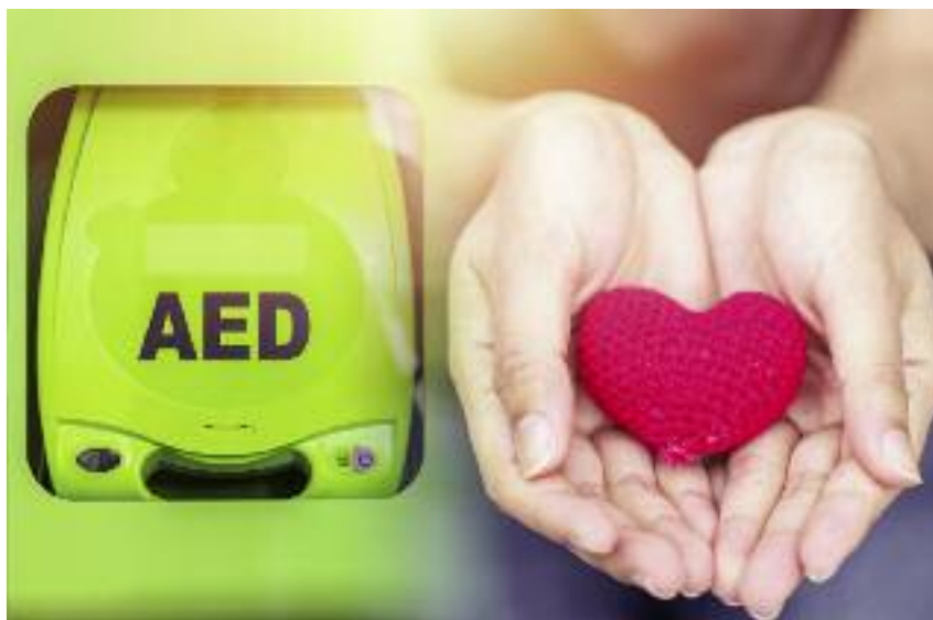
Nagrodą główną dla zwycięskiej OSP jest defibrylator AED

Prace konkursowe można przysyłać do 15 sierpnia 2018 r. na ad-