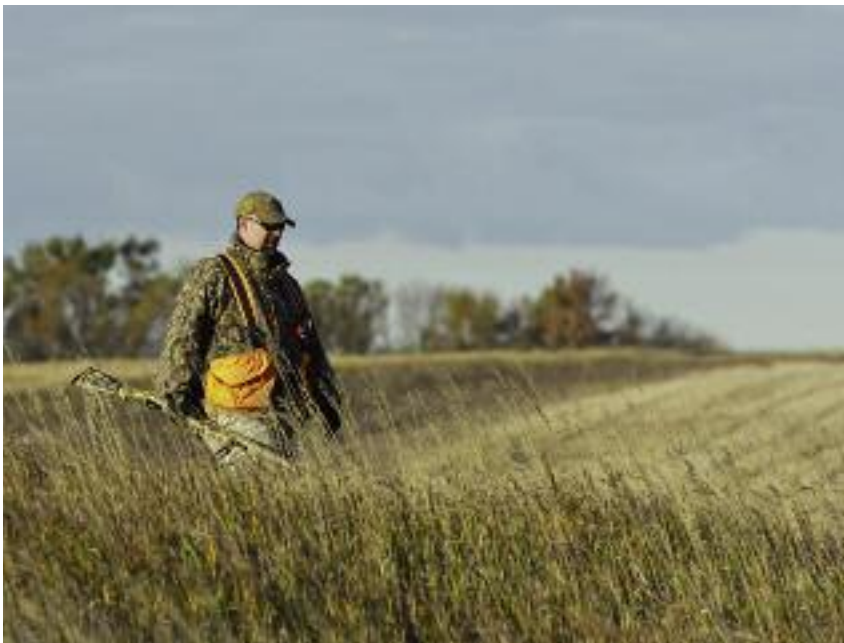
Osoby uczestniczące w polowaniu lub odłowieniu zwierząt łownych mają 72. godzinny zakaz wykonywania czynności związanych z obsługą świń

Natomiast zboże zebrane w jakimkolwiek miejscu w Polsce i po odpowiednim wysuszeniu do osiągnięcia parametrów wilgotności około 14,5% i odpowiednim przechowaniu uznaje się za całkowicie bezpieczne przy karmieniu świń.