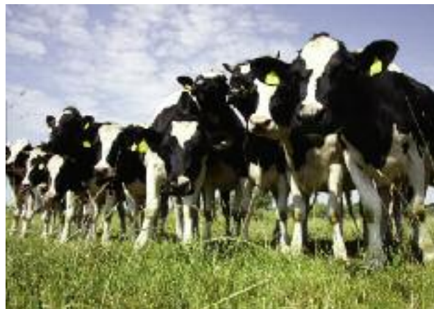
Gospodarstwa dotknięte suszą mogą skorzystać z derogacji w zakresie zazielenienia

Na wniosek ministra Jana Krzysztofa Ardanowskiego Komisja Europejska przygotowała decyzję umożliwiającą rolnikom w Polsce skorzystanie z odstępstwa od zakazu prowadzenia produkcji na ugorach w roku 2018 w ramach zazielenienia.