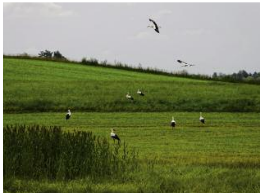
Ochrona przyrody i krajobrazu również znalazła się wśród ogólnoeuropejskich celów przyszłej WPR

W celu uproszczenia, KE proponuje odejście od obecnego kształtu