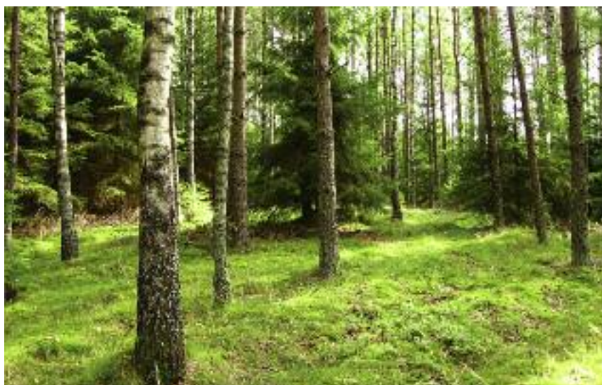
W ramach działania „Inwestycje w rozwój obszarów leśnych...” utworzono obszar pomocy umożliwiający wsparcie lasów prywatnych w wieku 11-60 lat, wymagających nakładów finansowych w celu utrzymania ich w dobrej kondycji