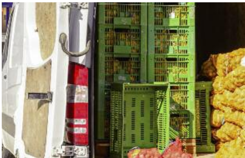
W związku z doniesieniami o nasilającym się procederze przepakowywania ziemniaków i warzyw sprowadzanych z zagranicy i sprzedawania ich jako polskich, w MRiRW podjęto prace nad zmianą przepisów dotyczących kontroli jakości handlowej artykułów rolno-spożywczych

nie go od innych artykułów rolno-spożywczych, w czasie posiadania przez dany podmiot tego artykułu. Podkreślić należy, iż proponowane przepisy dotyczą wskazanej w przepisach ustawy o jakości handlowej artykułów rolno-spożywczych i funkcjonującej definicji „producenta”, która obejmuje nie tylko wytwórców czy importerów, ale także paczkujących oraz inne podmioty wprowadzające do obrotu żywność, w tym także sprzedawców detalicznych, zatem ww. obowiązki dotyczą zapewnienia i do-