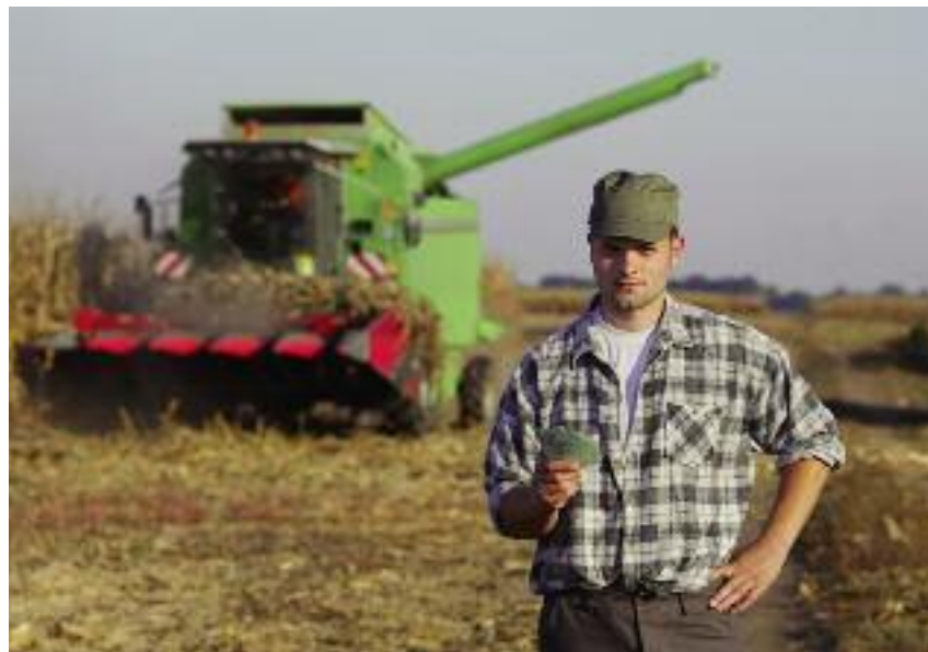
... oraz poprawa pozycji rolników w łańcuchu wartości

po uwzględnieniu kosztów zatrudnienia ponoszonych przez rolnika. Kwoty powyżej 100 tys. euro nie będą wypłacane. Kwoty uzyskane w wyniku zastosowania cappingu mają być wykorzystane w tym sa-