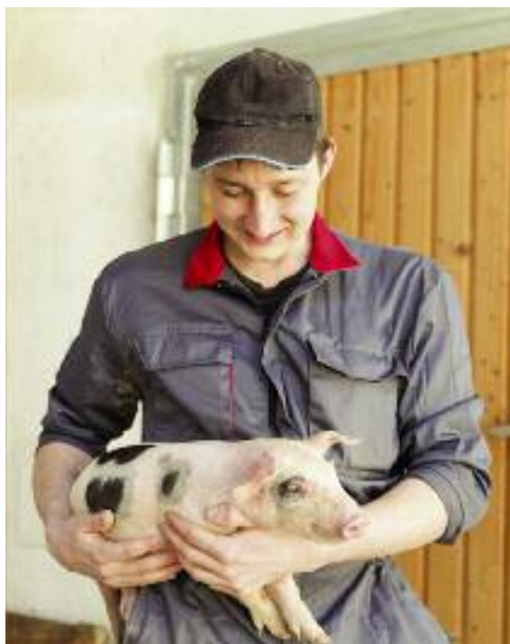
Projekt ustawy przewiduje zwiększenie elastyczności w stosowanych metodach znakowania świń

ba stada urodzenia i przebywa w tej siedzibie stada dłużej niż 30 dni;