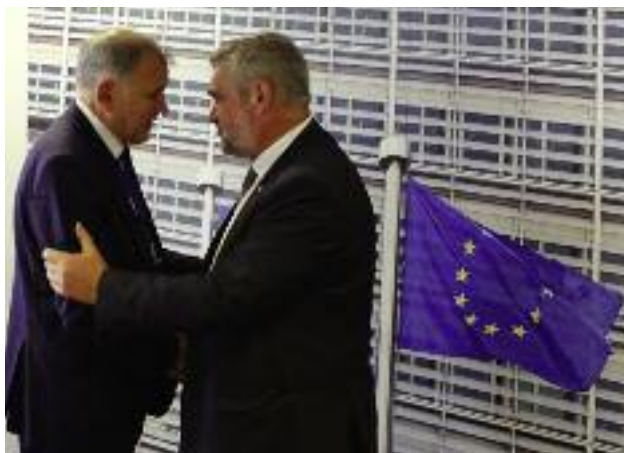
Przedmiotem rozmów z komisarzem ds. Zdrowia i Bezpieczeństwa Żywności, Vytenisem Andriukaitisem była sytuacja ASF w Polsce i innych krajach Europy oraz niezbędne działania podejmowane wspólnie z KE by zahamować rozprzestrzenianie się wirusa w państwach UE

Podczas pobytu w Brukseli minister Ardanowski odbył też krótką rozmowę z nowym ministrem rolnictwa Republiki Czech Miroslavem Tomanem. Szef polskiego resortu rolnictwa zaprotestował przeciwko używaniu bardzo ostrych określeń na temat jakości polskiej żywności. Zwrócił się do swojego rozmówcy o podanie konkretnych firm, co do których strona czeska ma zastrzeżenia. Podkreślił, że polskie służby podejmą właściwe kroki, aby wyeliminować z rynku nieuczciwych producentów, którzy szkodzą wizerunkowi polskiej żywności. Szef polskiego resortu rolnictwa zwrócił przy tym uwagę, że polska żywność cieszy się dużą popularnością wśród czeskich konsumentów i jest sprowadzana na czeski rynek przez czeskich importerów. Wielu Czechów chętnie kupuje ją także