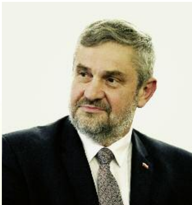
Jan Krzysztof Ardanowski, minister rolnictwa i rozwoju wsi

Polska ma bardzo dobre warunki do rozwoju rolnictwa ekologicznego. Zmienić się jednak musi sposób jego wspierania. Pomoc będzie udzielana tym gospodarstwom, które rzeczywiście wytwarzają produkty zgodnie z zasadami prowadzenia gospodarstwa ekologicznego. Trzeba skończyć z dotychczasową fikcją dopłat do rolnictwa ekologicznego. Wzoruję się trochę na rozwiąza-