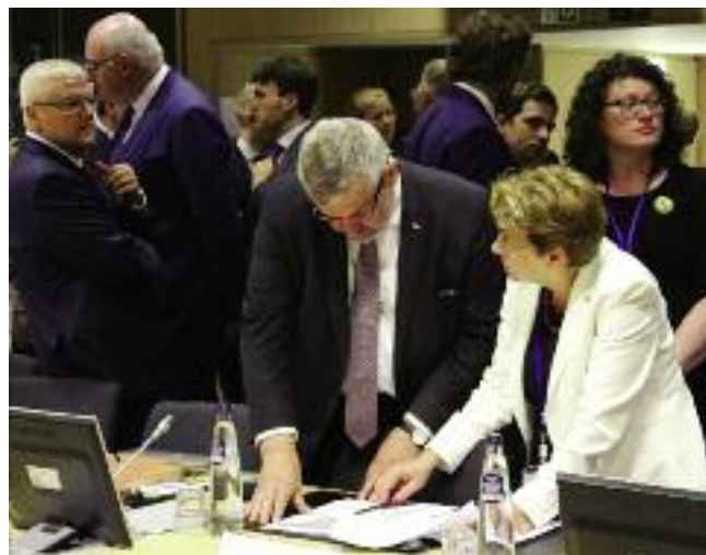
Podczas posiedzenia Rady, minister Ardanowski podkreślił, że nowe rozwiązania po 2020 r. muszą zapewnić rzeczywiste uproszczenie dla rolników i administracji

blemów związanych z suszą w Polsce oraz konieczności podjęcia odpowiednich działań by pomóc rolnikom, którzy ponieśli dotkliwe straty.