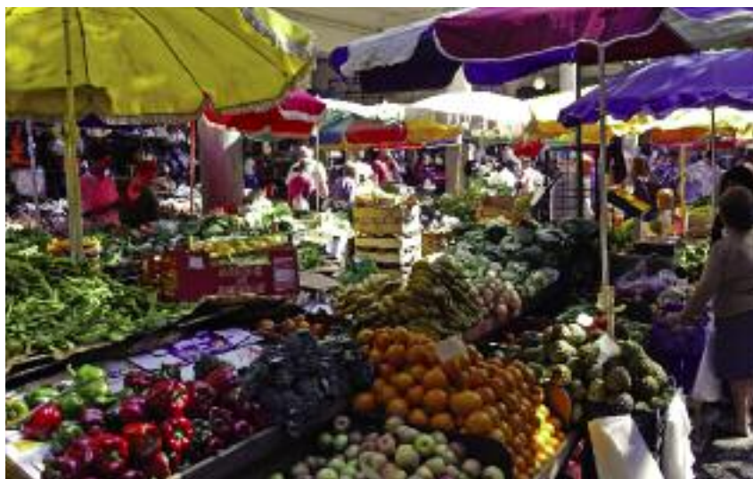
W nowej ustawie wprowadzono rozwiązania prawne zabezpieczające producentów rolnych przed ewentualną nieuczciwą konkurencją

jest istotne z uwagi na nietrwałość tych produktów. Analogiczne rozwiązanie zostało zaproponowane w ustawie o jakości handlowej artykułów rolno-spożywczych w odniesieniu do owoców i warzyw nieobjętych regulacjami UE, np. ziemniaków, bananów.