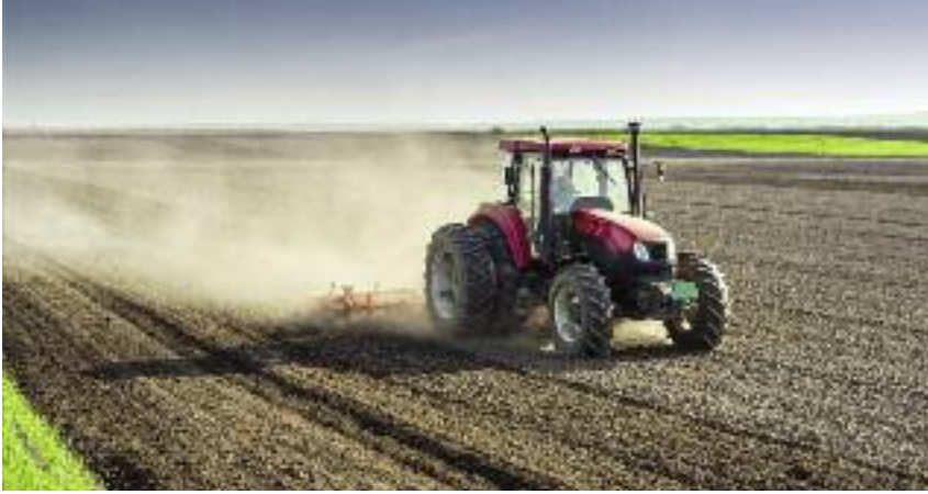
Kredyt obrotowy może zostać przeznaczony m.in. na zakup paliwa na cele rolnicze ...

żej 30% średniej rocznej produkcji z ostatnich trzech lat i kumulują się z inną pomocą publiczną udzieloną w związku z tymi szkodami;