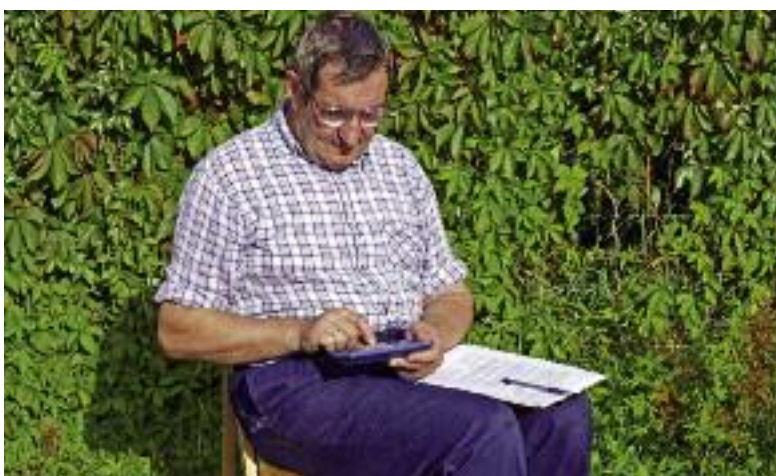
Jednorazowe odszkodowanie z tytułu wypadku przy pracy rolniczej lub rolniczej choroby zawodowej zostało podwyższone do 809 zł za każdy procent stałego lub długotrwałego uszczerbku na zdrowiu

uszczerbku na zdrowiu. Jednorazowe odszkodowanie z tytułu wypadku przy pracy rolniczej lub rolniczej choroby zawodowej jest świadczeniem przysługującym z ubezpieczenia wypadkowego, chorobowego i macierzyńskiego, które finansowane jest z Funduszu Składowego Ubezpieczenia Społecznego Rolników.