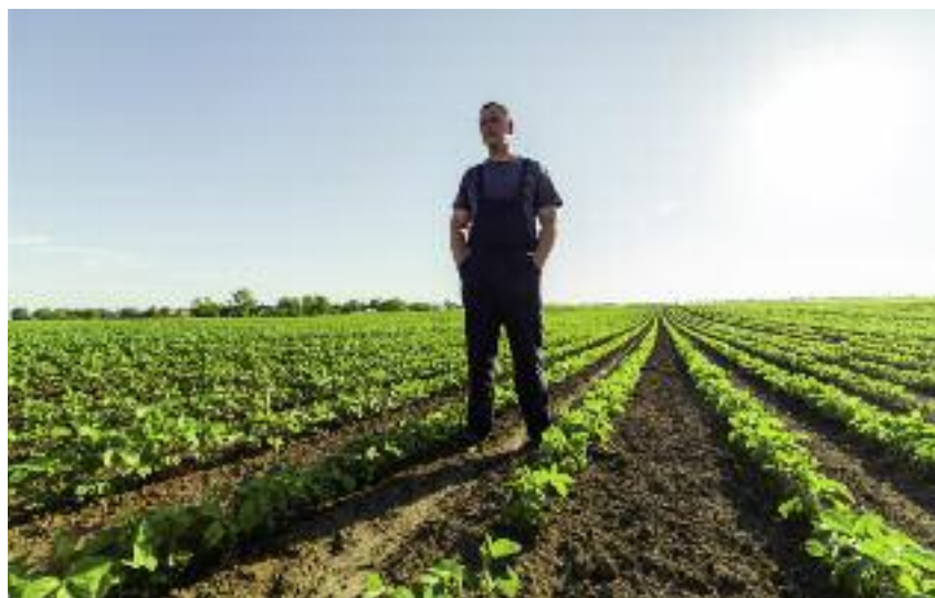
Wśród dziewięciu szczegółowych ogólnoeuropejskich celów dla przyszłej WPR znalazło się przyciąganie nowych rolników i odnowa pokoleniowa wsi...

na poziomie państwa członkowskiego i weryfikowany przez KE w ramach nowej formuły rocznego monitorowania i przeglądu. Wprowa-