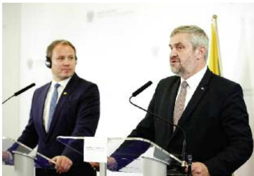
Głównymi tematami spotkania ministra Jana Krzysztofa Ardanowskiego z litewskim ministrem rolnictwa Giedriusem Surplysem, były zagadnienia dotyczące budżetu Wspólnej Polityki Rolnej po 2020 r. oraz walki ze skutkami suszy i walki z wirusem ASF

Szefowie resortów rolnictwa Polski i Litwy zwracali również uwagę na podobne problemy w związku