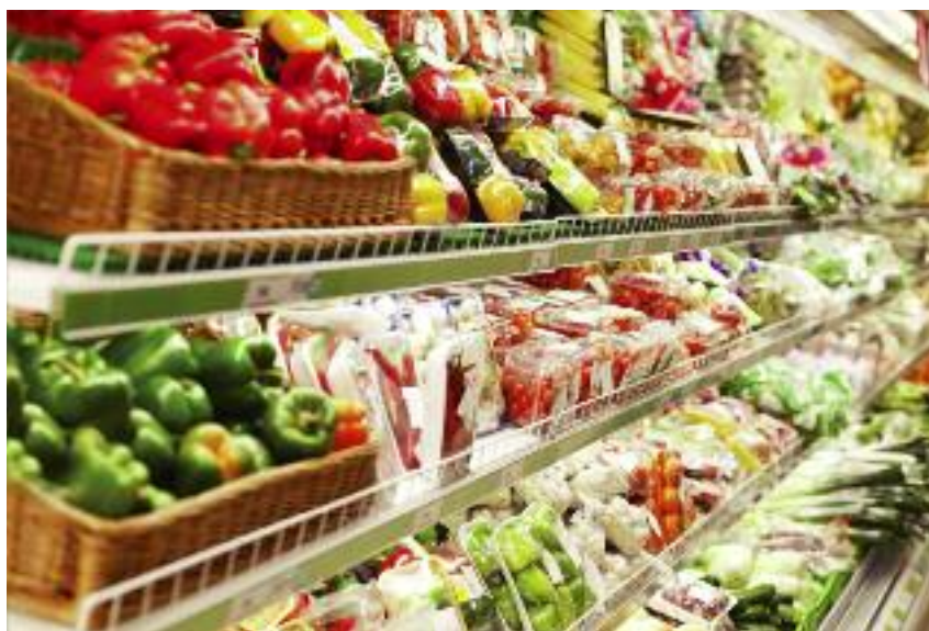
Podniesiona zostanie wysokość kar stosowanych za wprowadzanie do obrotu owoców i warzyw niespełniających wymagań jakości handlowej, w tym szczególnie w odniesieniu do wymogu wskazania państwa pochodzenia

zagrożenie dla polskich upraw. Ponadto producenci rolni wskazywali na przypadki fałszowania przez przedsiębiorców prowadzących obrót roślinami i produktami roślinnymi pochodzenia oferowanych produktów. W odpowiedzi na postulaty środowiska rolniczego Minister Rolnictwa i Rozwoju Wsi wystąpił do służb nadzorujących obrót towarami rolno-spożywczymi w Polsce o zintensyfikowanie działań kontrolnych w tym zakresie. W ich wyniku stwierdzono porażenie ziemniaków pochodzących z Egiptu przez bakterię kwarantannową Ralstonia solanacearum . W konsekwencji Minister Rolnictwa i Rozwoju Wsi podjął działania na forum Unii Europejskiej na rzecz ograniczenia importu ziemniaków z tego kraju.