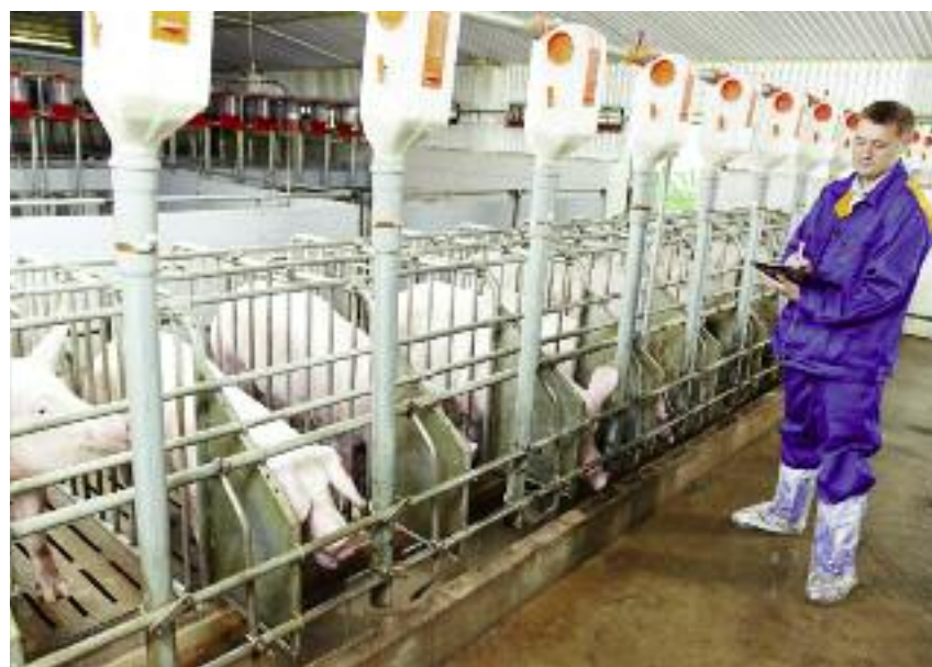
Zgodnie z zasadami bioasekuracji świnię mogą być karmione wyłącznie paszą przetrzymaną w zamkniętych pomieszczeniach, zabezpieczonych przed dostępem zwierząt dzikich i domowych

samochody z zakładów utylizacyjnych mogą być potencjalną przyczyną zawleczenia wirusa ASF na teren gospodarstwa. Często zanim przyjadą do naszego gospodarstwa jeżdżą do innych gospodarstw lub są używane w lesie i na polach. Mogą także przenieść zakażenie do innych gospodarstw, jeśli w naszym gospodarstwie rozwija się choroba, a jeszcze nie zauważyliśmy jej objawów. Dlatego pomimo ograniczenia obowiązku prowadzenia rejestru wyłącznie do samochodów transportujących świń, powinniśmy prowadzić rejestr wszystkich pojazdów wjeżdżających na teren gospodarstwa z ewentualnym wyłączeniem samochodów osobowych gości. Naj-