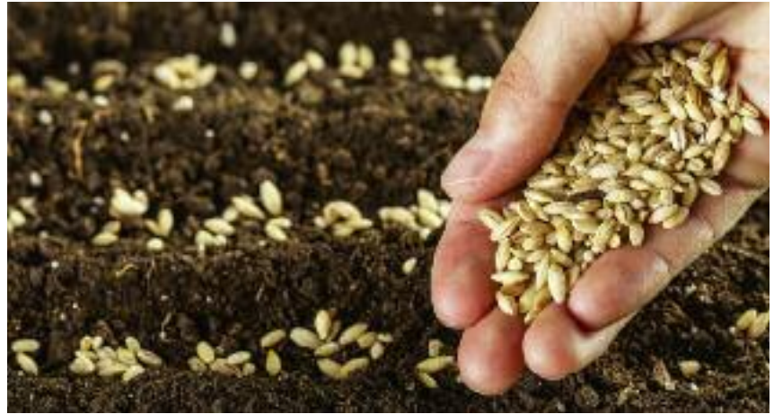
zakup kwalifikowanego materiału siewnego i nawozów...

• udzielenie przez Prezesa Kasy Rolniczego Ubezpieczenia Społecznego, na indywidualny wniosek rolnika, na podstawie ustawy z dnia 20 grudnia 1990 r. o ubezpieczeniu społecznym rolników, pomocy w opłaceniu bieżących składek na ubezpieczenie społeczne oraz regulowaniu zaległości z tego tytułu w formie odroczenia terminu płatno-