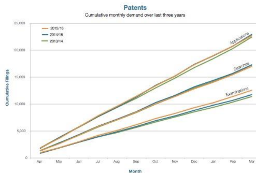
Rys. 2: Wykres ilustruje m.in. ilość złożonych wniosków patentowych ( Applications ) – dane dla lat 2013 – 2016

niedużych przedsiębiorstwach na wczesnych etapach rozwoju. W najbliższym czasie dokonany zostanie przegląd zachęt podatkowych na wydatki na badania i rozwój, w celu poprawienia międzynarodowej konkurencyjności UK w obszarze wsparcia dla działalności R&D w sektorze prywatnym.