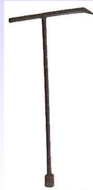
Klucz do stojaka hydrantowego