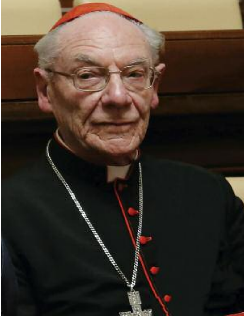
PAUL JOSEPH JEAN POUPARD

Francuz, teolog i historyk, święcenia kapłańskie 1954, święcenia biskupie 1979, rektor Instytutu Katolickiego w Paryżu 1972-1980, biskup pomocniczy Paryża 1979, arcybiskup pełniący obowiązki przewodniczącego Sekretariatu ds. niewierzących Kurii Rzymskiej 1980, kardynał i Przewodniczący Sekretariatu ds. Niewierzących 1985, przewodniczący Papieskiej Rady ds. Kultury 1988-2007, przewodniczący Papieskiej Rady ds. Dialogu Międzyreligijnego 2006-2007.