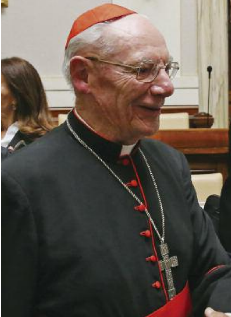
PAUL JOSEPH JEAN POUPARD

A French theologian and historian, ordained to the priesthood in 1954, nominated Bishop in 1979. Rector of the Catholic Institute of Paris 1972-1980, auxiliary Bishop of Paris 1979, Archbishop and President of the Secretariat for Non-Believers at the Roman Curia 1980, Cardinal and President of the Secretariat for Non-Believers 1985, President of the Pontifical Council for Culture 1988-2007, President of the Pontifical Council for Inter-Religious Dialogue 2006-2007.