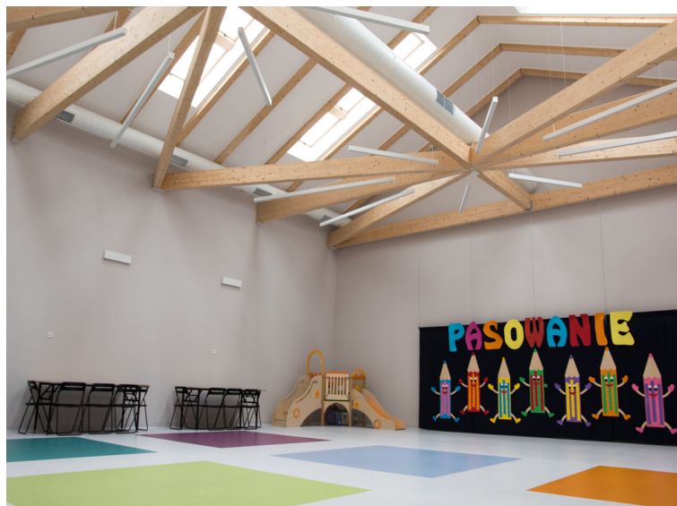
Zdjęcie nr 3. Sala widowiskowa znajdująca się w nowym budynku Przedszkola w Śmiglu przy Al. Bohaterów

Inwestycja, przeprowadzona na terenie Przedszkola w Śmiglu, obejmowała także budowę placu zabaw. Powstały plac zabaw wyposażony został w nowoczesne urządzenia do zabaw oraz piaskownicę. Stanowi odgrodzoną, wydzieloną część na terenie przedszkola.