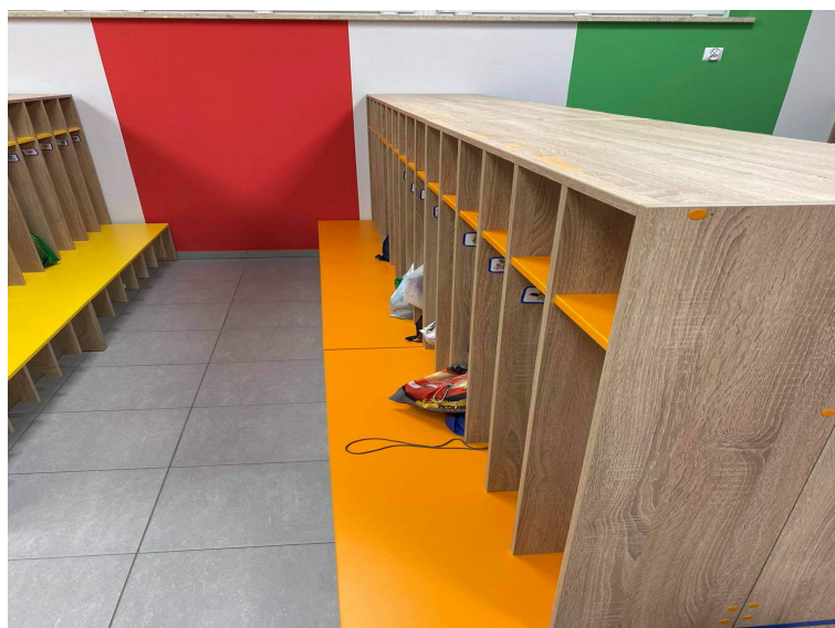
Zdjęcie nr 6. Pomieszczenie szatni w Przedszkolu Publicznym Malowane Misie w Starym Bojanowie