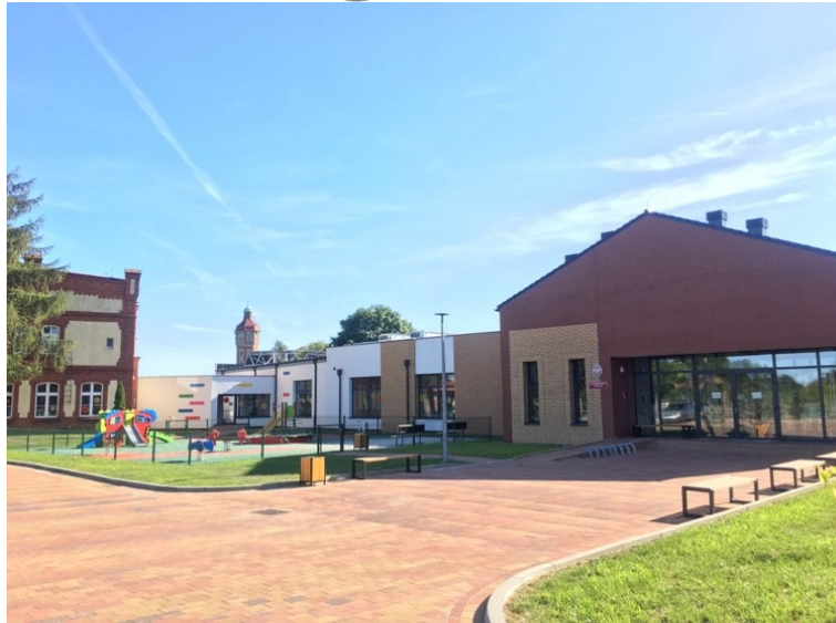
Zdjęcie nr 1. Nowy budynek Przedszkola w Śmiglu