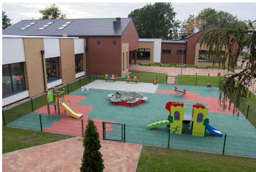
Zdjęcie nr 4. Plac zabaw na terenie Przedszkola w Śmiglu przy Al. Bohaterów

Inwestycja, przeprowadzona na terenie Przedszkola w Śmiglu, obejmowała także budowę placu zabaw. Powstały plac zabaw wyposażony został w nowoczesne urządzenia do zabaw oraz piaskownicę. Stanowi odgrodzoną, wydzieloną część na terenie przedszkola.