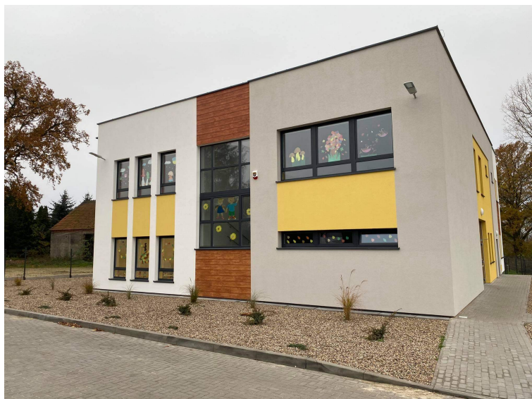
Zdjęcie nr 5. Budynek nowego Przedszkola Publicznego Malowane Misie w Starym Bojanowie

W 2020 roku na terenie powiatu kościańskiego, w nowo oddanym do użytkowania budynku w Starym Bojanowie, powstało nowe przedszkole. Publiczne przedszkole Malowane Misie mieści się w wolnostojącym, piętrowym budynku przy ul. Głównej 29a. Działalność rozpoczęło we wrześniu 2020 roku. Budynek przedszkola obejmuje sale dydaktyczne, zaplecze sanitarne, zaplecze kuchenne oraz pomieszczenia administracyjne. Na terenie należącym do przedszkola powstał też teren rekreacyjny – plac zabaw – wyposażony w certyfikowany sprzęt i urządzenia.