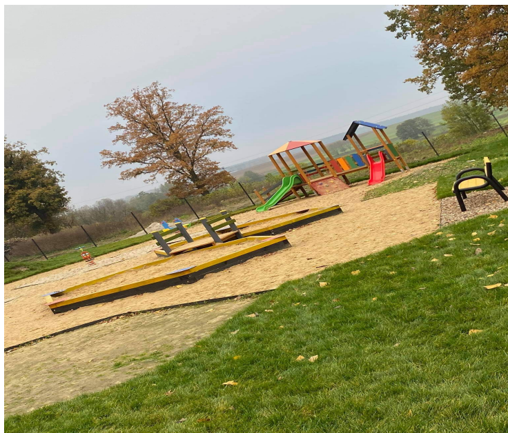
Zdjęcie nr 8. Plac zabaw przy Przedszkolu Publicznym Malowane Misie w Starym Bojanowie