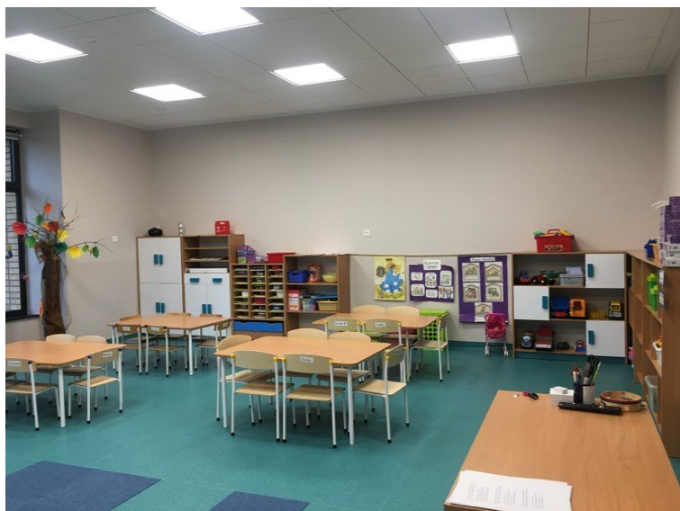
Zdjęcie nr 2. Sala przedszkolna znajdująca się w nowym budynku Przedszkola w Śmiglu przy Al. Bohaterów