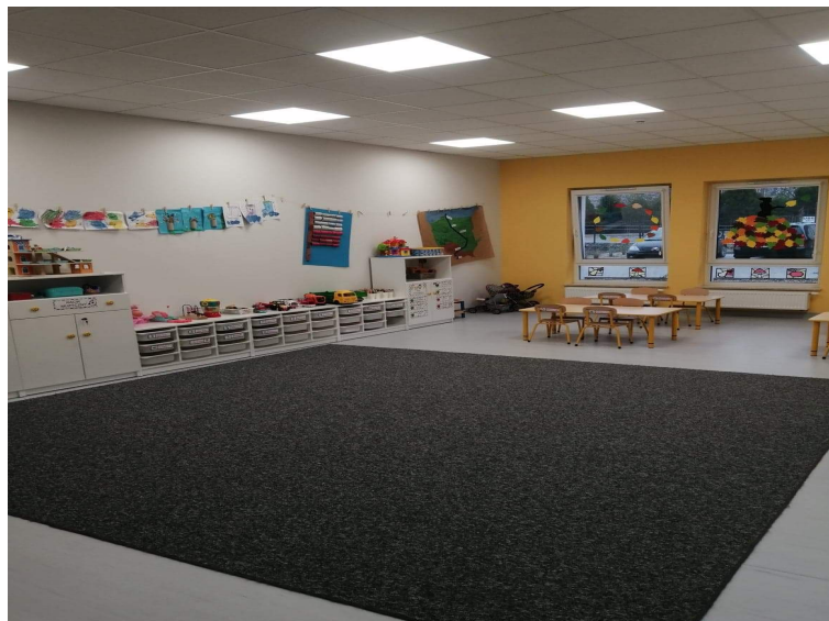
Zdjęcie nr 7. Jedna z sal zajęć w Przedszkolu Publicznym Malowane Misie w Starym Bojanowie