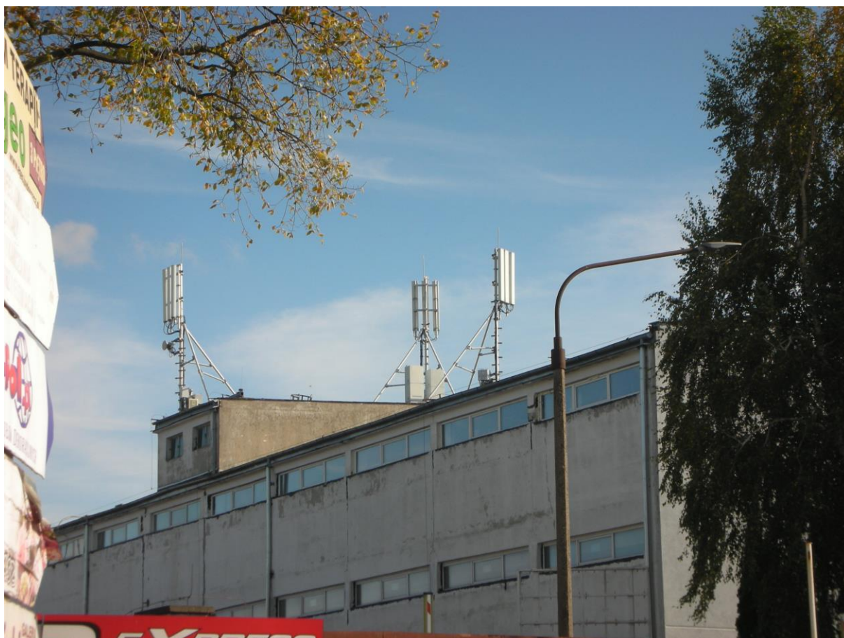
Fot. 1: Widok anten stacji bazowej: ID: BYD1041_A zlokalizowanej pod adresem: ul. Szajnochy 2, 85-738 Bydgoszcz