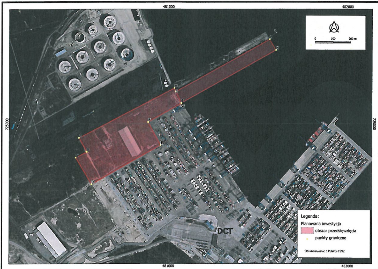
Rysunek 1 Oznaczenie wierzchołków wyznaczających przestrzenny zakres Przedsięwzięcia opisany w tabeli powyżej

(*) Dokładność oszacowania tych punktów można określić na ok. 20 m