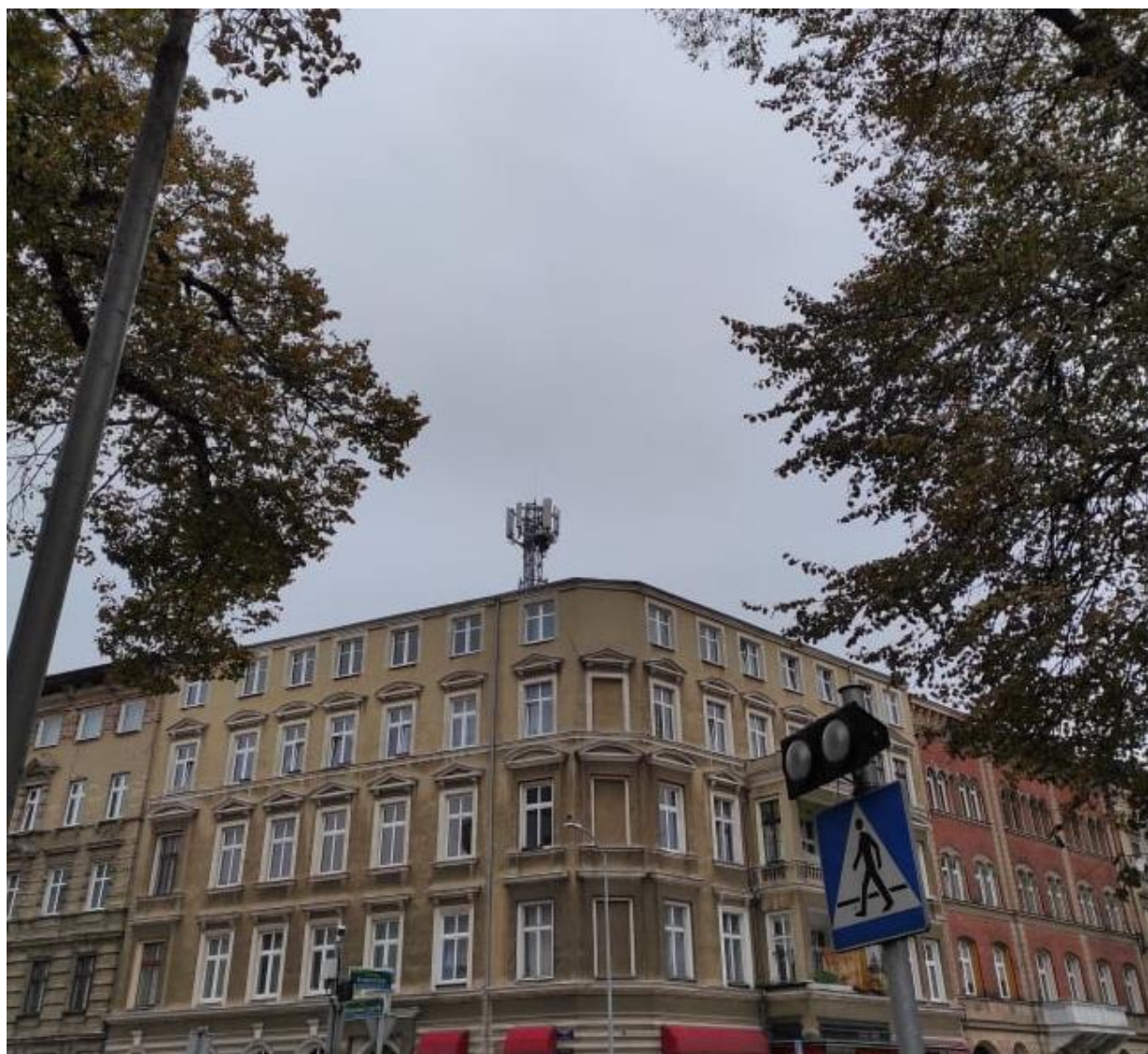
Fot. 1: Widoki anten stacji bazowej: ID: BT43629, zlokalizowanej: ul. Władysława Jagiełły 1, 71-899 Szczecin