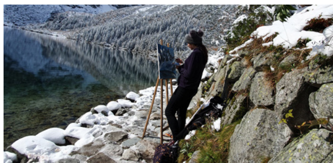
➤ plener malarcki w Morskim Oku, 2021

➤ Głównym zadaniem kształcenia w zakresie przedmiotu rysunek i malarstwo jest wyposażenie ucznia w wiedzę i umiejętności umożliwiające samodzielne i kreatywne posługiwanie się nimi w pracy twórczej. Oprócz takich zadań jak wzbogacenie warsztatu, kształcenie wrażliwości estetycznej i umiejętności posługiwania się środkami plastycznymi, najważniejsze jest, aby uczeń szkoły plastycznej w pełni wykorzystał swoje możliwości rozwoju artystycznego i warsztatowego.