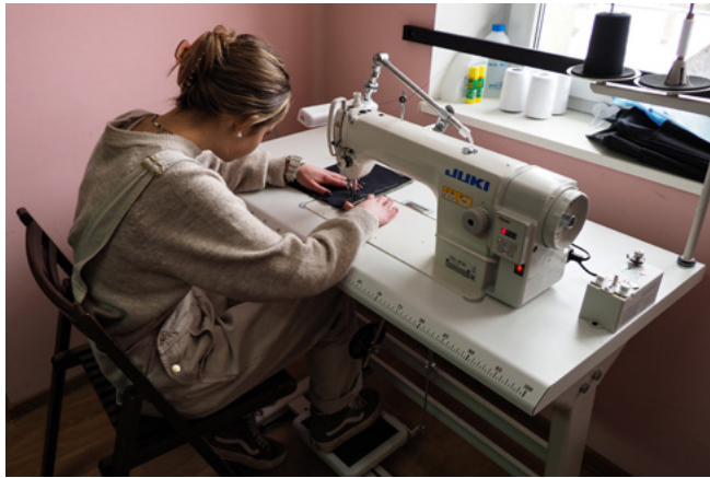
► w pracowni projektowania ubioru