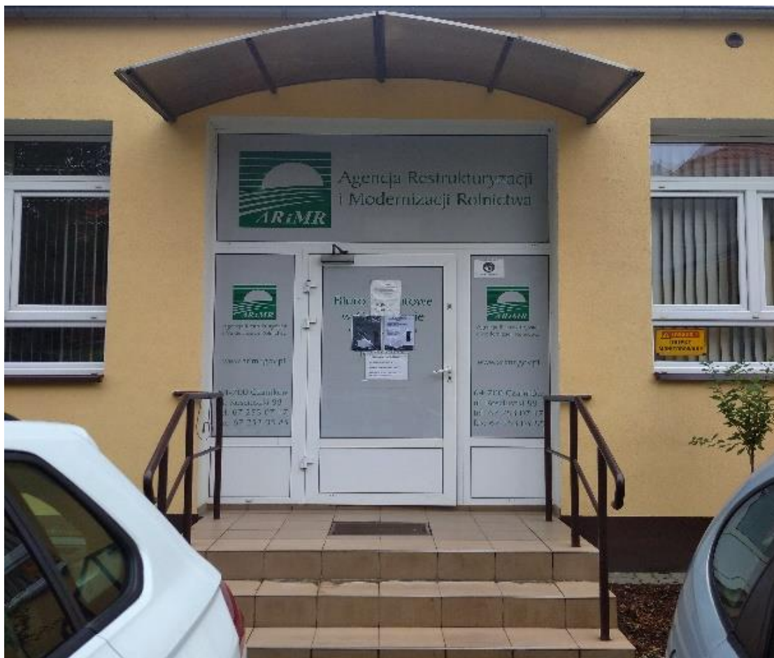
Fot.4 Główne wejście do budynku Biura Powiatowego ARiMR w Czarnkowie, ul. Kościuszki 88