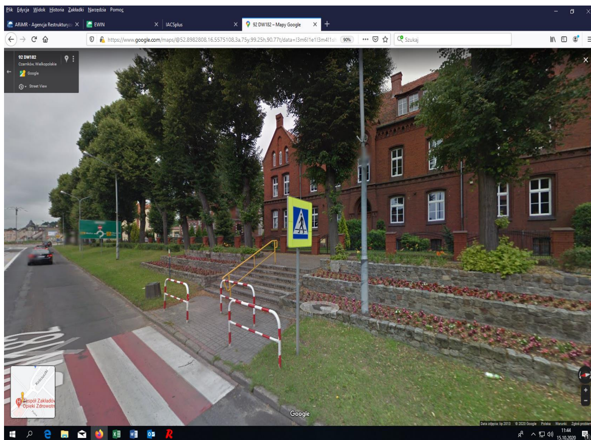
Fot. 1 Przejście dla pieszych ul. Kościuszki.

Przejście dla pieszych przy ul. Kościuszki nie posiada sygnalizacji świetlnej i dźwiękowej. Jest oznakowane znakami pionowymi i poziomymi. Przy wejściu na przejście dla pieszych nieopodal budynku znajdują się schody i poręcze. Na trasie dojść do wejść do budynku występują pojedyncze przeszkody np. kosze na śmieci, żywopłot.