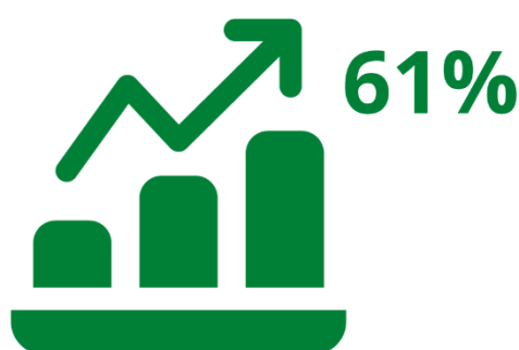
Wykres 1. Zasięg VI edycji Wojewódzkiego Projektu „Klub zdrowego przedszkolaka”

947 przedszkoli zwróciło kwestionariusze sprawozdawcze z realizacji projektu co stanowi 61% placówek przedszkolnych na terenie województwa śląskiego.