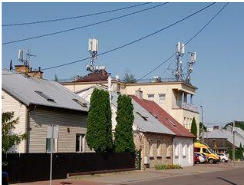
Fot. 1: Widok anten stacji bazowych ID: BIA1046A, ID: 7395 (96920N!), zlokalizowanych pod adresem: Nowowarszawska 32/2, 15-206 Białystok