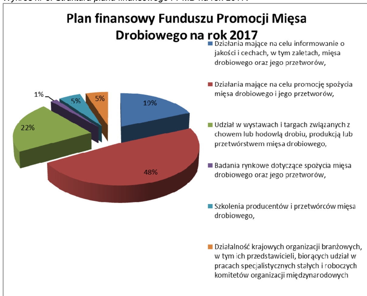
Wykres nr 3. Struktura planu finansowego FPMD na rok 2017.

W ww. planie Komisja Zarządzająca Funduszu Promocji Mięsa Drobiowego przeznaczyła środki finansowe na poszczególne cele zgodnie z „Zasadami gospodarowania Funduszem Promocji Mięsa Drobiowego”.