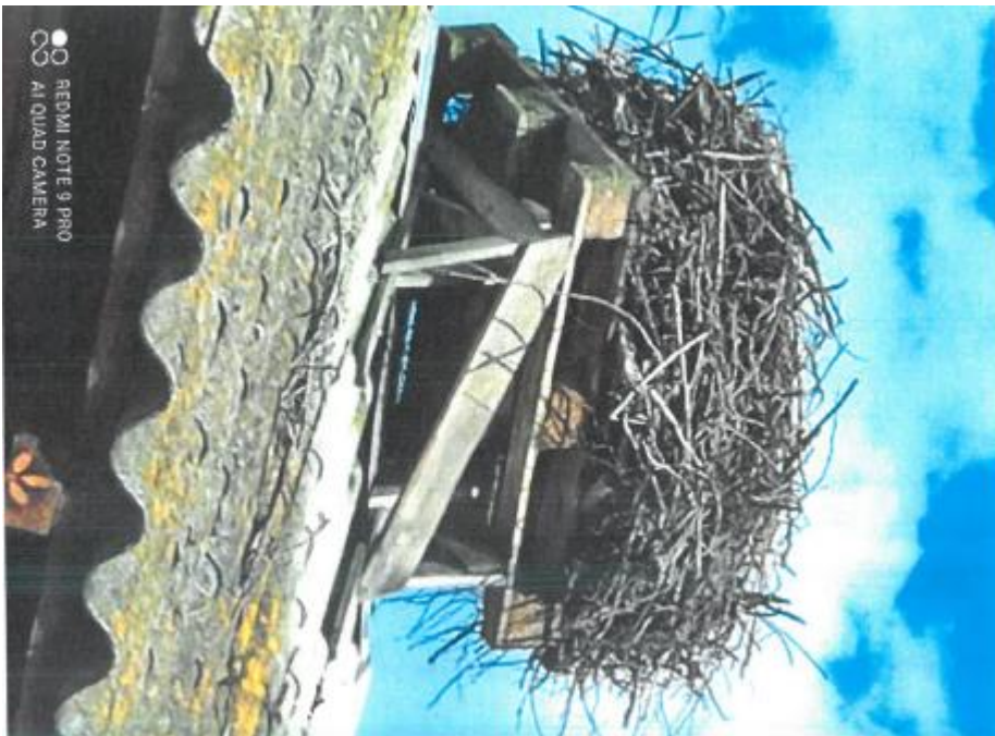
Fot. 9. gm. Brody, m. Lubienia