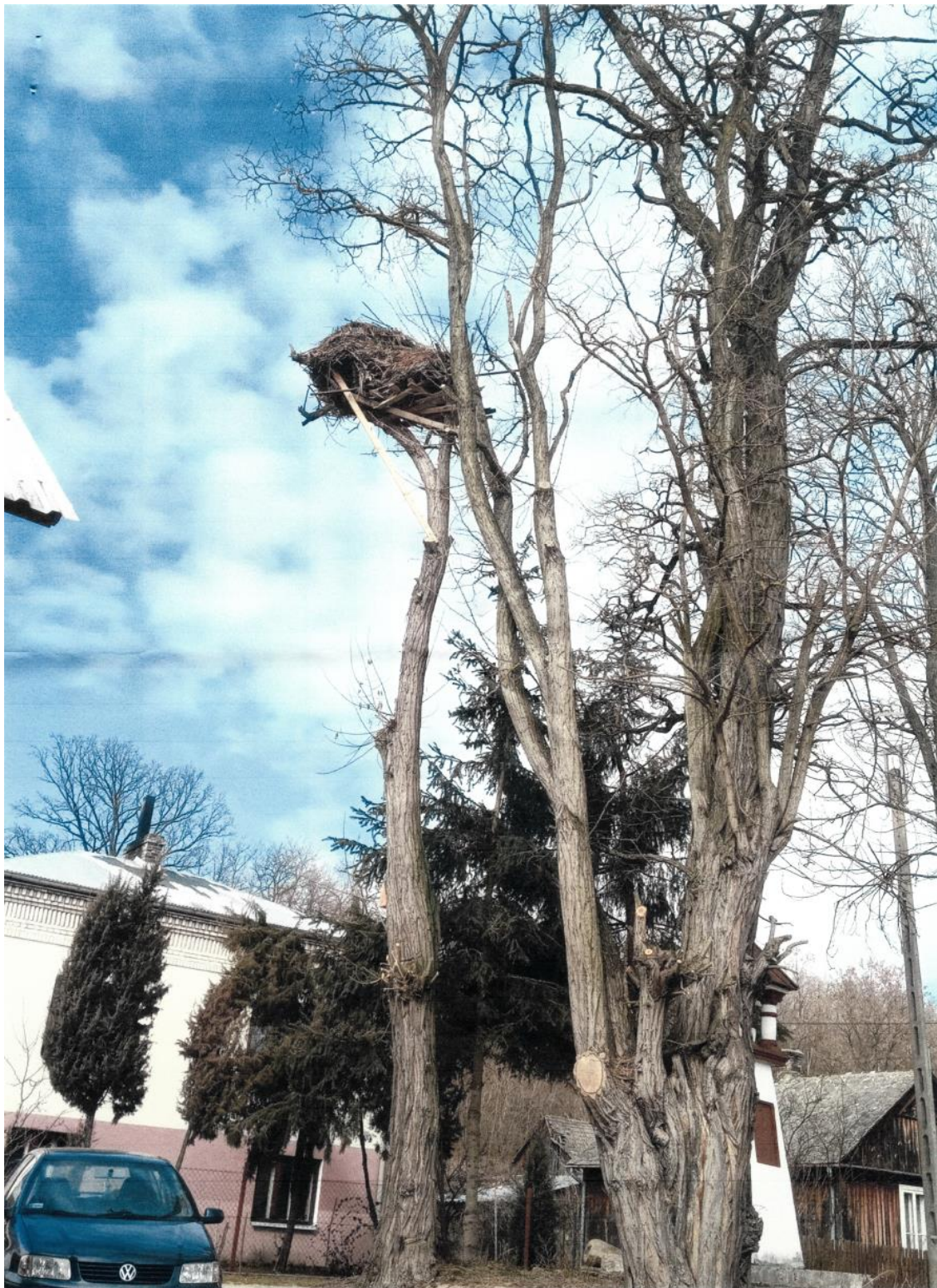
Fot. 16. gm. Baltów, m. Rudka Baltowska