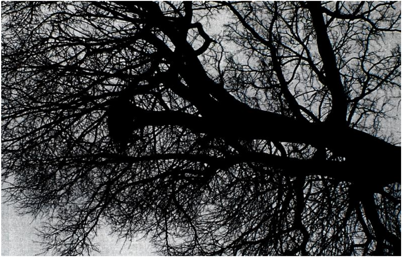
Fot. 15. gm. Baćkowice, m. Nieskurzów Nowy