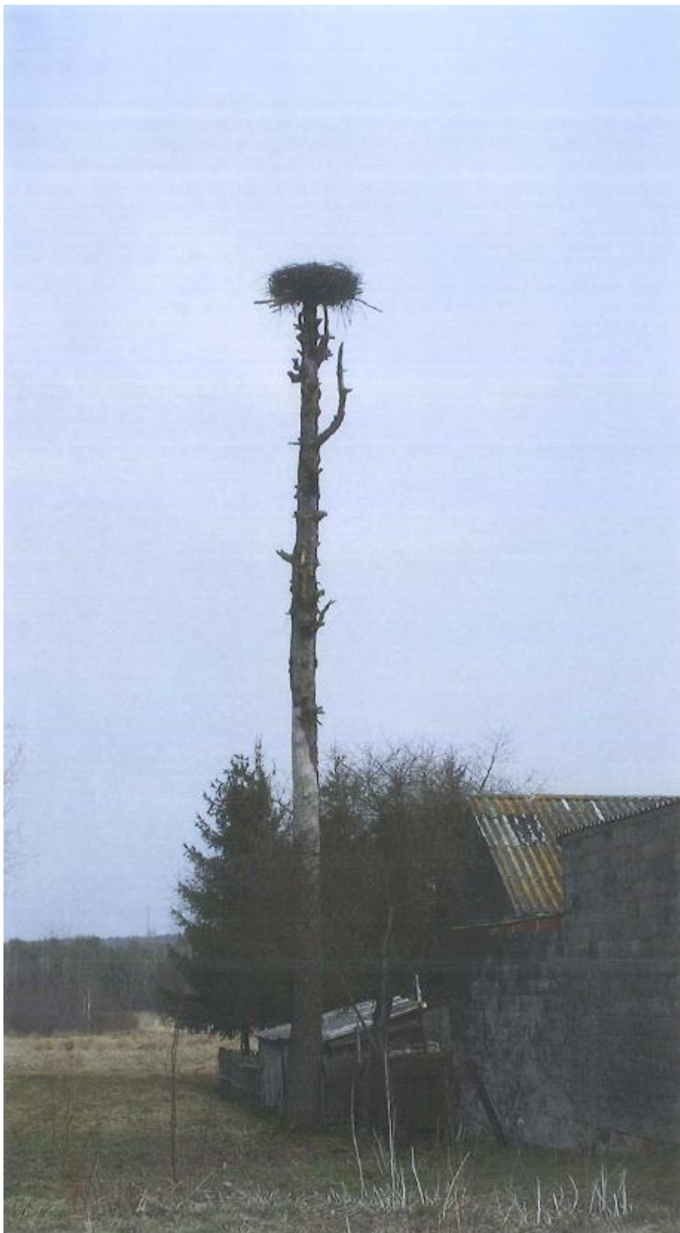
Fot. 5. gm. Stąporków, m. Świerczów