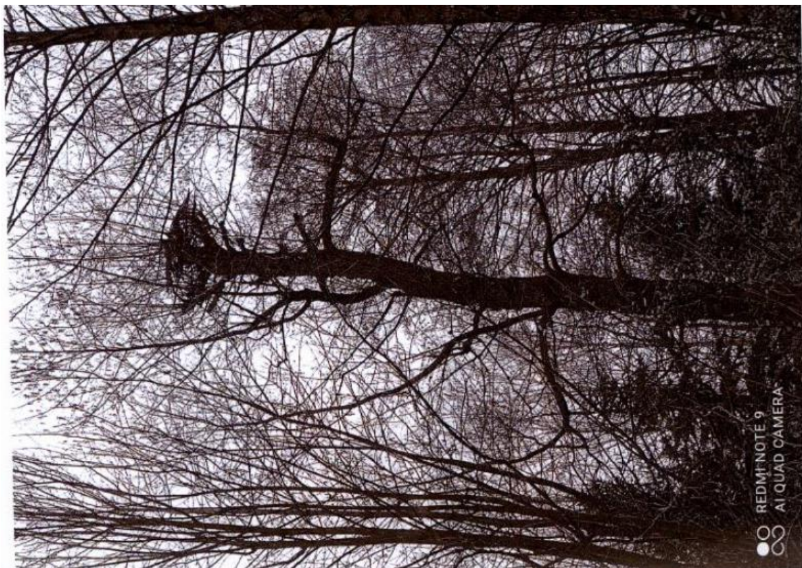
Fot. 11. gm. Miedziana Góra, m. Ciosowa