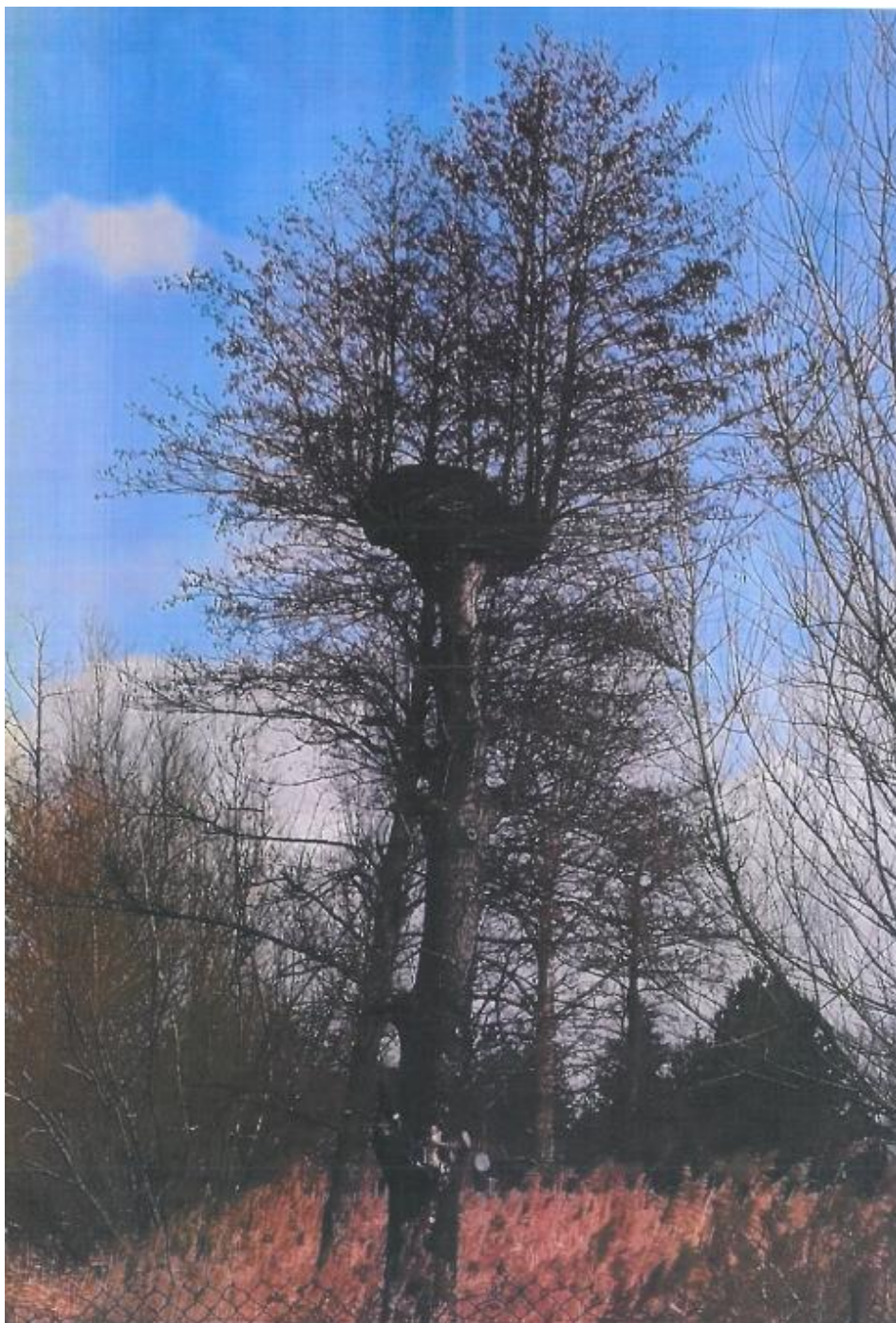
Fot. 3. gm. Michałów, m. Pawłowice