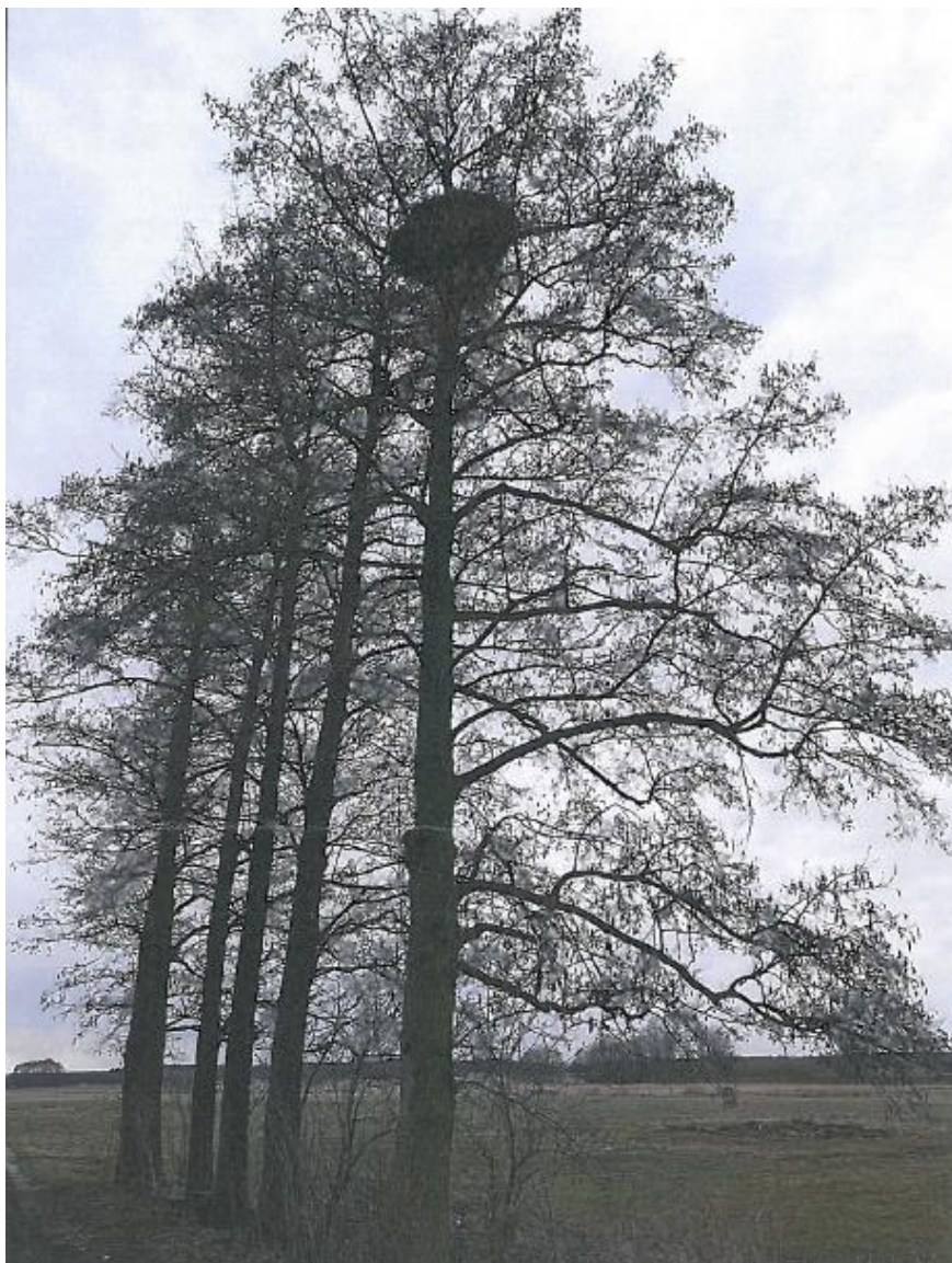
Fot. 17. gm. Małogoszcz, m. Wygnanów