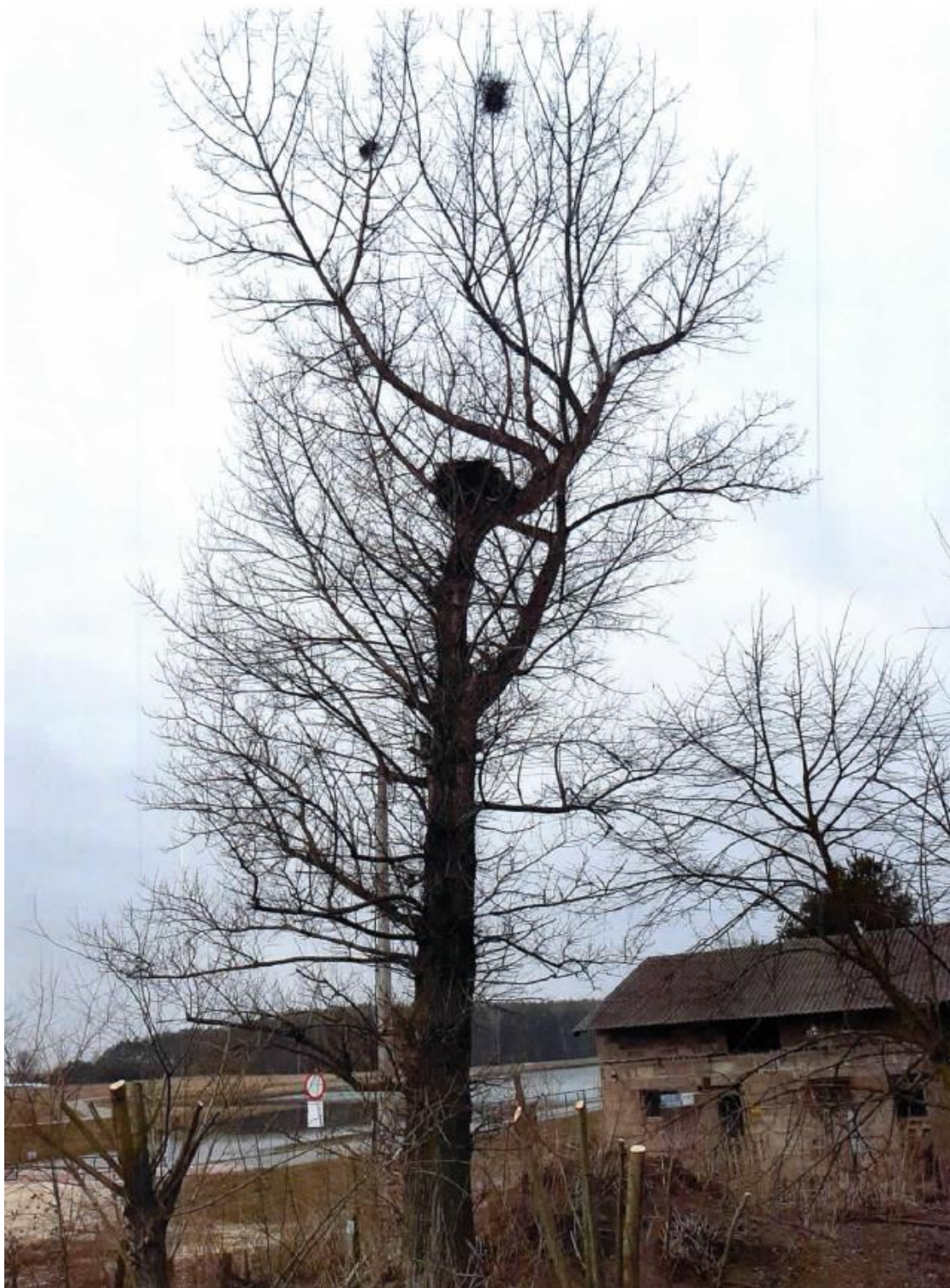
Fot. 6. gm. Radoszyce, m. Radoszyce