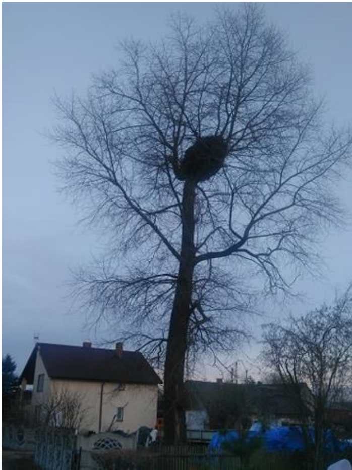
Fot. 1a. gm. Radków, m. Bieganów