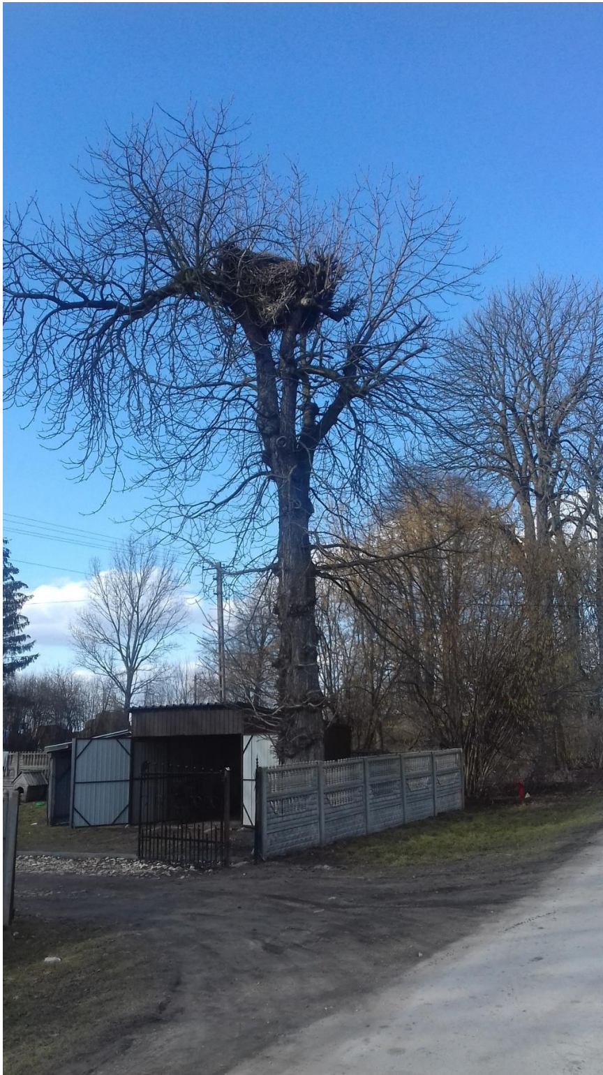
Fot. 2. gm. Secemin, m. Czaryż