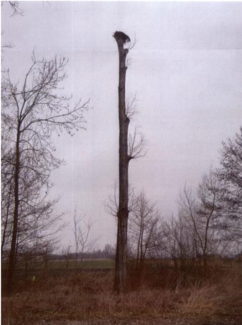
Fot. 14. gm. Busko-Zdrój, m. Skotniki Duże