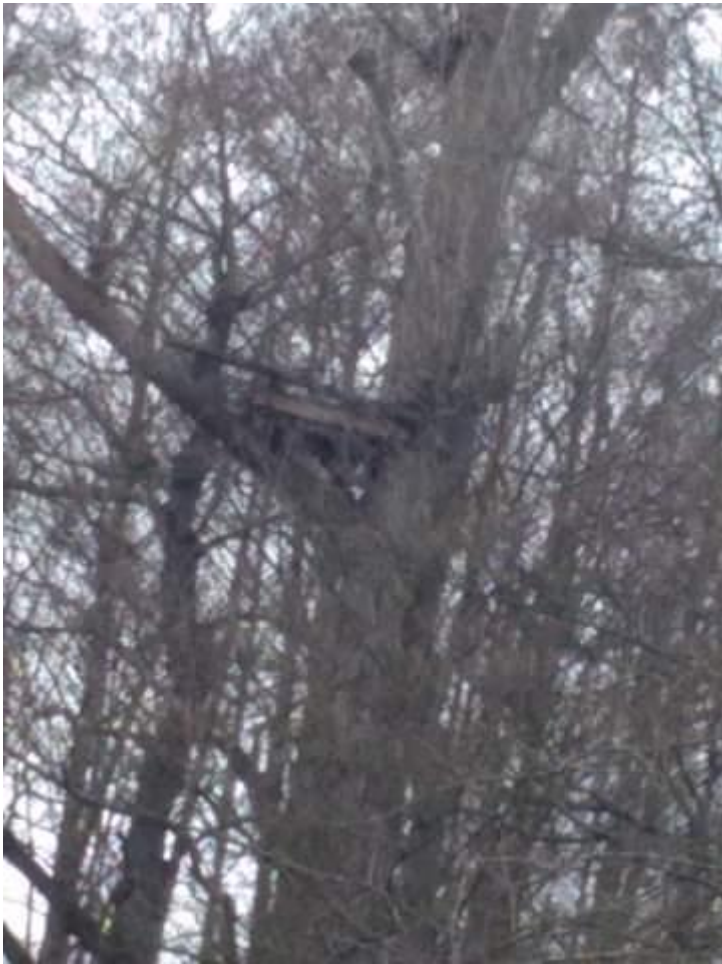
Fot. 18. gm. Sobków, m. Bizoređa