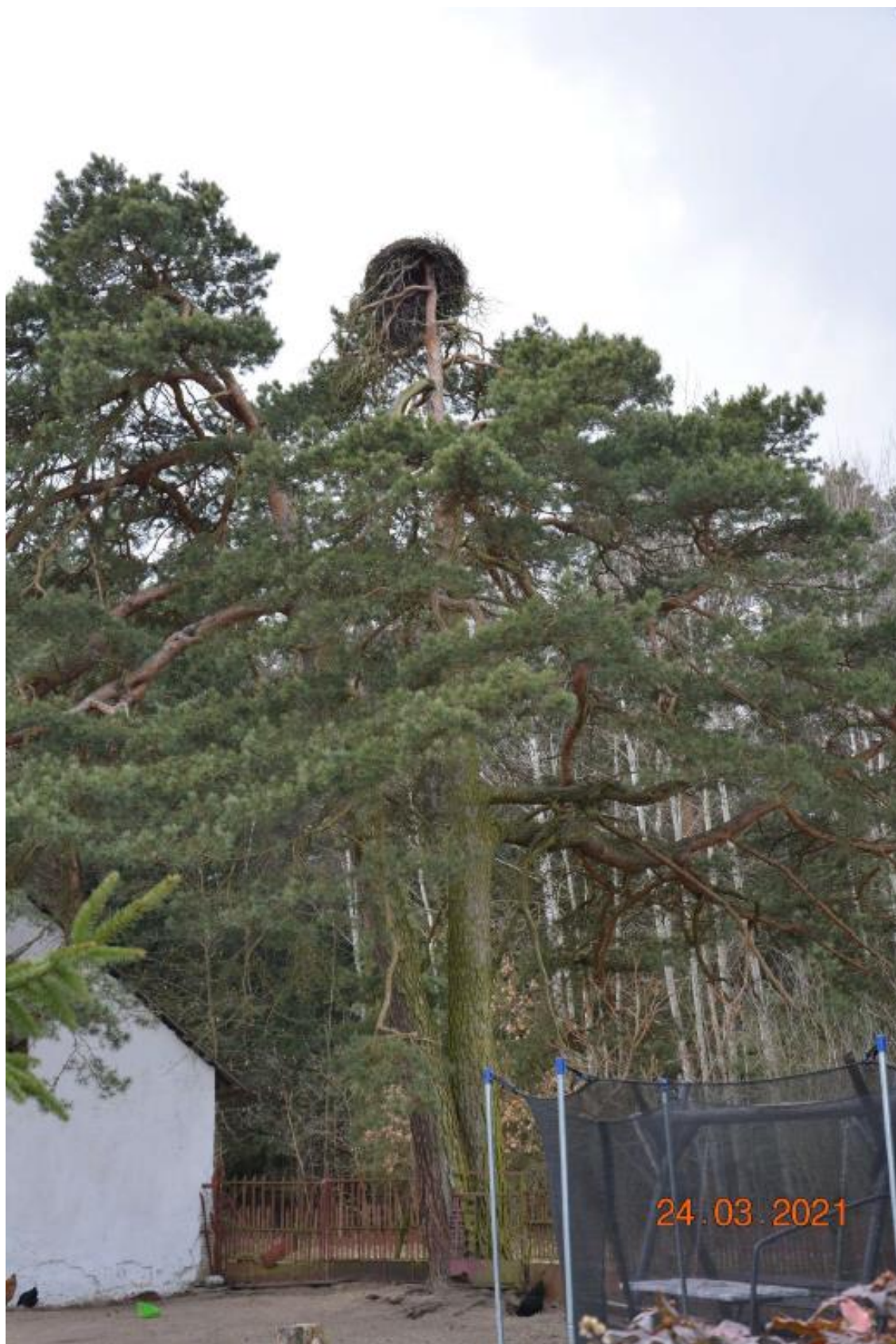
Fot. 4. gm. Falków, m. Skórnice