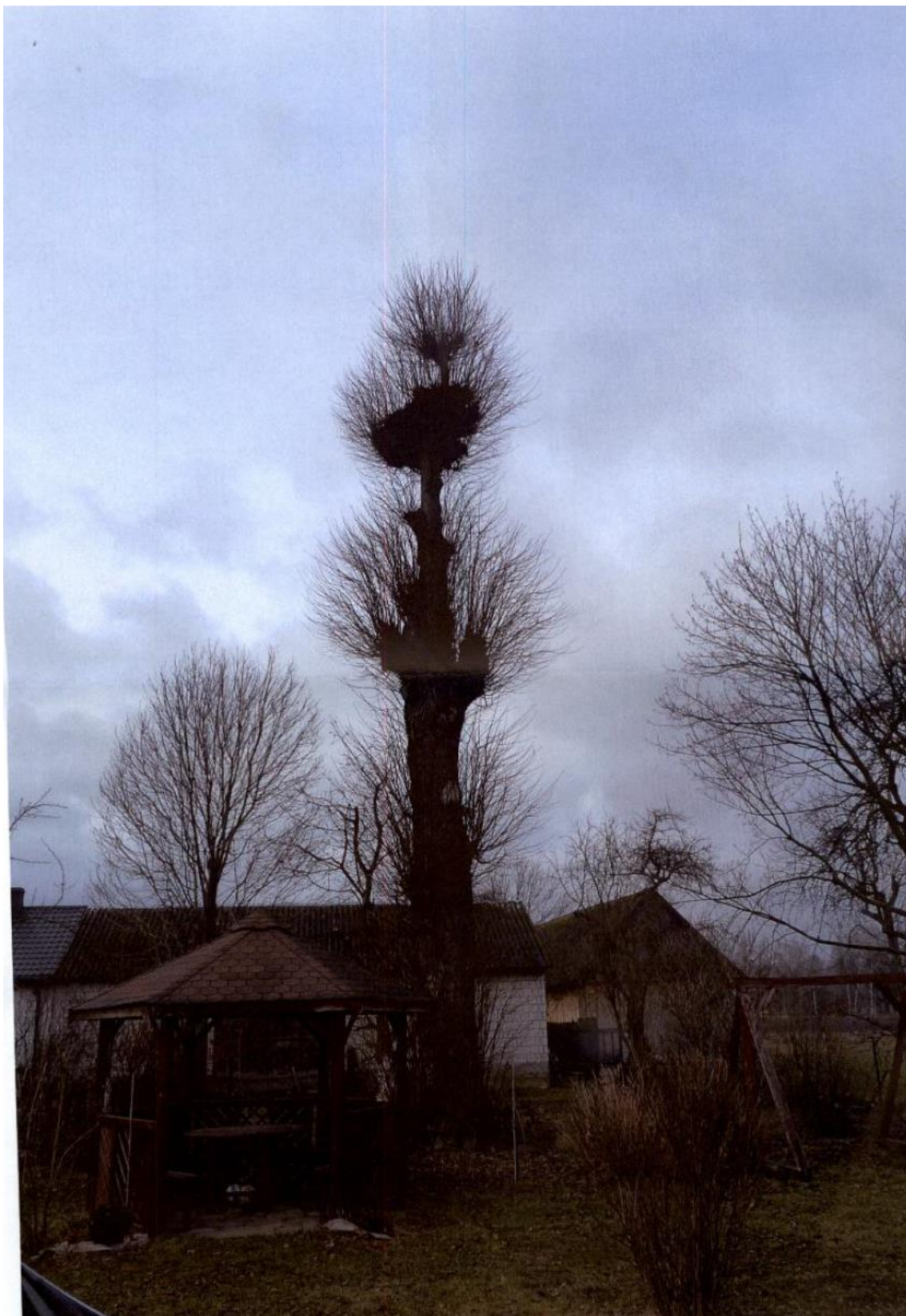
Fot. 7. gm. Pawłów, m. Tarczek