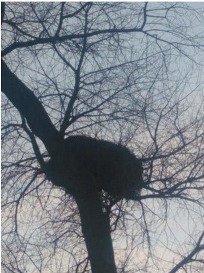
Fot. 1. gm. Radków, m. Bieganów