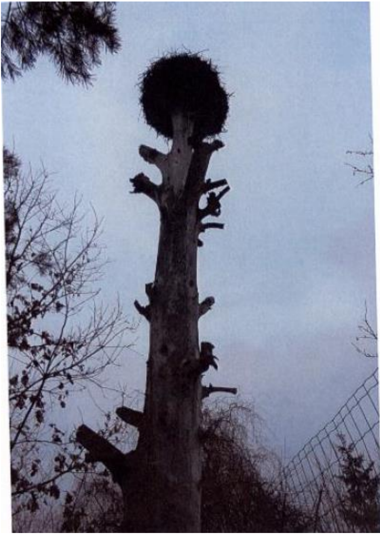
Fot. 10. gm. Chęciny, m. Siedlce