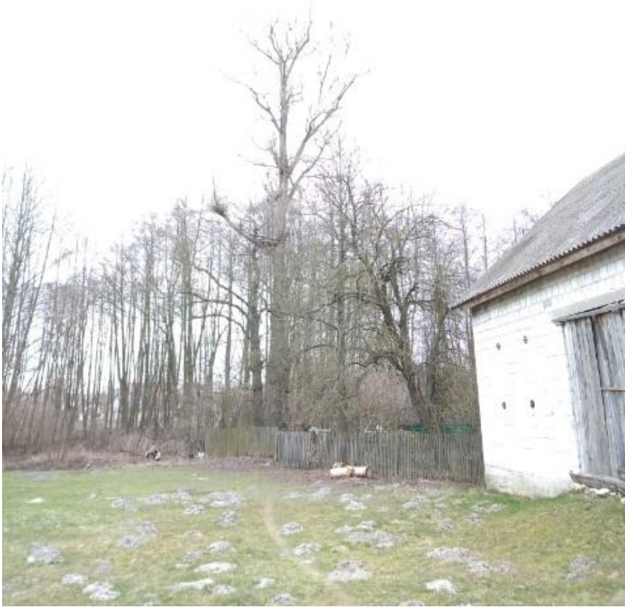
Fot. 18a. gm. Sobków, m. Bizoređa