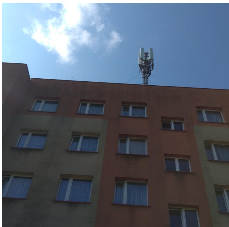
Fot. 1: Widok anten stacji bazowych: ID: KAT0049_B, ID: 1779 (32412N!), zlokalizowanych pod adresem: ul. Grodowa 30, 40-407 Katowice