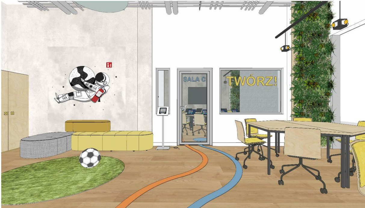
Pracownia PAKT – miejsce pracy warsztatowej

konfiguracji. W każdym pomieszczeniu znajdują się elementy zieleni, w postaci wiszących roślin lub ścianek wertykalnych z roślinnością. We wszystkich z pomieszczeń możemy znaleźć charakterystyczne standy z tabletami, z których może korzystać każdy – znajdziemy tam mapy przestrzeni, kalendarz warsztatów, opisy dostępnych pracowni oraz dostęp do Internetu.