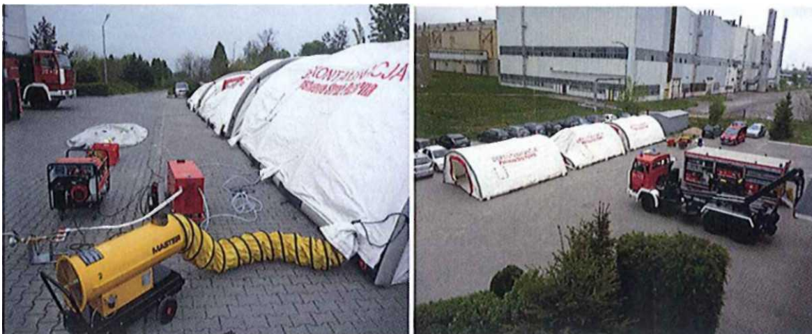
Fot. 1. Przykładowy ciąg dekontaminacyjny.

Przekazanie dekontaminowanych personelowi placówki medycznej.