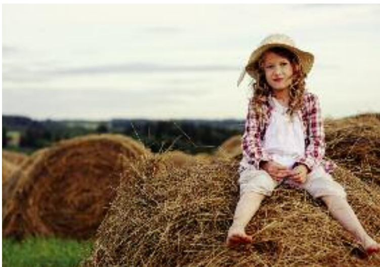
... a w okresie wakacji prawie 1,2 tys. dzieci rolników

Minister Rolnictwa i Rozwoju Wsi sprawował honorowy patronat nad Ogólnopolskim konkursem plastycz-