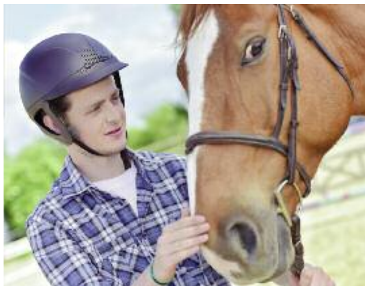
Do klasyfikacji zawodów szkolnictwa zawodowego wprowadzono nowe zawody, m.in. jeźdźca

Planuje się kontynuację ww. działań w 2017 r., z instytucjami wskazanymi przez Ministra Rolnictwa.