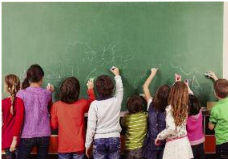
Minister Rolnictwa podjął działania mające na celu ochronę i utrzymanie małych szkół wiejskich

Podjęto działania mające na celu ochronę i utrzymanie małych szkół wiejskich. W tym celu Minister Rolnictwa zwrócił się z prośbą do Minister Edukacji Narodowej o uwzględnienie specyfiki szkół na terenach wiejskich o planowanych pracach dot. zmian przepisów prawa