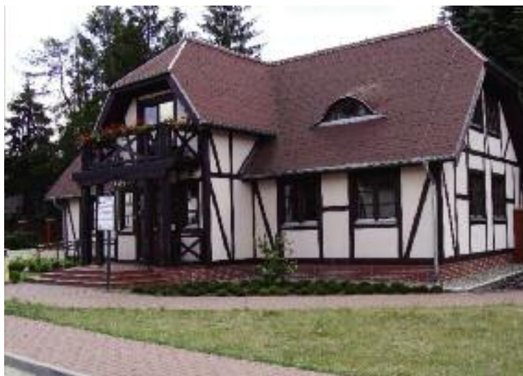
Muzeum Narodowe Rolnictwa i Przemysłu Rolno-Spożywczego w Szreniawie otrzymało w ubiegłym roku ponad 1,5 mln zł dotacji

Wystąpiono do Krajowej Rady Izb Rolniczych oraz wojewódzkich izb rolniczych w zakresie organizacji praktyk zawodowych oraz ułatwiania szkołom rolniczym współpracy z gospodarstwami rolnymi, jak również zwrócono się do wojewódzkich urzędów pracy z prośbą o przygotowanie informacji w zakresie zapotrzebowania na zawody sektora rolno-spożywczego w poszczególnych regionach dla celów wykorzystania ich do tworzonych przez szkoły ofert edukacyjnych. Wystą-