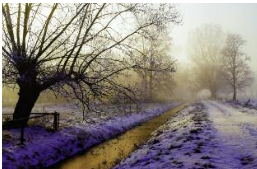
W ramach prac nad „Strategią na rzecz Odpowiedzialnego Rozwoju” MRiRW zgłosiło do realizacji zadanie „Woda dla rolnictwa”

W projekcie programu wieloletniego planowana jest realizacja zadania Utworzenie i prowadzenie bazy obiektów małej retencji oraz prowadzenie Centralnej Bazy Danych Melioracyjnych , którego celem jest integracja danych przestrzennych w zakresie ewidencji wód, urządzeń melioracji wodnych oraz zmeliorowanych gruntów w skali kraju, poprawa wiedzy beneficjentów o stanie obiektów małej retencji i ich znaczeniu w krajobrazie rolniczym, a także wiedzy o mechanizmach i tempie utraty pojemności małych zbiorników