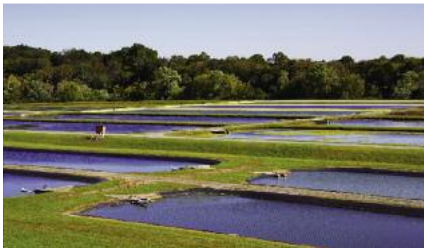
O pomoc mogą także ubiegać się rolnicy, którzy ponieśli straty w zwierzętach gospodarskich i rybach

Na podstawie przyznanej liczby punktów sporządzone zostaną dwie listy określające kolejność przysługiwania pomocy – jedna dla rolników z woj. mazowieckiego i druga