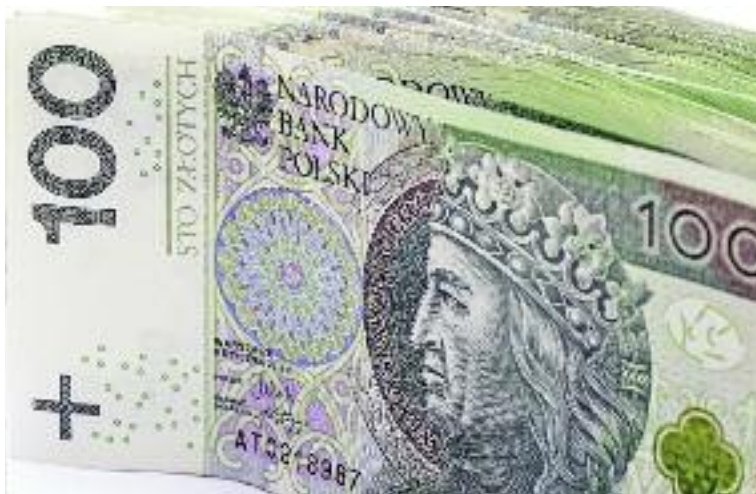
W projekcie ustawy budżetowej na rok 2017 zaplanowano wydatki budżetowe na rolnictwo, rozwój wsi i rynki rolne w wysokości 4.754.873 tys. zł

Rezerwy celowe zaplanowano dla rolnictwa w następujących wysokościach: