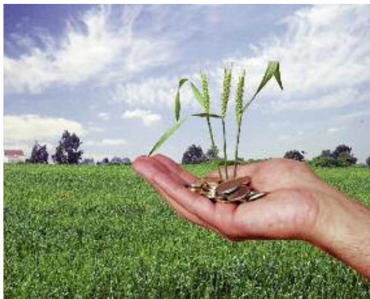
Przygotowany przez MRiRW projekt ustawy o zmianie ustawy o ubezpieczeniach upraw rolnych i zwierząt gospodarskich jest obecnie przedmiotem prac sejmowych

W celu realizacji powyższego przygotowano projekt ustawy o zmianie ustawy o ubezpieczeniach upraw rolnych i zwierząt gospodarskich. Projekt został przyjęty przez Radę Ministrów i jest przedmiotem prac w Sejmie RP.