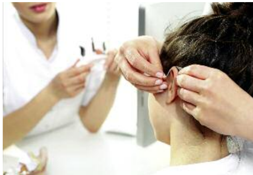
Fundusz Składkowy Ubezpieczenia Społecznego Rolników dofinansował m.in. badania przesiewowe słuchu u dzieci...