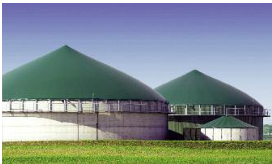
Z myślą o dalszym rozwoju biogazowni rolniczych, zmodyfikowany został system wsparcia w postaci świadectw pochodzenia oraz system aukcyjny

W ramach wsparcia Modernizacja gospodarstw rolnych element operacji może stanowić uzasadnione ekonomicznie wykorzystanie odnawialnych źródeł energii na potrzeby prowadzonej produkcji rolnej. W operacji możliwe jest uwzględnienie inwestycji związanej z odnawialnymi źródłami energii. Cała operacja, której elementem może być inwestycja w OZE, ma przyczynić się do wzrostu wartości dodanej w gospodarstwie co najmniej o 10% w okresie 5 lat od przyznania pomocy.