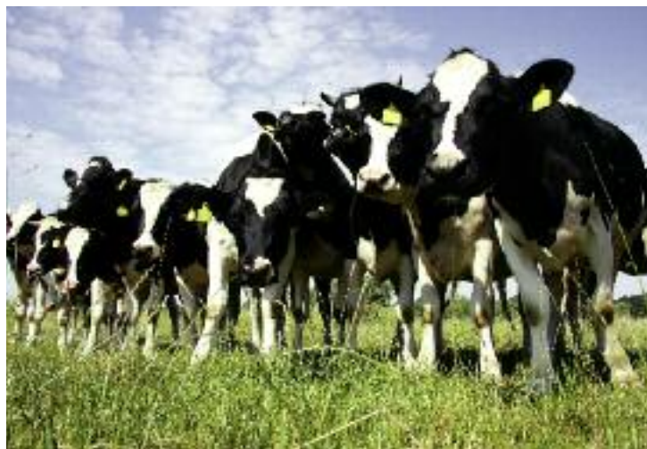
Utworzenie funduszy ochrony przychodów rolniczych zagwarantuje producentom rolnym otrzymanie częściowej rekompensaty z tytułu utraty przychodów z prowadzonej działalności rolniczej

W projekcie ustawy budżetowej na rok 2017 zostały zaplanowane wydatki budżetowe łącznie z wydatkami na współfinansowanie projektów z udziałem środków Unii Europejskiej, w kwocie 4.754.873 tys. zł. Ponadto zaplanowano wydatki dla Kasy Rolniczego Ubezpieczenia Społecznego w kwocie 17.924.828 tys. zł.