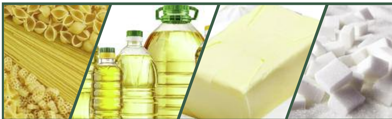
W ramach PO PŻ potrzebujący otrzymują artykuły spożywcze z różnych grup towarowych: artykuły skrobiowe, mleczne, warzywne i owocowe, mięsne, a także cukier i olej

W zakresie realizacji Programu na 2016 rok ARR przeprowadziła postępowanie o udzielenie zamówienia publicznego na dostawy artykułów spożywczych do magazynów organizacji partnerskich, które są realizowane od sierpnia 2016 r. do kwietnia 2017 r. Łączna ilość artykułów przewidzianych do dostarczenia w ramach Programu na 2016 rok wyniesie około 65,2 tys. ton o wartości ok. 293,5 mln zł.