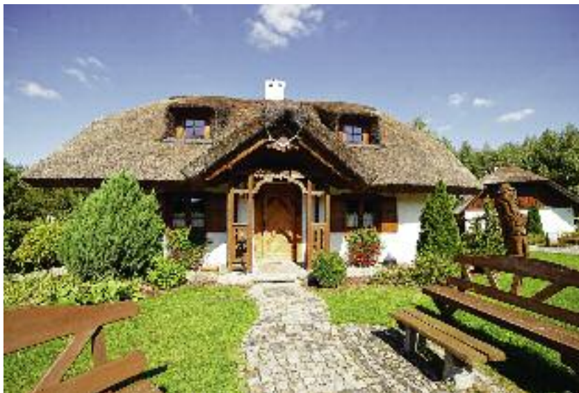
Trwają prace nad zmianami w przepisach prawa, regulujących kwestie prowadzenia na obszarach wiejskich działalności turystycznej

warzyszyły liczne wydarzenia: konferencje, seminaria, warsztaty, wizyty studyjne oraz konkursy dla wystawców i zwiedzających;