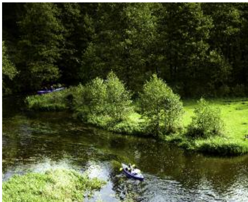
W ramach poddziałania „Wsparcie inwestycji w przetwarzanie produktów rolnych, obrót nimi lub ich rozwój” udzielana jest pomoc na rozwój funkcji turystycznych obszarów wiejskich