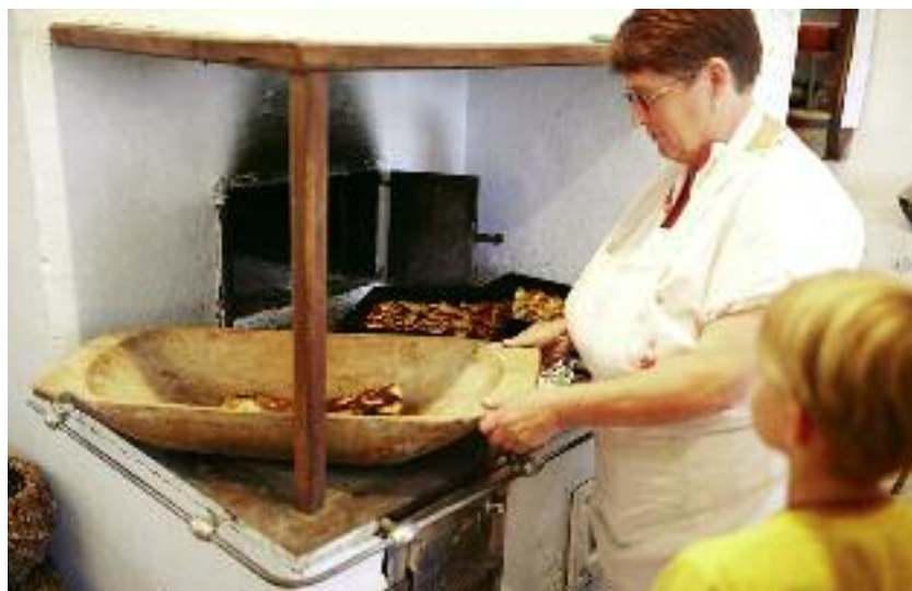
MRiRW wspiera przedsięwzięcia, przyczyniające się do rozwoju obszarów wiejskich, w szczególności z zakresu przetwórstwa w gospodarstwach prowadzących usługi agroturystyczne

MRiRW uczestniczy we wspieraniu i inicjowaniu przedsięwzięć, które przyczyniają się do wielofunkcyjnego rozwoju obszarów wiejskich, w szczególności z zakresu przetwórstwa w gospodarstwach rolnych prowadzących usługi agroturystyczne oraz pozostających w synergii