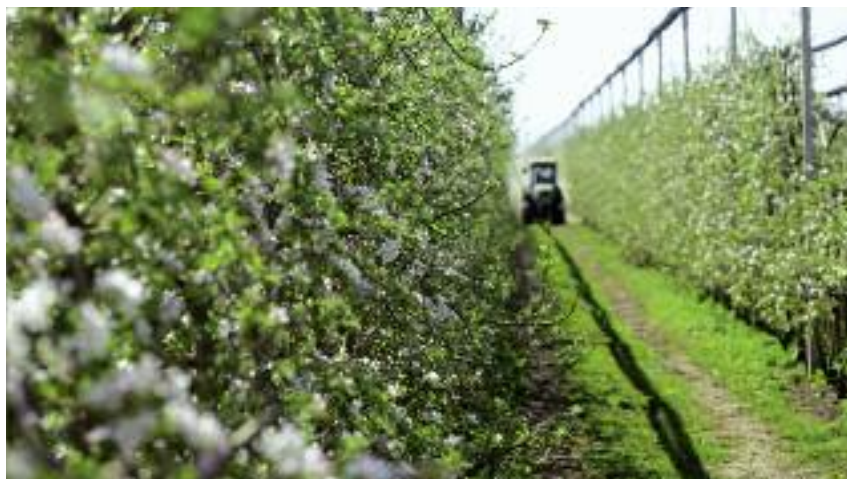
Agencja uruchomiła wsparcie na operacje typu „Inwestycje odtwarzające potencjał produkcji rolnej”. Pomoc z działania może być przyznana m.in. na odtworzenie plantacji wieloletnich czy sadów zniszczonych w wyniku klęsk żywiołowych

ły one miejsce w roku, w którym jest składany wniosek o przyznanie pomocy lub w roku poprzedzającym rok, w którym składany jest wniosek. Dlatego bardzo istotne było,