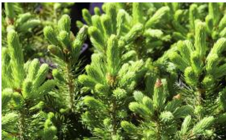
W działaniu „Inwestycje w rozwój obszarów leśnych...” usunięto wymóg posiadania przez beneficjenta działania zalesieniowego świadectwa pochodzenia leśnego materiału rozmnożeniowego

posiadających wymaganych dotychczas dokumentów planistycznych.