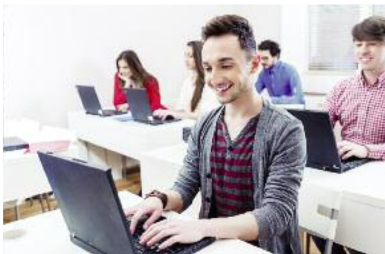
System kształcenia na odległość stanowi integralną część kształcenia w systemie szkolnym na poziomie wyższym oraz w systemie pozaszkolnym

Dokonano analizy przepisów Ministra Edukacji Narodowej oraz Ministra Nauki i Szkolnictwa Wyższego, dotyczących kształcenia na odległość i stwierdzono, że pozwalają one nie tylko na wprowadzenie takiej formy, ale także szczegółowo określają warunki techniczne i zasady organizacji zajęć, stanowiących integralną część kształcenia w systemie szkolnym na poziomie wyższym oraz w systemie pozaszkolnym. Realizacja tego działania uzależniona jest od spełnienia wymogów technicznych, których przygotowanie zależy od wdrożenia zadań takich, jak: „Wspieranie rozwoju infrastruktury technicznej, w tym teleinformatycznej oraz pomoc logistyczna i organizacyjna dla lokalnych i regionalnych przedsiębiorstw” oraz „Rozwój i modernizacja infrastruktury placówek oświaty na terenach wiejskich, ze szczególnym uwzględnieniem dostępności pracowni komputerowych i Internetu”. W związku z tym, opracowano „Informację dotyczącą możliwości i potrzeb Krajowego Centrum Edukacji Rol-