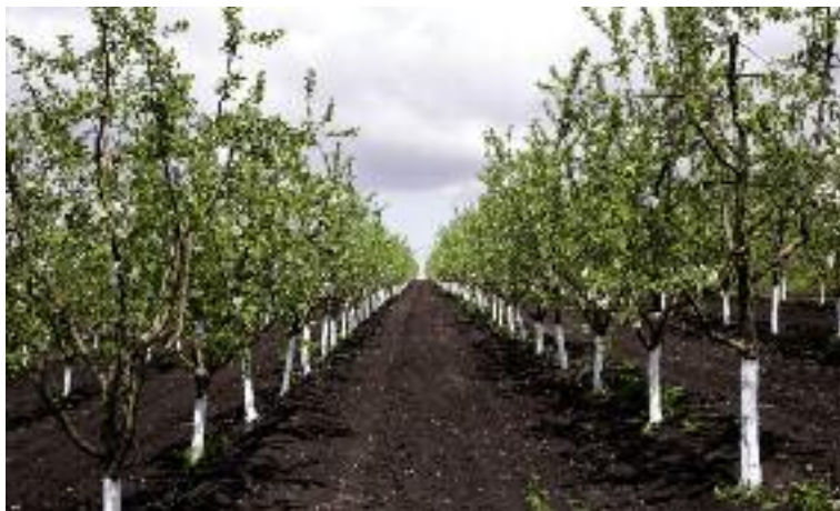
W ramach ułatwień dla rolników w realizacji działania „Rolnictwo ekologiczne” PROW 2014-2020 umożliwiono m.in. otrzymywanie płatności ekologicznej do sadów mieszanych

• rozszerzenia możliwości otrzymywania płatności ekologicznej w przypadku stosowania praktyk sprzyjających wzbogacaniu gleby w materię organiczną (nawóz zielony).