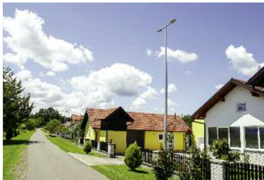
W ramach poddziałania „Budowa lub modernizacja dróg lokalnych” finansowanego z PROW 2014-2020 przeprowadzono nabory we wszystkich województwach i zawarto 1837 umów o przyznanie pomocy

W ramach prac nad Strategią na rzecz Odpowiedzialnego Rozwoju , MRiRW zgłosiło do realizacji zadanie Woda dla rolnictwa . Jego celem jest poprawa