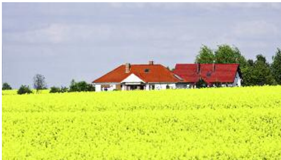
Minister Rolnictwa zgłosił propozycje zmian do projektu ustawy o biokomponentach i paliwach ciekłych, które m.in. mają na celu umożliwienie wykorzystania biokomponentów wytwarzanych ze zbóż i rzepaku na poziomie minimum 6%, tj. odpowiadającym obecnemu wykorzystaniu tych surowców