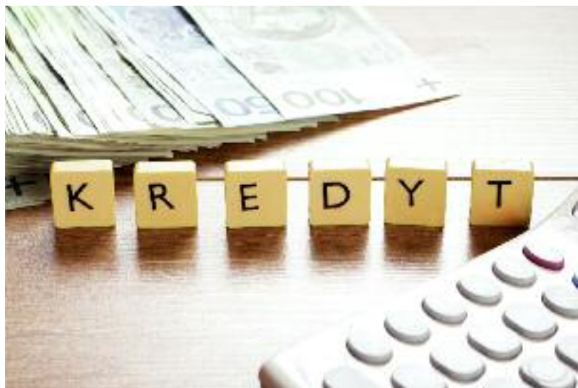
Przygotowane zostały przepisy umożliwiające podwyższenie oprocentowania kredytów udzielanych z dopłatami do oprocentowania ze środków ARiMR do dnia 13 lutego 2015 r.

nie obowiązującymi przepisami, oprocentowanie ww. kredytów dla banków wynosi 1,5 lub 1,6 stopy redyskonta weksli tj. 2,625% lub 2,8% w skali roku, co oznacza, że banki z tytułu udzielenia tych kredytów