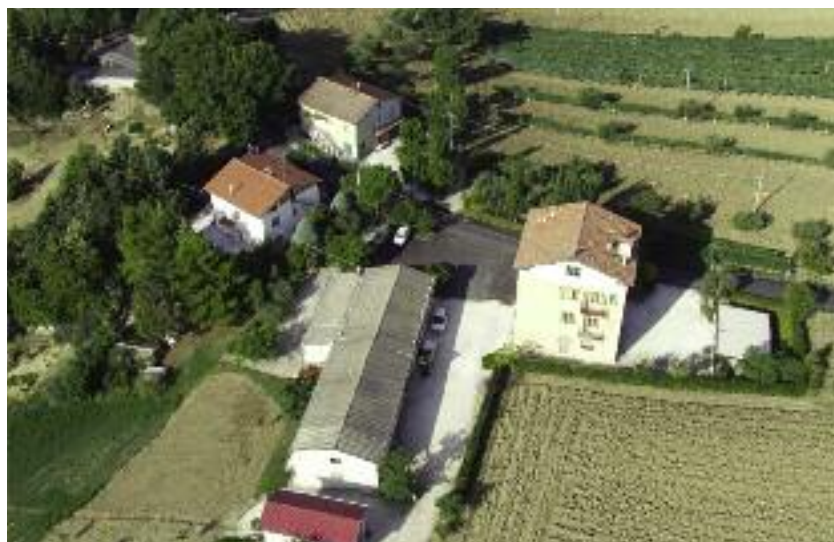
Potrzeba wsparcia mieszkańców obszarów popegeerowskich znajduje szczególne miejsce w „Pakcie dla obszarów wiejskich”

• opracowanie i realizacja programu wsparcia działań rewitalizacyjnych spółdzielni mieszkaniowych po likwidacji PGR;