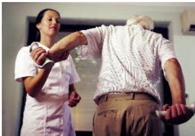
W 2015 r. KRUS skierowała na rehabilitację leczniczą blisko 13,5 tys. rolników...

13 404 rolników i 1179 dzieci rolników. W trzech pierwszych kwartałach 2016 roku z rehabilitacji skorzystało 9871 rolników, a w okresie wakacji 1177 dzieci rolników;