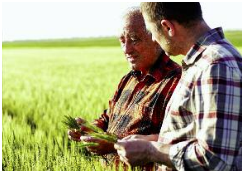
Większość obowiązków nałożonych na beneficjentów PROW 2014-2020 wynika z prawa UE

Wsparcie w zakresie rozwoju sfery instytucjonalnej rynku rolno-spożywczego jest realizowane w ramach dwóch instrumentów PROW 2014-2020. Tworzenie grup i organizacji producentów oraz Wsparcie inwestycji w przetwarzanie produktów rolnych, obrót nimi lub ich rozwój. Szczegóły zasad udzielania tego wsparcia znajdują się w odpowiednich dla tych operacji rozporządzeniach. Warto wspomnieć, że w sierpniu 2016 r. opublikowano nowelizację rozporządzenia dla poddziałania Wsparcie inwestycji w przetwarzanie produktów rolnych, obrót nimi lub ich rozwój , polegającą m.in. na uwzględnieniu w ramach kryteriów wyboru operacji, podmiotów zajmujących się sprzedażą hurtową oraz na wydłużeniu okresu trwania oceny wniosków przez Agencję Restrukturyzacji i Modernizacji Rolnictwa dla wniosków złożonych w grudniu 2015 r. (do 10 miesięcy).