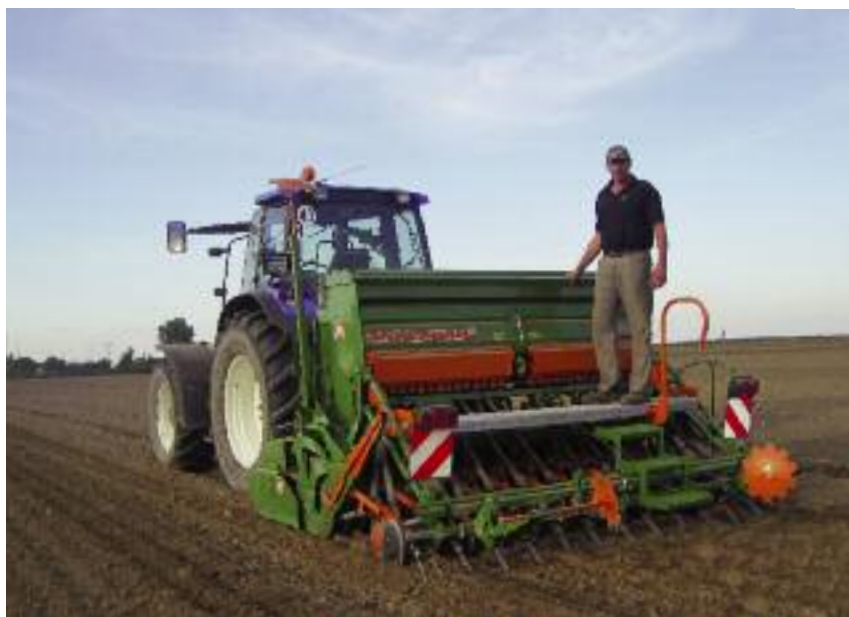
Pomoc z działania „Inwestycje odtworzące potencjał produkcji rolnej” może być przyznana na inwestycję zapewniającą odtworzenie składnika gospodarstwa, który uległ zniszczeniu lub uszkodzeniu

Spółki z o. o. będąc osobami prawnymi są podmiotami, które mogą ubiegać się o pomoc w ramach poddziałania 19.2 (zgodnie z § 3 ust. 1 pkt 2 rozporządzenia Ministra Rolnictwa i Rozwoju Wsi z dnia 24 września 2015 r. w sprawie szczegółowych warunków i trybu przyznawania pomocy finansowej w ramach poddziałania „Wsparcie na wdrażanie operacji w ramach strategii rozwoju lokalnego kierowanego przez społeczność” objętego Programem Rozwoju Obszarów Wiejskich na lata 2014-2020 (Dz. U. poz. 1570), zwanego dalej „rozporządzeniem LSR”), w tym także w ramach rozwijania działalności gospodarczej, o której mowa w § 2 ust. 1 pkt 2 lit. c rozporządzenia LSR. Należy jednak pamiętać, że podmiot taki musi spełniać warunki określone w § 7 rozporządzenia LSR, w tym warunek dotyczący wykonywania działalności gospodarczej (§ 7 ust. 1 pkt 1).