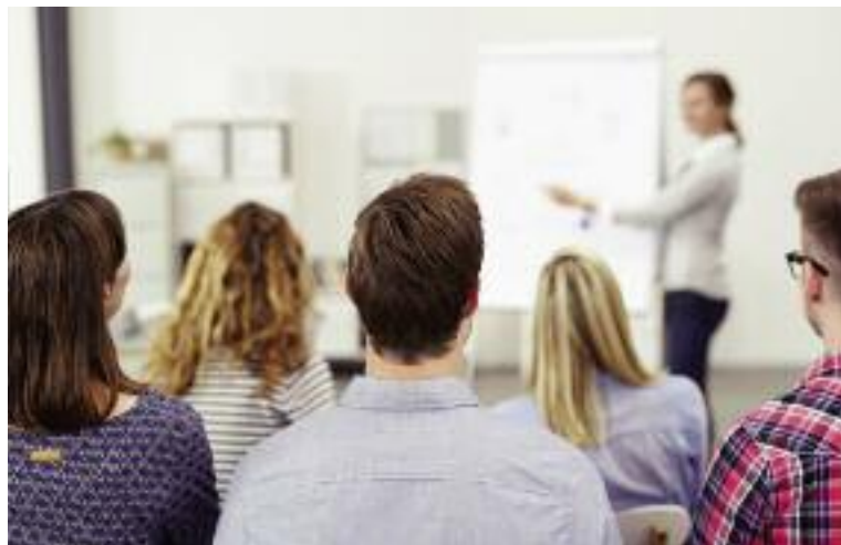
Szkolenia dla osób zamierzających zostać doradcami prowadzone są przez CDR

W sierpniu 2016 r. została przyjęta ustawa o zmianie ustawy o jednostkach doradztwa rolniczego, na mocy której nastąpiło przeniesienie podległości i nadzoru nad wojewódzkimi ośrodkami doradztwa rolniczego do ministra właściwego do spraw rozwoju wsi. W konsekwencji tej zmiany wojewódzkie ODR przede wszystkim zmieniły charakter z samorządowych wojewódzkich