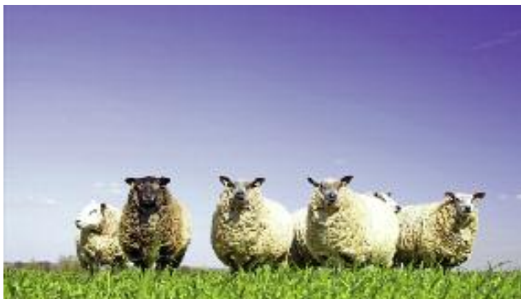
Beneficjentom „Działania rolno-środowiskowo-klimatycznego” umożliwiono podjęcie nowego zobowiązania w ramach nowej rasy tego samego gatunku zwierząt

Odnosnie Działania rolno-środowiskowo-klimatycznego objętego PROW 2014-2020 mając na względzie dotychczasowe doświadczenia, a także postulaty zgłaszane przez branżowe związki rolników, MRiRW zaproponowało wprowadzenie na poziomie PROW 2014-2020, zmian dotyczących: podwyższenia stawki płatności dla wariantu