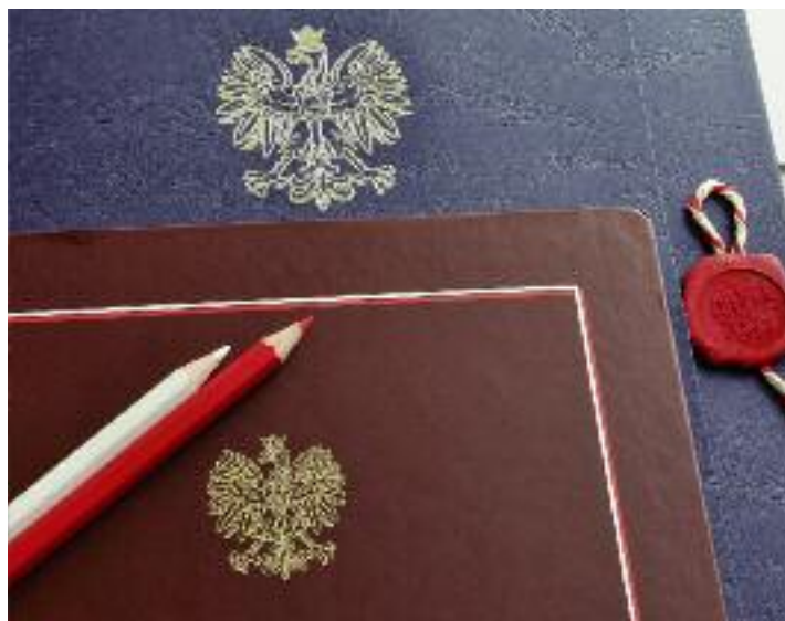
W styczniu 2016 r. resort rolnictwa zainicjował prace nad Paktem dla obszarów wiejskich

W swych założeniach Pakt dla obszarów wiejskich miał być dokumentem o charakterze porozumienia społecznego i politycznego, w sposób kompleksowy integrującym działania wielu podmiotów w realizacji wspólnego celu, jakim jest rozwój obszarów wiejskich. Jednocześnie deklarowano zamiar ujednoczenia zakresu wsparcia