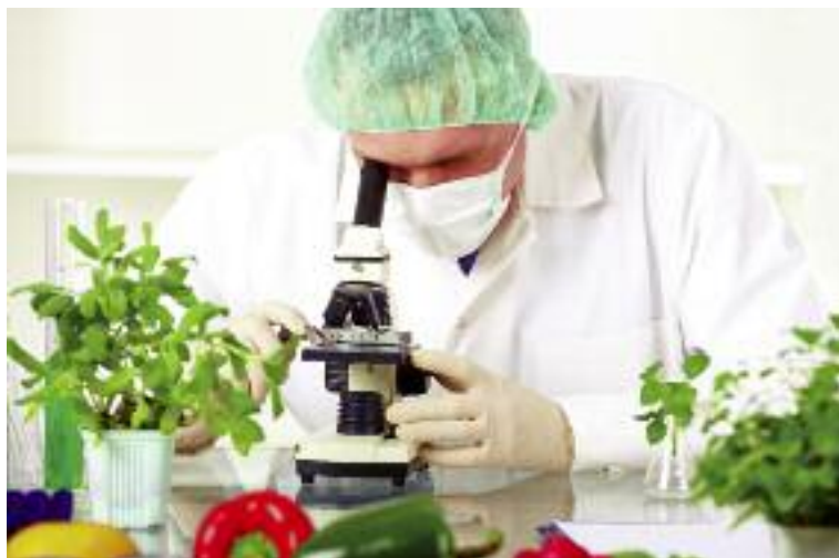
W 2016 r. rozpoczęła się realizacja czterech programów wieloletnich realizowanych przez nadzorowane instytuty