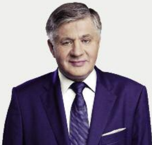
Krzysztof Jurgiel, minister rolnictwa i rozwoju wsi