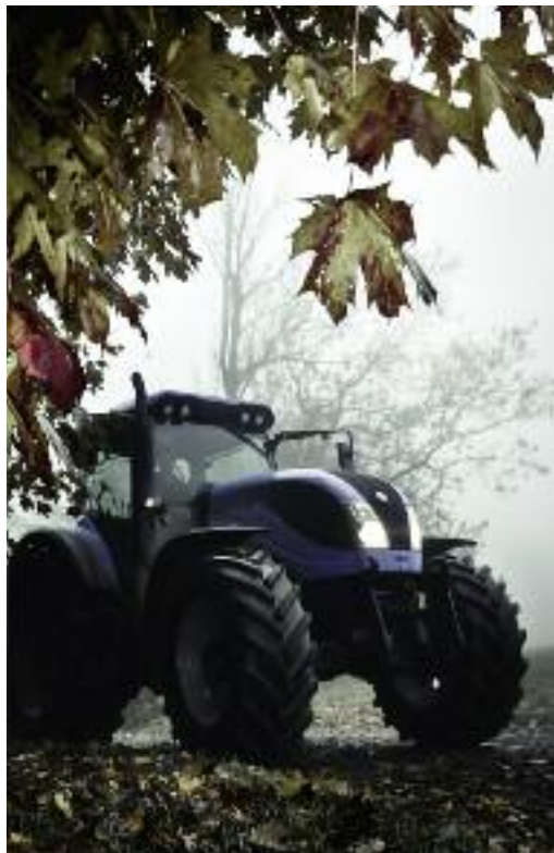
Dofinansowanie można otrzymać na zakup nowych maszyn, w miejscach, które zostały zniszczone w wyniku klęsk żywiołowych

rzowym ponieśli straty w uprawach rolnych, zwierzętach gospodarskich czy rybach w wysokości co najmniej 30% średniej rocznej produkcji rolnej w gospodarstwie z trzech lat poprzedzających rok, w którym wystąpiła szkoda, albo z trzech lat w okresie pięcioletnim poprzedzającym rok, w którym wystąpiła szkoda, z pominięciem roku o najwyższej i najniższej produkcji w gospodarstwie oraz straty dotyczą składnika gospodarstwa, którego odtworzenie wymaga poniesienia kosztów kwalifikujących się do objęcia wsparciem.