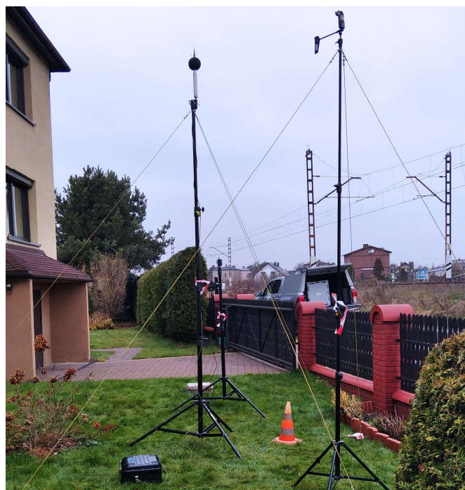
Fot. 1. Imielin, RB1. Lokalizacja punktu pomiarowego.

Lokalizację punktu pomiarowego oraz przebieg badanego odcinka linii kolejowej w rejonie punktu pomiarowego, przedstawiono na fotografiach 1-3.