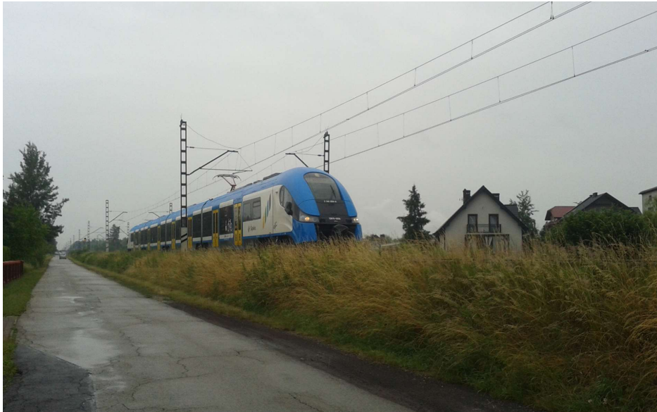
Fot. 2. Imielin, RB1. Linia kolejowa nr 138 w kierunku Mysłowic.