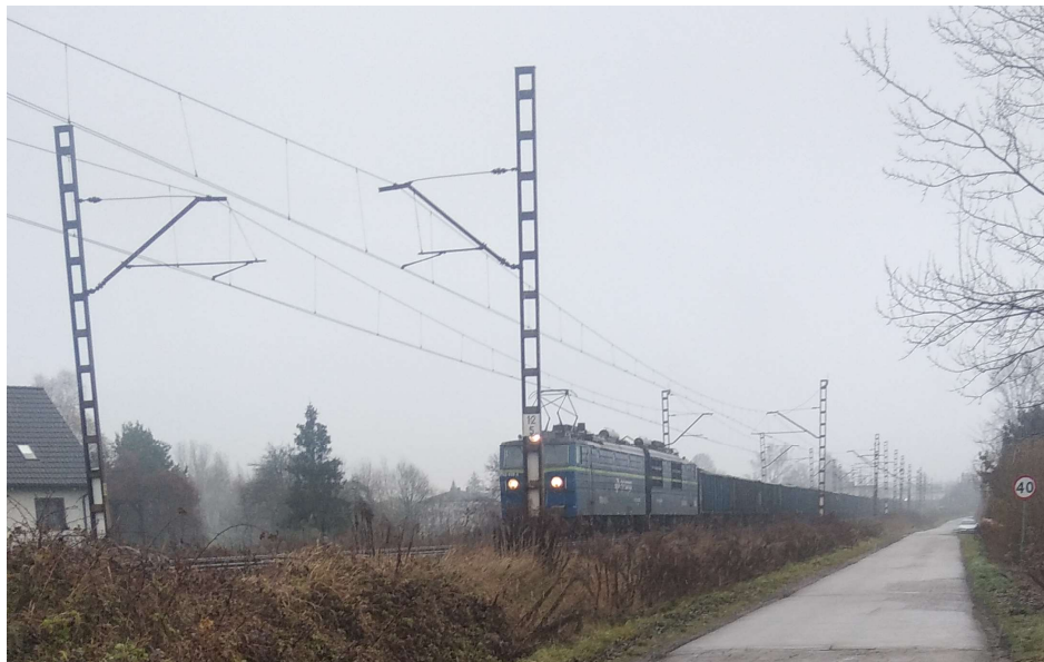
Fot. 3. Imielin, RB1. Linia kolejowa nr 138 w kierunku Chelma Śląskiego.