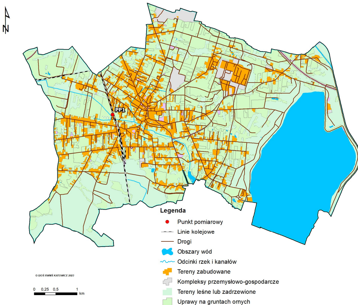
Ryc. 1. Lokalizacja punktu pomiarowego hałasu kolejowego na terenie miasta Imielin.