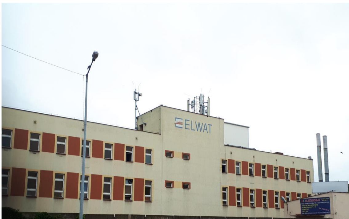
Fot. 1: Widoki anten stacji bazowej: ID: BT34071, zlokalizowanej: ul. Hubska 96/100, Wrocław