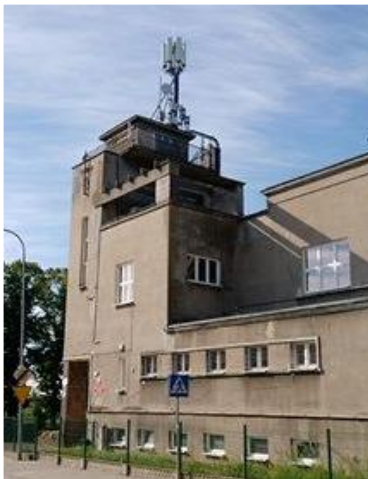
Fot. 1: Widok anten stacji bazowej: ID: BYD1058D, zlokalizowanej pod adresem: ul. Żeglarska 67, 85-001 Bydgoszcz