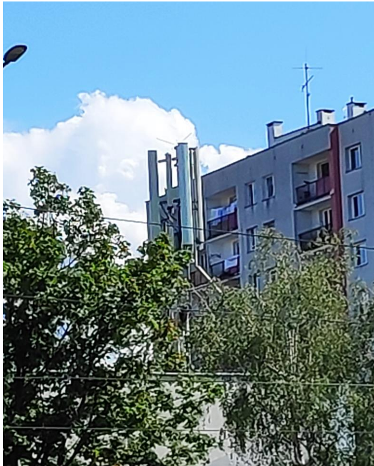
Fot. 1: Widok anten stacji bazowej ID: WRO1092, zlokalizowanej pod adresem: al. Gen. J. Hallera 81, 53-325 Wrocław