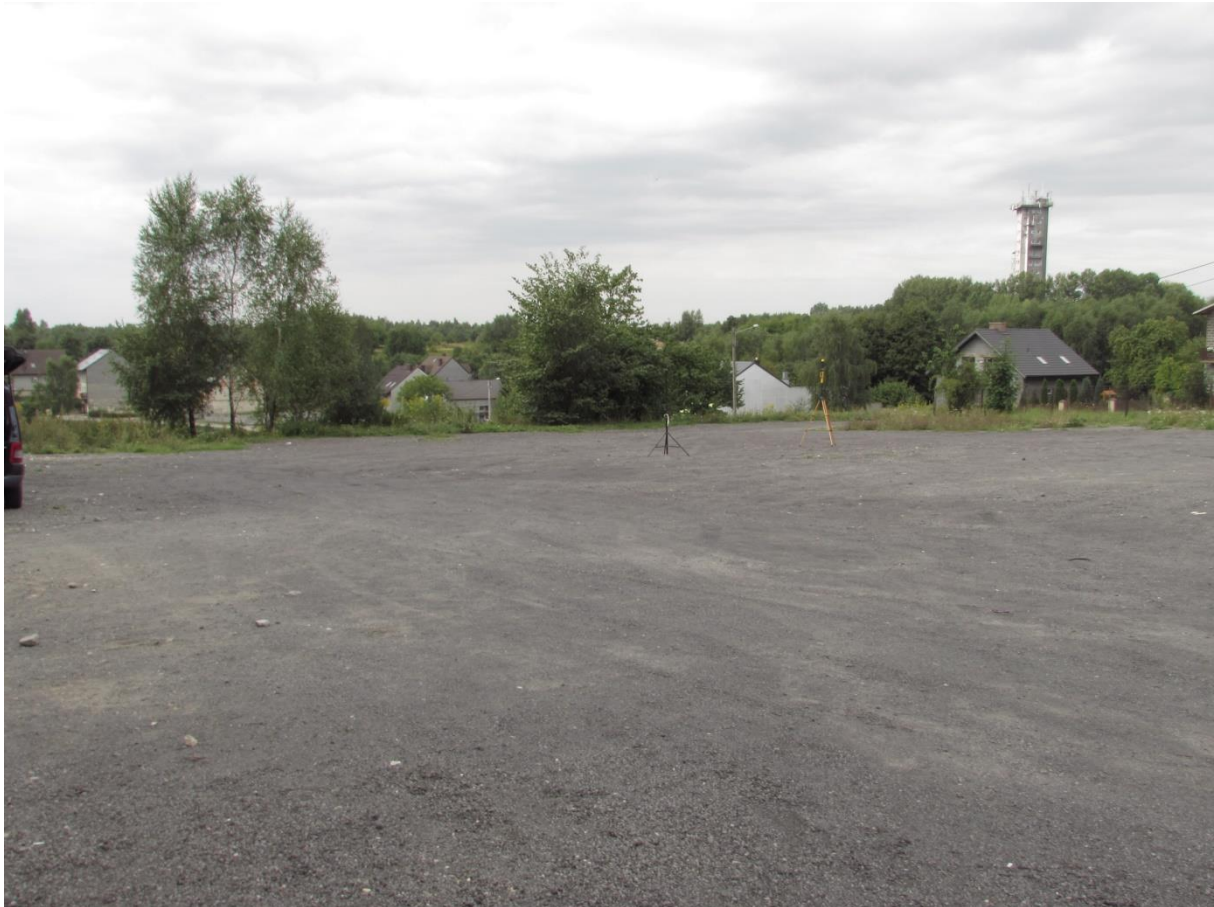
Fot. 1 Rejon badań, widok w kierunku południowo – zachodnim (SW) – konstrukcja wieży radiokomunikacyjnej SLR NIEGOWA