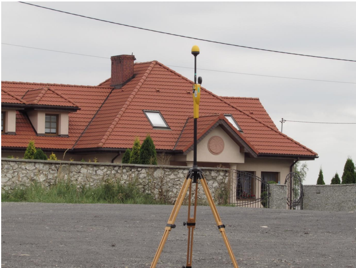
Fot. 2 Rejon badań, widok w kierunku północnym (N)