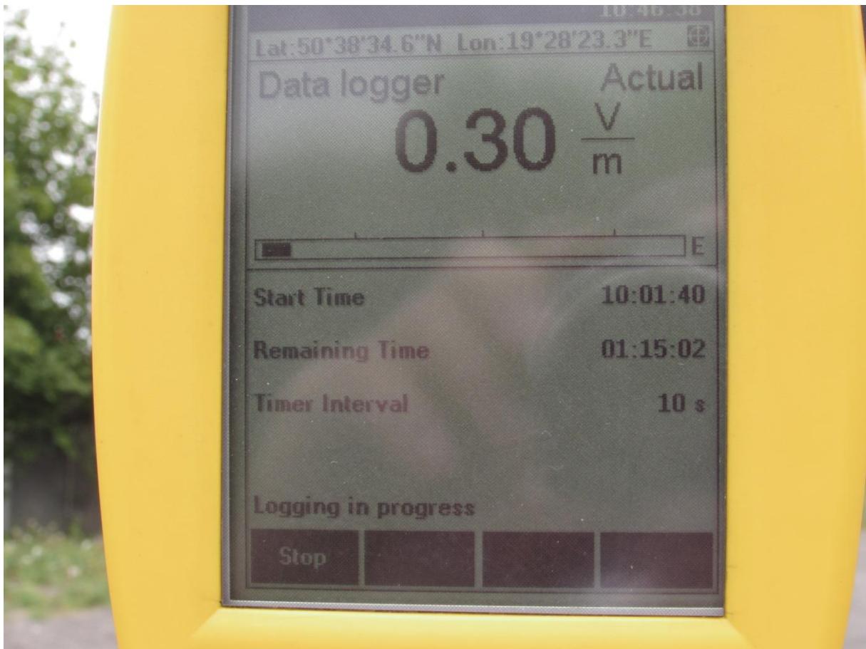
Fot. 3 Przyrząd pomiarowy w trakcie wykonywanego badania