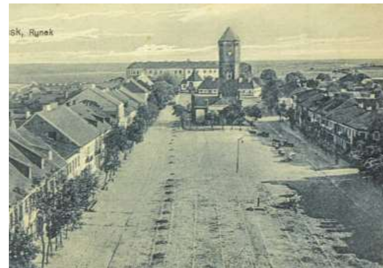
Pułtusk, woj. mazowieckie, ok. 1930