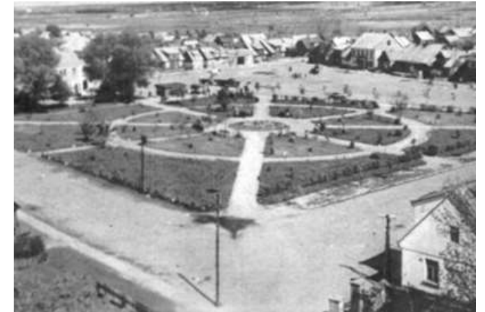
Knyszyn, woj. podlaskie

Uzdrowianie miast. Zieleń równoprawnym elementem zagospodarowania rynku.