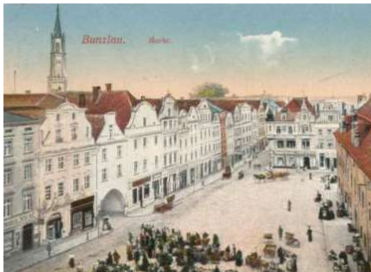
Bolesławiec, woj. dolnośląskie, ok. 1905-1910