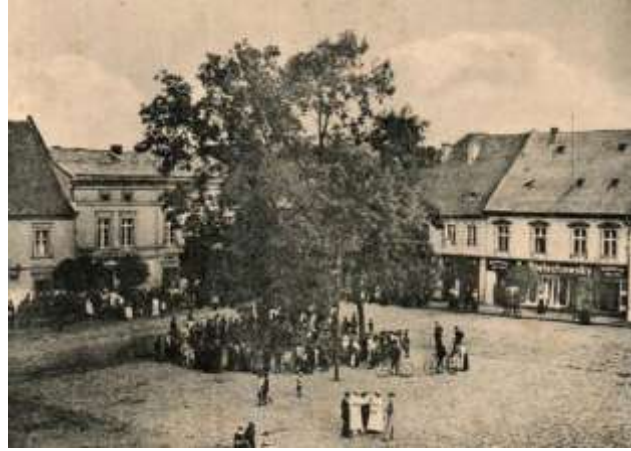
Pszczyna, woj. śląskie

Drzewa przy ratuszu, pomniku, studni, etc.