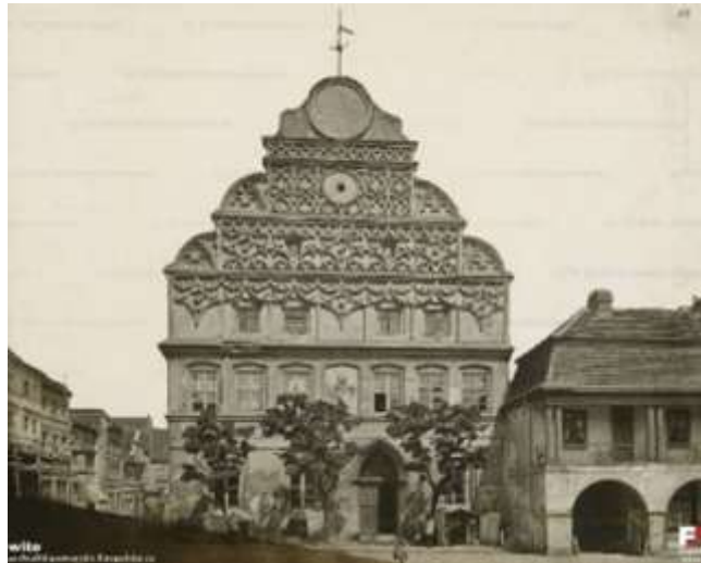
Stargard, woj. zachodniopomorskie

Rynki przestrzenią targową pozbawiona drzew, najwcześniej drzewa przy świątyniach.