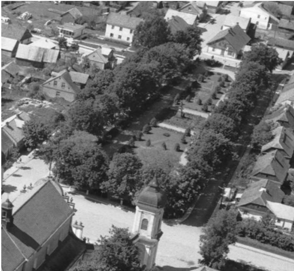
Tykocin, fot. Z. Siemaszko, 1967