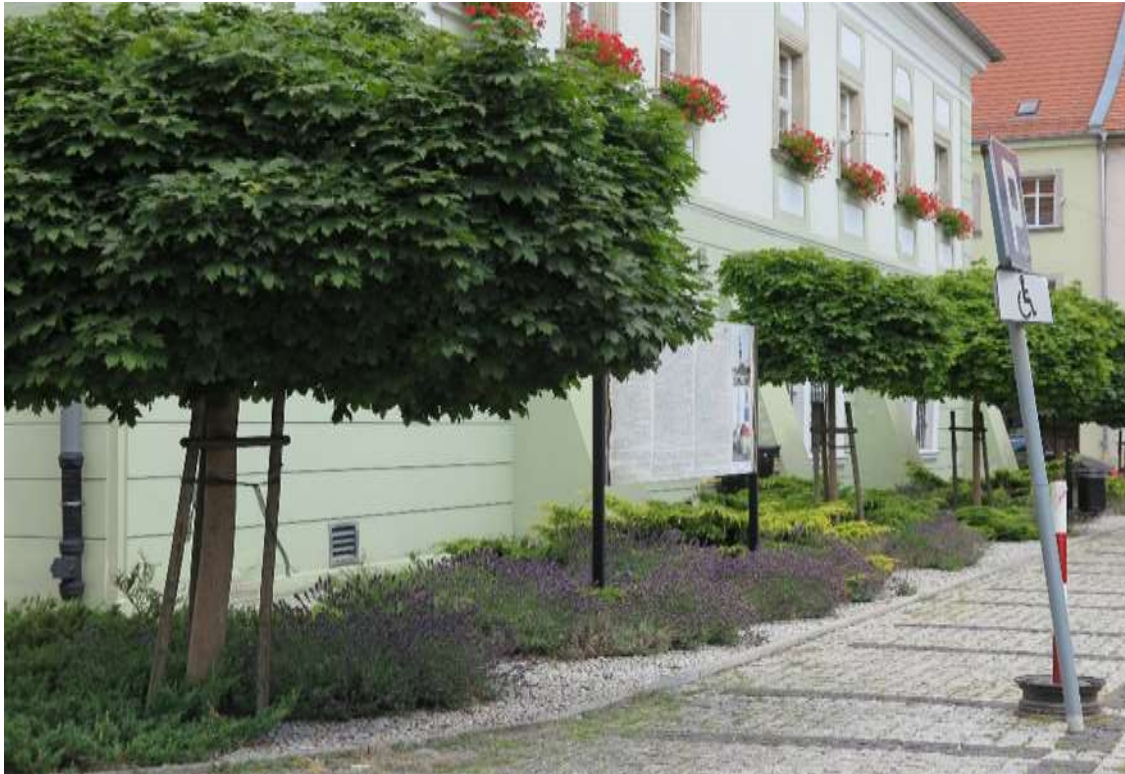
Niskie, niekolidujące obsadzenie pod drzewami