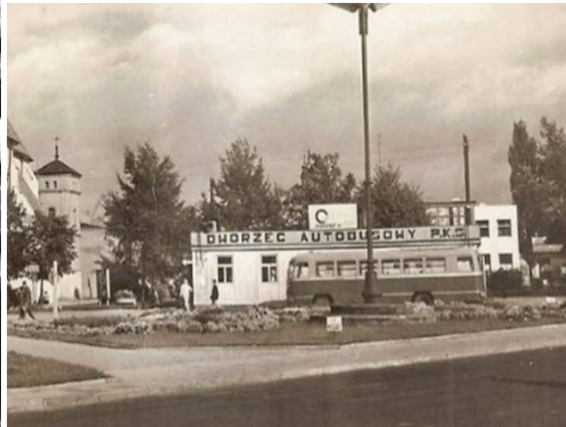
Wieluń, woj. łódzkie