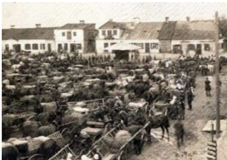
Kock, woj. lubelskie, lata 20. XX w.