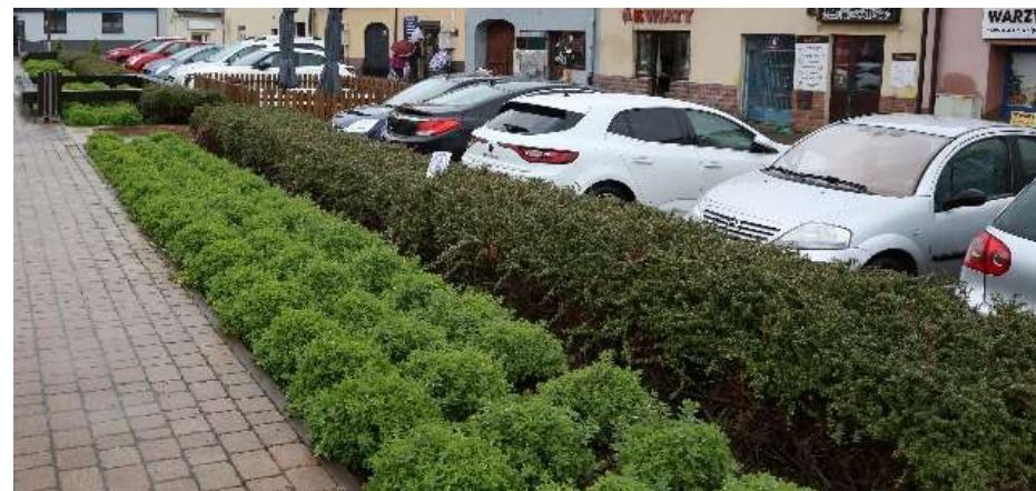
Zaznaczenie niezachowanej pierzei