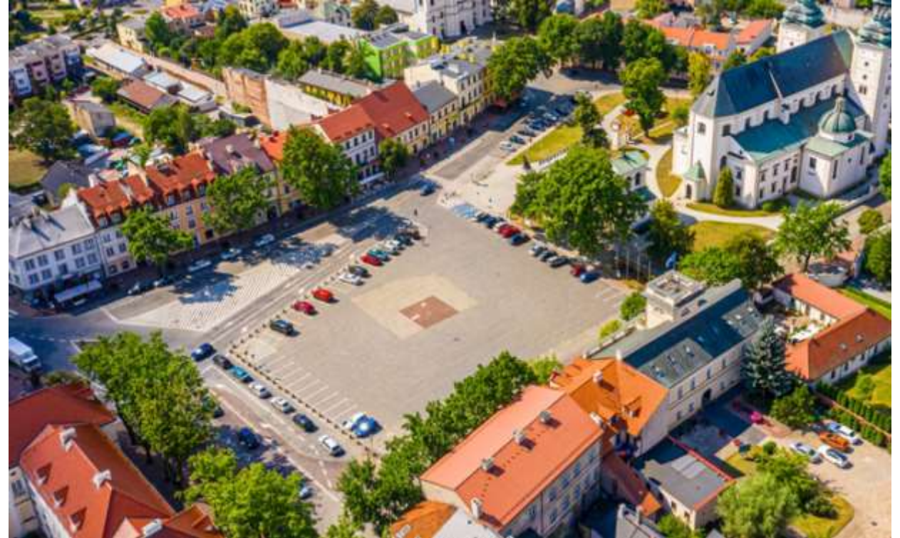
Tradycyjne rozplanowanie drzew.