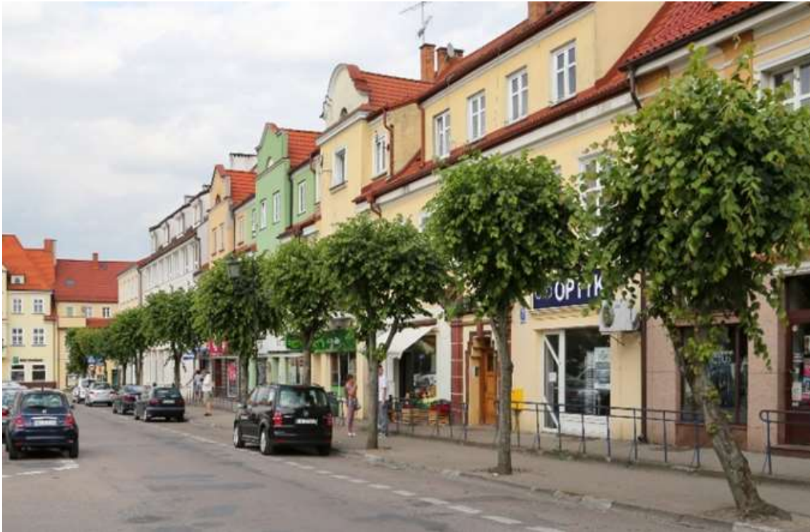
Właściwe proporcje wysokości drzew w stosunku do pierzei, prawidłowe formowanie koron