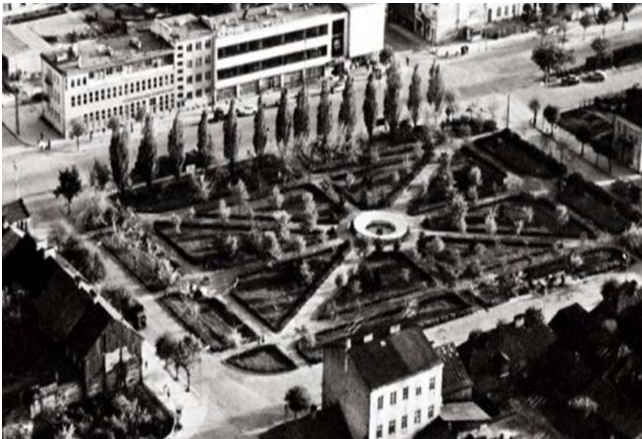
Ciechanów, woj. mazowieckie