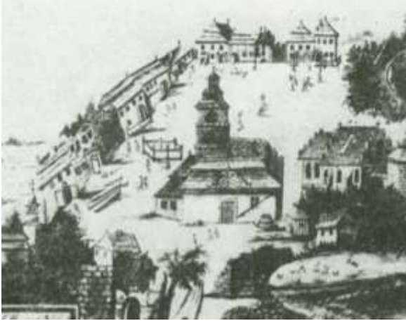
Olkusz, woj. małopolskie