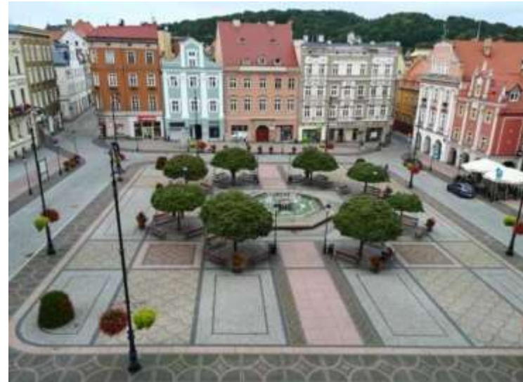
Podkreślenie akcentu architektonicznego.