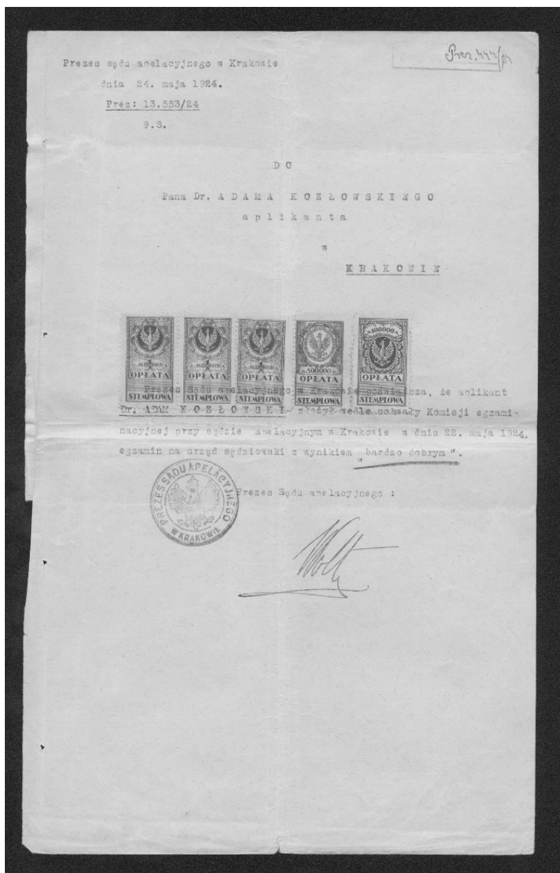
Dokument zaświadcający o zdaniu egzaminu sędziowskiego.