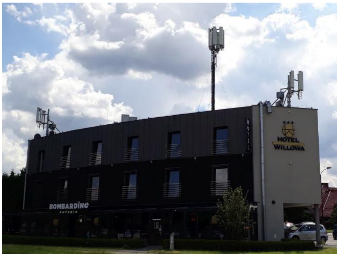
Fot. 1: Widok anten stacji bazowych: ID: LUB1067_F, ID: 86273N!, zlokalizowanych pod adresem: ul. Sławinkowska 15a, 20-810 Lublin