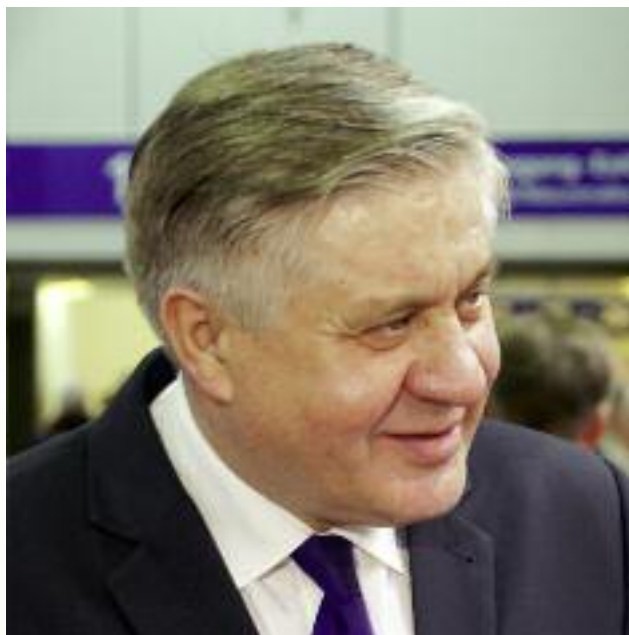
Krzysztof Jurgiel, minister rolnictwa i rozwoju wsi