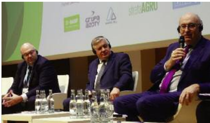
Głównym tematem Europejskiego Forum Rolniczego była Wspólna Polityka Rolna po 2020 r.

Uczestniczący w dyskusji ministrowie podkreślali także, że przy ustalaniu nowego unijnego budżetu pod uwagę powinna być brana konkurencyjność, bezpieczeń-