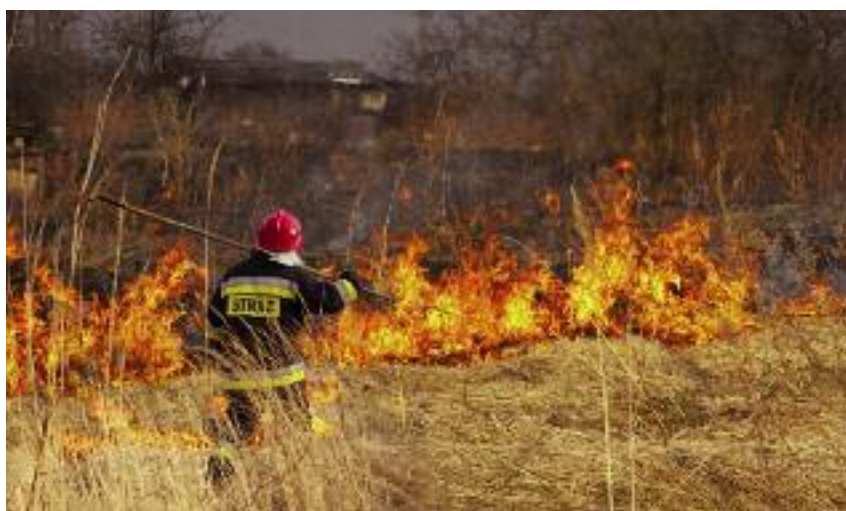
Wypalanie traw jest nie tylko szkodliwe i niebezpieczne – za wzniesienie pożarów przewidziane są również dotkliwie kary finansowe

Palące się trawy czy chwasty mogą wytwarzać toksyczne substancje, które zatrują zarówno glebę, wody gruntowe jak również niszczą atmosferę. Towarzysząca pożarom emisja pyłów i gazów zagraża również np. kierowcom poruszającym się po drogach w pobliżu pożarów. Nierzadko ogień przenosi się na pobliskie lasy czy zabudowania, pozbawiając ludzi dobytku, a czasami odbierając zdrowie czy życie. Każdego roku do szpitali trafia wiele osób poparzonych właśnie w ta-