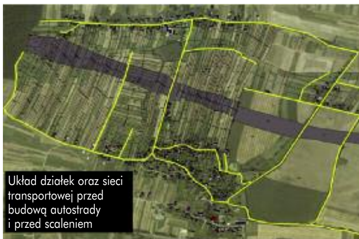
Układ działek oraz sieci transportowej przed budową autostrady i przed scaleniem

jącego wystąpienie skutków w odniesieniu do nowobudowanej inwestycji celu publicznego na rolniczą przestrzeń produkcyjną, w szczególności tych związanych z pogorszeniem ukształtowania rozłogów gruntów wskutek działalności przemysłowej, przebiegu istniejących