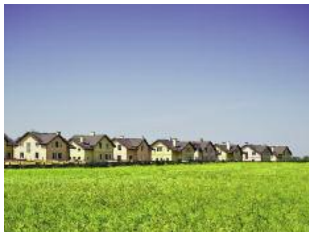
W programie „Mieszkanie plus” uczestniczy, poprzez udostępnianie gruntów Zasobu Własności Rolnej Skarbu Państwa, Krajowy Ośrodek Wsparcia Rolnictwa

W tym programie uczestniczy Krajowy Ośrodek Wsparcia Rolnictwa poprzez udostępnianie gruntów Zasobu Własności Rolnej Skarbu Państwa. Rozwój budownic-