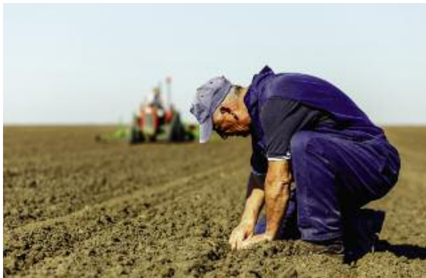
Raport OECD wskazał m.in. na niekorzystne trendy demograficzne na obszarach wiejskich

usług, infrastruktury transportowej) oraz nowoczesne zarządzanie ważnymi czynnikami rozwoju obszarów wiejskich;