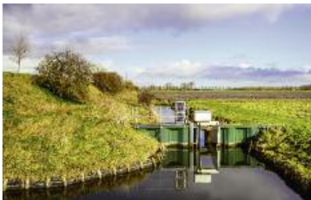
W ramach Strategii na rzecz Odpowiedzialnego Rozwoju zaplanowano projekt „Woda dla rolnictwa”