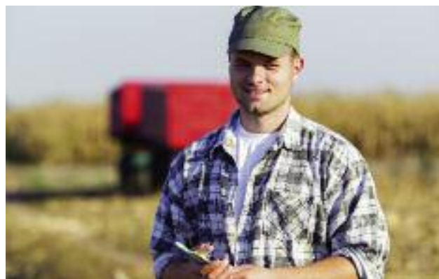
Ponad 10 mln ha wyniosła powierzchnia użytków rolnych, do której w ub.r. dokonano zwrotu podatku akcyzowego

Na ten cel w 2017 r. zostało przeznaczony 895 mln zł. Powierzchnia użytków rolnych do której dokonano