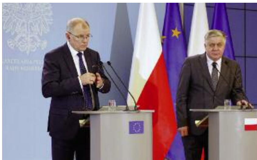
Konferencja prasowa komisarza Vytenisa Andriukaitisa i ministra rolnictwa Krzysztofa Jurgiel