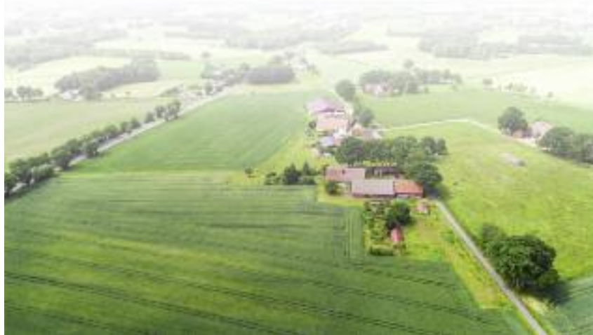
Termin składania wniosków o przyznanie płatności został przedłużony do 15 czerwca br.