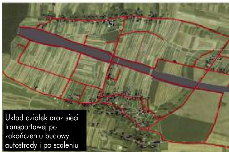
Układ działek oraz sieci transportowej po zakończeniu budowy autostrady i po scaleniu

lub budowanych dróg publicznych, kolei, rurociągów naziemnych oraz zbiorników wodnych lub urządzeń melioracji wodnych. Wydanie przez starostę postanowienia stwierdzającego wystąpienie negatywnych skutków w związku z budową autostrady lub drogi ekspresowej, będzie podstawą do wszczęcia z urzędu postępowania scaleniowego oraz obciążenia w drodze postanowienia inwestora (Generalnej Dyrekcji Dróg Krajowych i Autostrad)