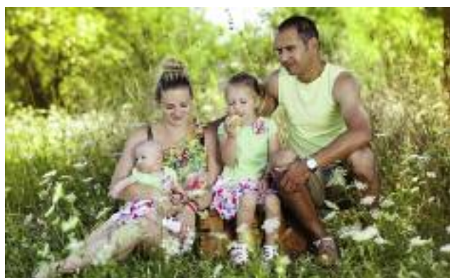
Na wsi świadczenie wychowawcze trafia do 1,287 mln dzieci

Na wsi świadczenie wychowawcze trafia do 1,287 mln dzieci. W gminach miejsko-wiejskich z pomocy korzysta 0,9 mln dzieci, a w gminach miejskich ponad 1,433 mln dzieci. Od początku funkcjonowania programu do końca stycznia 2018 r. do rodzin w gminach wiejskich trafiło ponad 14,9 mld zł, w gminach miejsko-wiejskich ponad 0,9 mld zł, a w gminach miejskich ponad 16,5 mld zł. Program „500+” przygotowany został przez Ministra Rodziny Pracy i Polityki Społecznej.