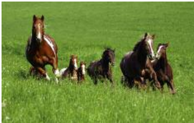
Przygotowany w roku ubiegłym „Narodowy program hodowli koni w Polsce” wskazuje działania naprawcze i rozwojowe dotyczące hodowli koni

skie Nasiona, których celem jest dokonanie jakościowego skoku w postępie hodowlanym oraz poprawa dostępności i jakości materiału siewnego.