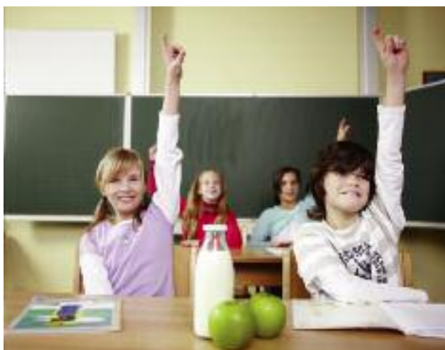
Do nowego „Programu dla szkół” zgłosiło się ponad 13,1 tys. szkół podstawowych

Do Programu dla szkół zgłosiło się ponad 13,1 tys. szkół podstawowych (12,5 tys. szkół podstawowych w komponencie mlecznym i 12,3 tys. szkół w komponencie owocowo-warzywnym). W każdym z komponentów weźmie udział po ponad 1,8 mln dzieci z grupy docelowej programu (klasy I-V), co stanowi ok. 92% dzieci z tych klas w całej Polsce.