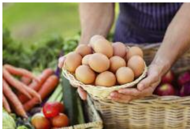
Wprowadzono ułatwienia w sprzedaży bezpośredniej żywności przez rolników