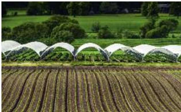
Kwota płatności bezpośrednich w ramach kampanii 2017 r. wyniesie 14,8 mld zł

Płatności wspierające zrównoważone praktyki w produkcji rolnej: Płatności ONW, Płatności rolno-środowiskowo-klimatyczne, Płatności na rzecz rolnictwa ekologicznego, Płatność na zalesienia.