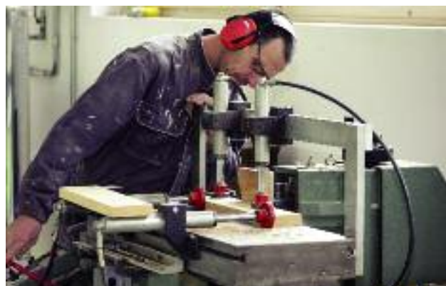
Celem głównym projektu „Nowe szanse dla wsi” jest aktywizacja zawodowa rolników oraz osób związanych z rolnictwem dla potrzeb pozarolniczego rynku pracy

Do końca 2017 r. w projektach z zakresu aktywizacji zawodowej i przedsiębiorczości wsparto 175,6 tys. osób pochodzących z obszarów wiejskich w programie POWER oraz 106,2 tys. w programach RPO. W ramach operacji typu „Premie na rozpoczęcie działalności pozarolniczej” przewidzianej w Programie Rozwoju