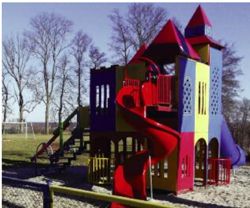
Na nieodpłatnie przekazanych przez KOWR samorządom lokalnym gruntach powstają m.in. place zabaw