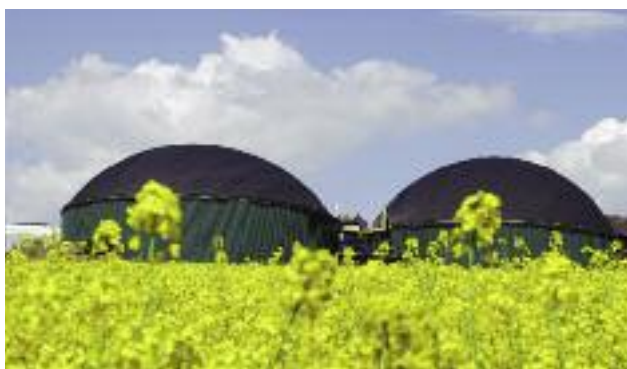
Efektom działań podjętych w ramach projektu „Energetyka rozproszona” jest m.in. zapewnienie stabilnego zapotrzebowania na krajową produkcję biokomponentów

Projekt strategiczny SOR „Energetyka rozproszona”, koordynowany przez Ministra Energetyki, ma na celu m.in. wprowadzenie ułatwień dla rozwoju energetyki odnawialnej na obszarach wiejskich. W efekcie dotychczas podjętych działań: