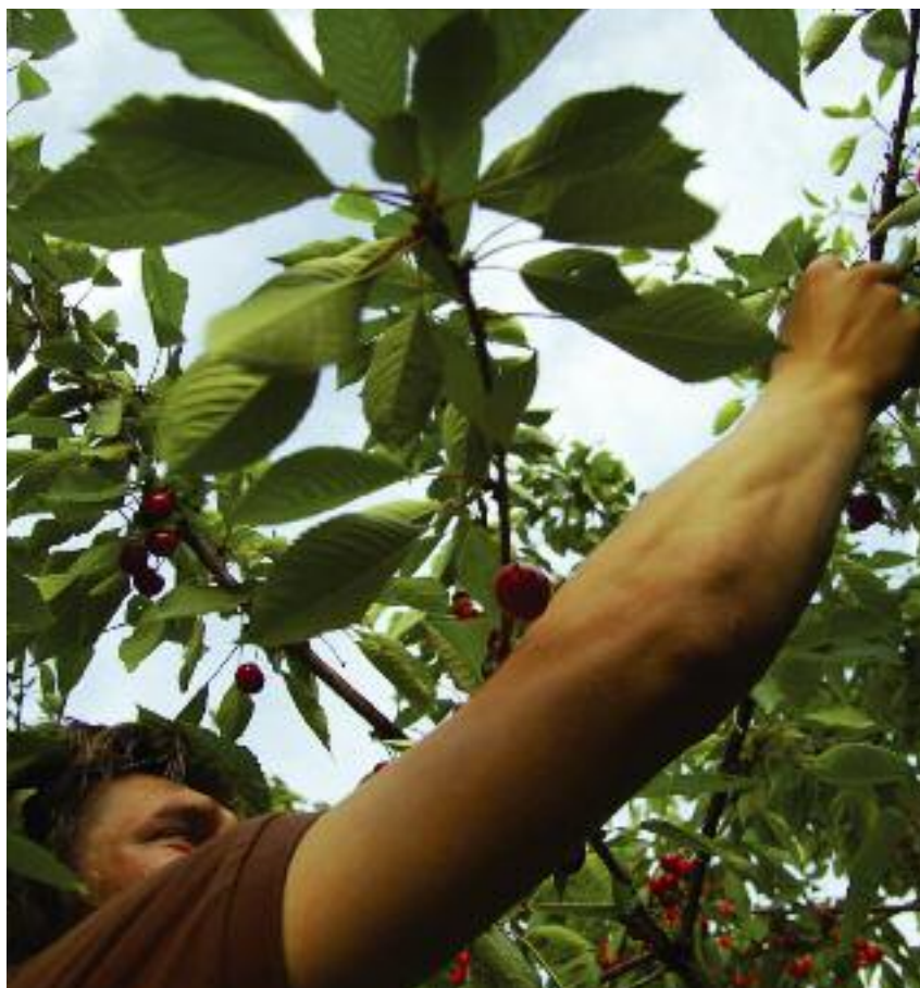
Umowę o pomocy przy zbiorach będzie można zawrzeć na okres nie dłuższy niż 180 dni w ciągu roku kalendarzowego

• zbieranie chmielu, owoców, warzyw, tytoniu, ziół i roślin zielarskich;