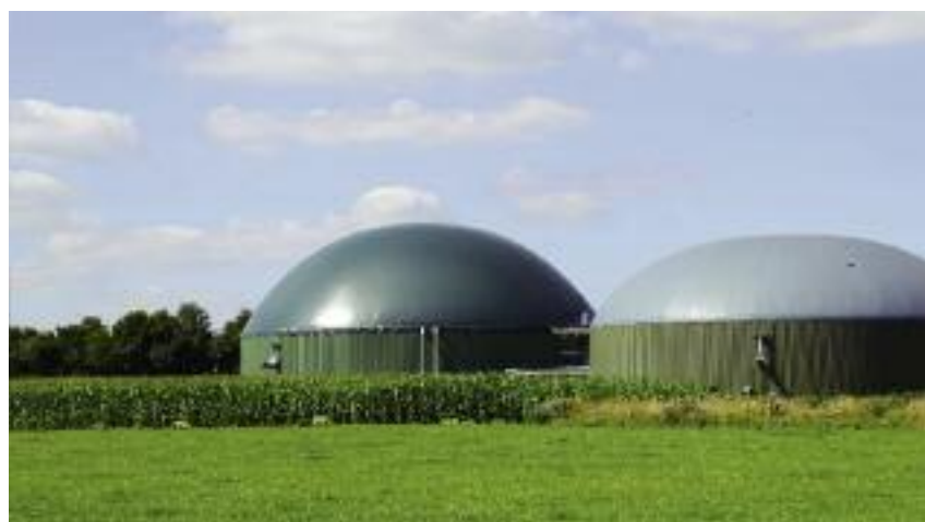
Wprowadzenie zmian w ustawie o nawozach związane jest m.in. z rozwojem biogazowni rolniczych oraz potrzebą wprowadzenia przepisów ułatwiających nawozowe zagospodarowanie produktów pofermentacyjnych powstających w procesie fermentacji metanowej z surowców rolniczych

miotów, które wprowadzają swoje produkty na podstawie pozwoleń MRiRW;