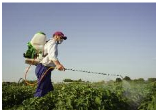
Troska o zdrowie konsumentów wymaga, by płody rolne były bezwzględnie wolne od przekroczeń najwyższych dopuszczalnych pozostałości środków ochrony roślin

Departament Hodowli i Ochrony Roślin ☎ 22 623 21 51