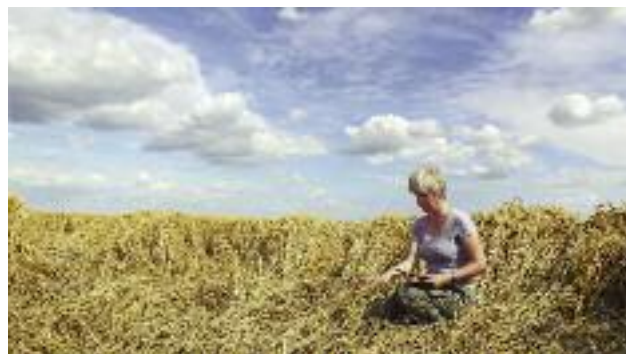
W 2017 r. powierzchnia ubezpieczonych upraw wyniosła 3,2 mln ha

• Dopłaty do składek ubezpieczenia upraw rolnych i zwierząt gospodarskich. Wprowadzone w 2017 r. zmiany w przepisach o ubezpieczeniu upraw i zwierząt