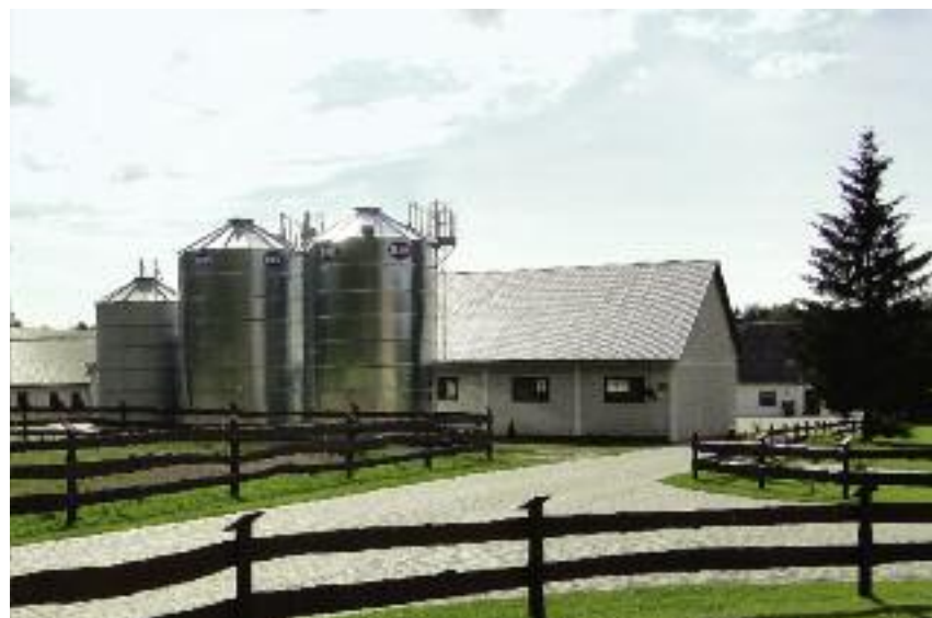
Główne rekomendacje raportu dotyczą zwiększenia wsparcia dla modernizacji sektora rolnego