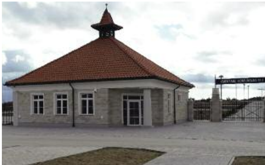
Od 2012 r. otrzymane grunty mogą być również wykorzystane przez samorzady lokalne na budowę nekropolii

Od początku funkcjonowania programu do chwili obecnej bezzwrotna pomoc finansowa przekroczyła 1 mld zł. W 2017 r. gminom i spółdzielniom mieszkaniowym została wypłacona kwota w wysokości 30 mln zł. Środki te przeznaczono na doprowadzenie mienia nieodpłatnie przekazanego tym jednostkom do stanu technicznego umożliwiającego jego sprawną eksploatację. 75% bezzwrotnej pomocy finansowej dotyczyło inwestycji w zakresie budowy i remontu dróg i chodników, reszta związana była z finansowaniem infrastruktury gospodarki wodno-ściekowej (sieci wodociągowej i kanalizacyjnej, oczyszczalni ścieków, stacje uzdatniania wody, hydrofarmie) oraz remontem budynków i lokali, sieci ciepłowniczych czy kotłowni.