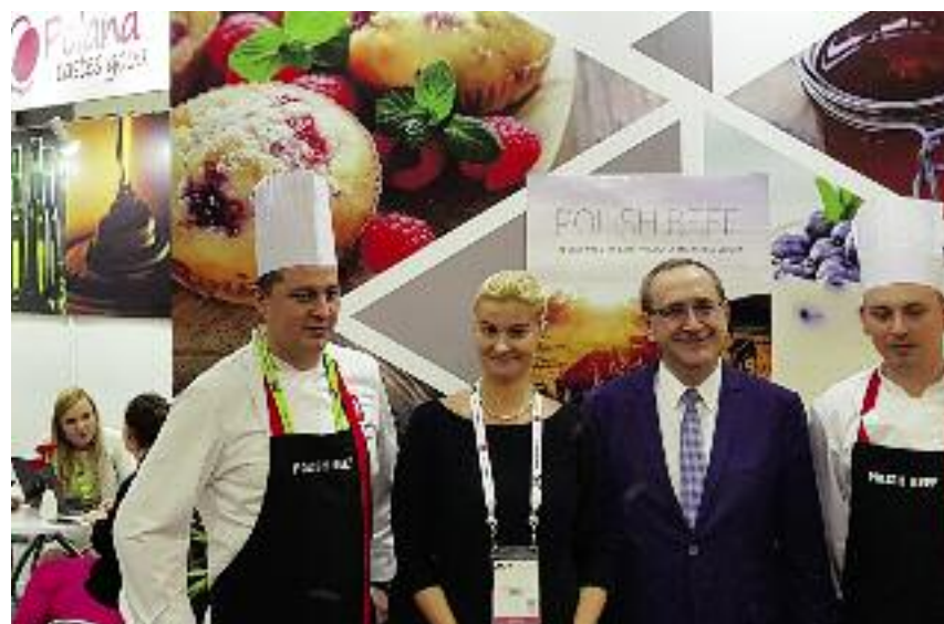
Sekretarz stanu Jacek Bogucki na stoisku MRiRW podczas targów Food & Hotel Asia 2018

W 2017 r. Polska wyeksportowała do Singapuru towary rolno-spożywcze o wartości ok. 12,5 mln euro, co stanowiło wzrost o ok. 24% w porównaniu do 2017 r.