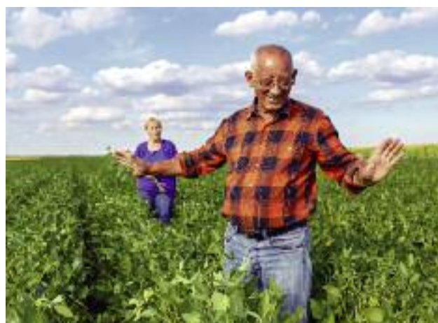
Najniższe świadczenia emerytalno-rentowe zostały podwyższone do kwoty 1000 zł