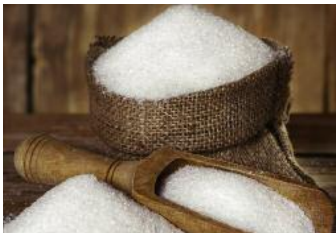
Budowany terminal cukrowy umożliwi sprzedaż eksportową poza UE ok. 300 tys. ton cukru w ciągu roku

Budowa pierwszego terminalu cukrowego w Polsce umożliwi sprzedaż eksportową poza UE ok. 300 tys. ton cukru w ciągu roku, a możliwość zmagazynowania dodatkowej ilości cukru w porcie ograniczy koniecz-