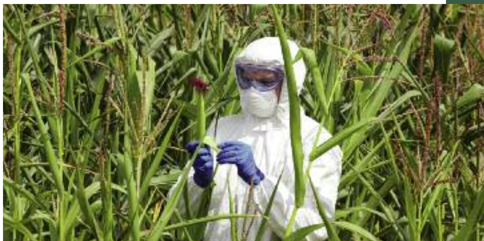
Znowelizowana ustawa o mikroorganizmach i organizmach genetycznie zmodyfikowanych umożliwi Państwowej Inspekcji Ochrony Roślin i Nasiennictwa nie tylko weryfikację zastosowanego do siewu materiału, ale również sprawdzenie upraw na polu

Znaczącej zmianie podlegają natomiast zasady kontroli upraw. Na mocy przepisów ustawy o na-