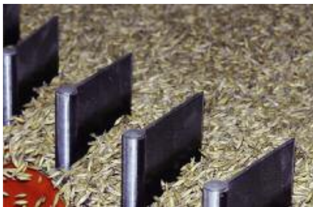
Spółki hodowlane KOWR oferują rolnikom materiał siewny najwyższej jakości

Główne priorytety, które uwzględniane są w pracach hodowlanych to: plonowanie, odporność na stresy biotyczne i abiotyczne, specyficzne dla danego gatunku cechy jakościowe oraz cenne właściwości użytkowe. Ważna jest także hodowla odmian o zwiększonej tolerancji na suszę, dużą zmienność pogody klimatu przejściowego oraz wyższym, niż dotychczas akceptowany, poziomie zimotrwałości. W doborze odmian