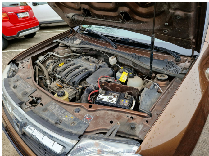
Dok. fot. z dnia 13.03.2023 fot. nr 14