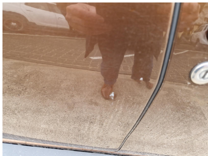
Dok. fot. z dnia 13.03.2023 fot. nr 18