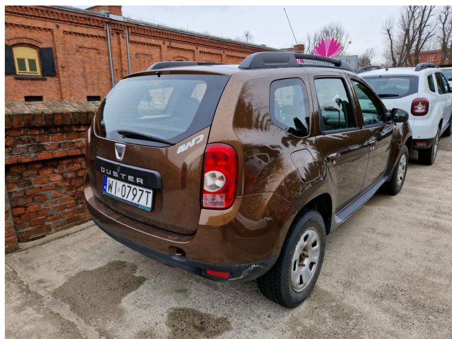
Dok. fot. z dnia 13.03.2023 fot. nr 4