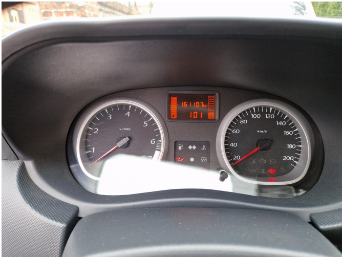
Dok. fot. z dnia 13.03.2023 fot. nr 9