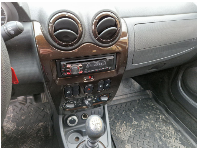
Dok. fot. z dnia 13.03.2023 fot. nr 11