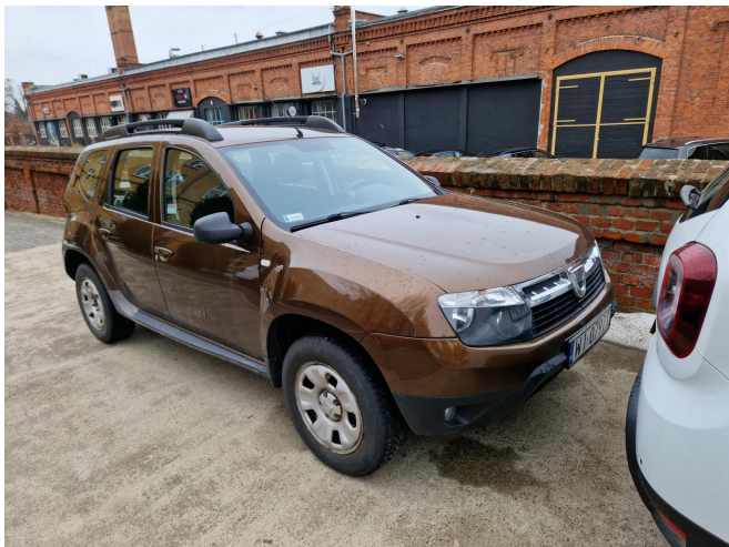
Dok. fot. z dnia 13.03.2023 fot. nr 1