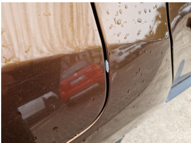
Dok. fot. z dnia 13.03.2023 fot. nr 17