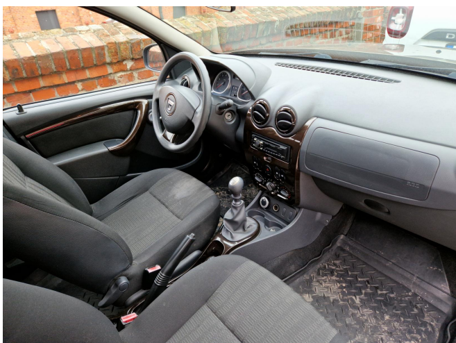
Dok. fot. z dnia 13.03.2023 fot. nr 5