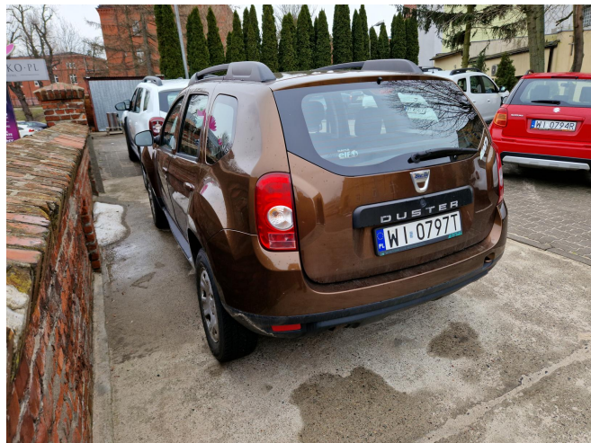
Dok. fot. z dnia 13.03.2023 fot. nr 2