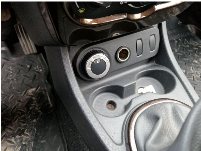
Dok. fot. z dnia 13.03.2023 fot. nr 13