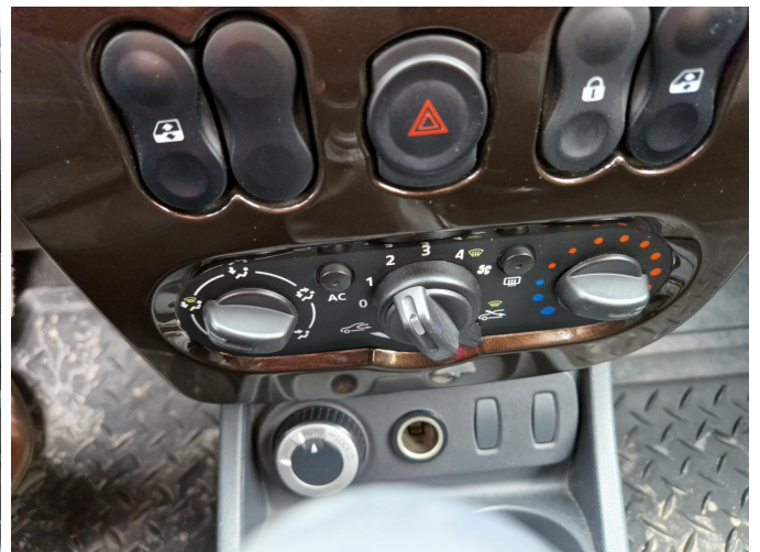
Dok. fot. z dnia 13.03.2023 fot. nr 12