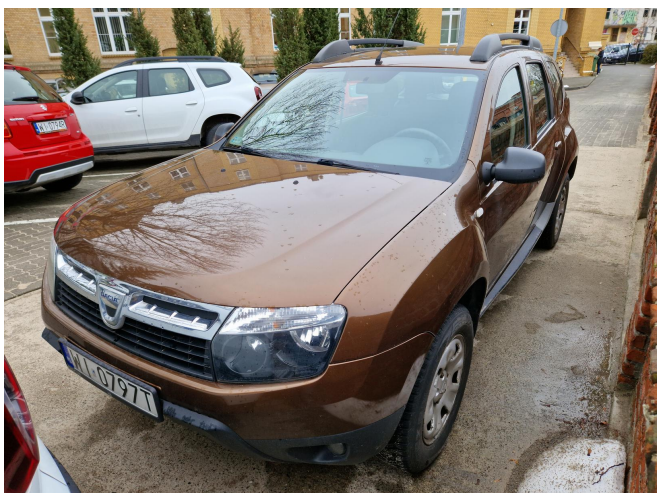
Dok. fot. z dnia 13.03.2023 fot. nr 3