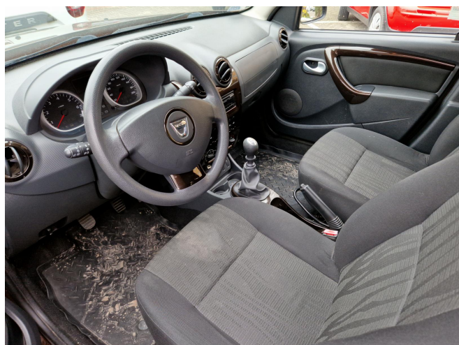
Dok. fot. z dnia 13.03.2023 fot. nr 6