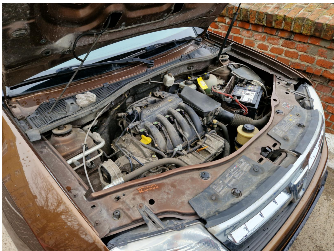
Dok. fot. z dnia 13.03.2023 fot. nr 15