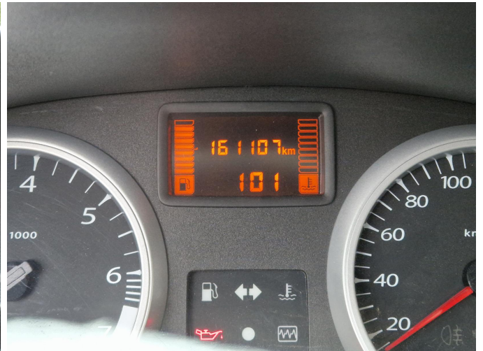
Dok. fot. z dnia 13.03.2023 fot. nr 10