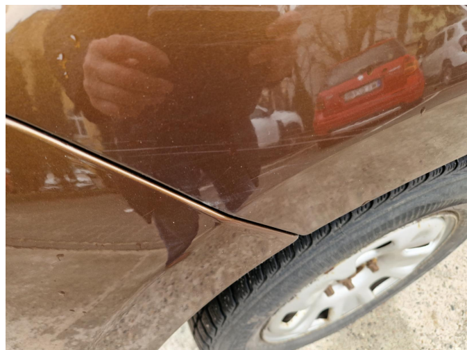
Dok. fot. z dnia 13.03.2023 fot. nr 16