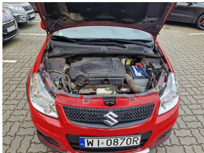
Dok. fot. z dnia 26.03.2024 fot. nr 22