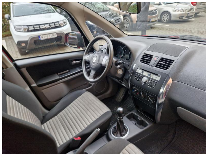
Dok. fot. z dnia 26.03.2024 fot. nr 10