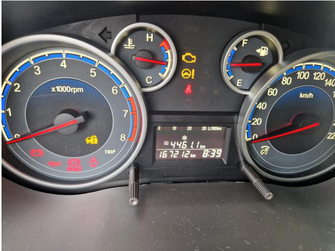
Dok. fot. z dnia 26.03.2024 fot. nr 13