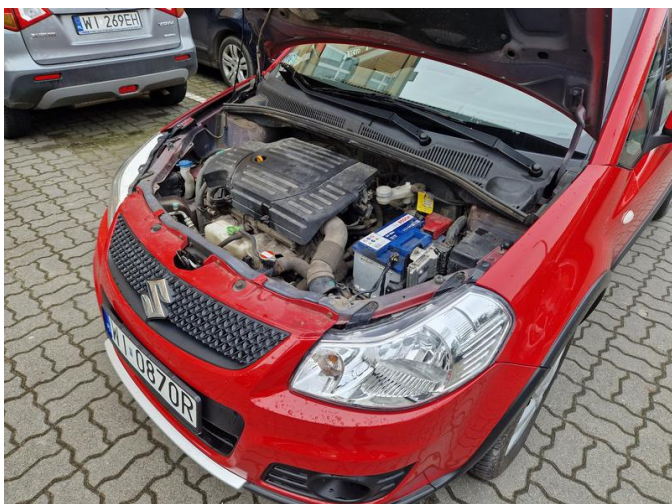
Dok. fot. z dnia 26.03.2024 fot. nr 23