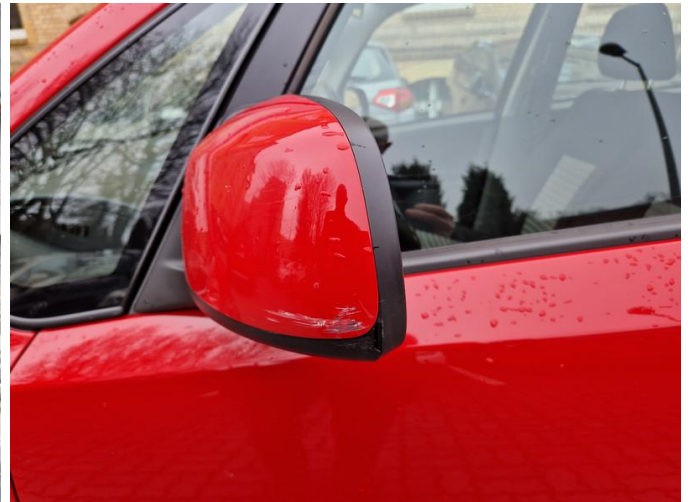
Dok. fot. z dnia 26.03.2024 fot. nr 16