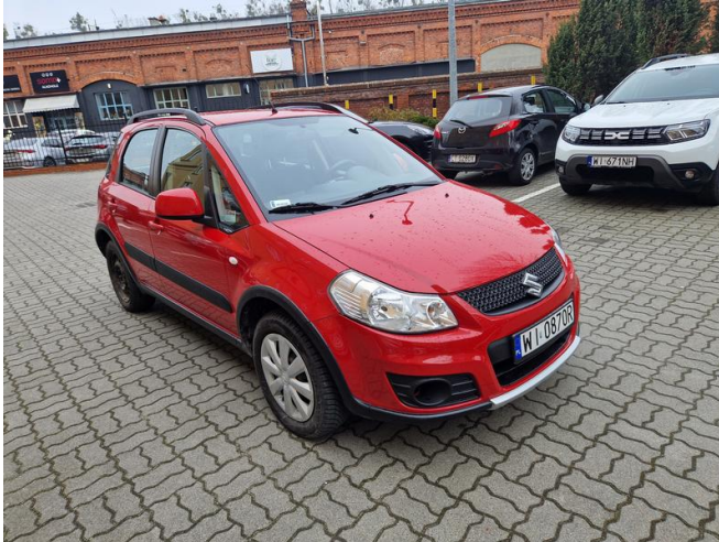
Dok. fot. z dnia 26.03.2024 fot. nr 1