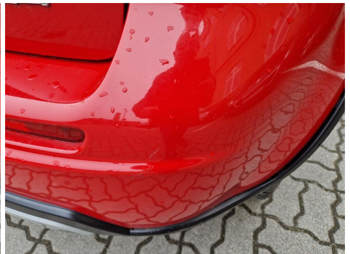
Dok. fot. z dnia 26.03.2024 fot. nr 18