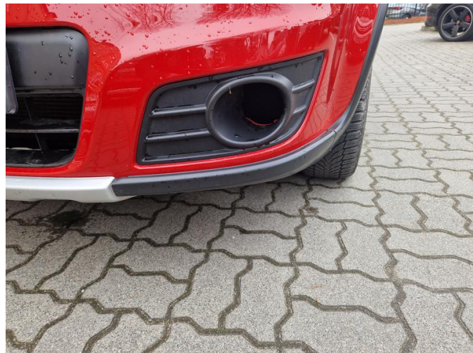
Dok. fot. z dnia 26.03.2024 fot. nr 20