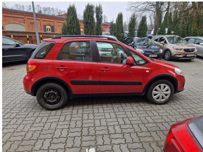
Dok. fot. z dnia 26.03.2024 fot. nr 8