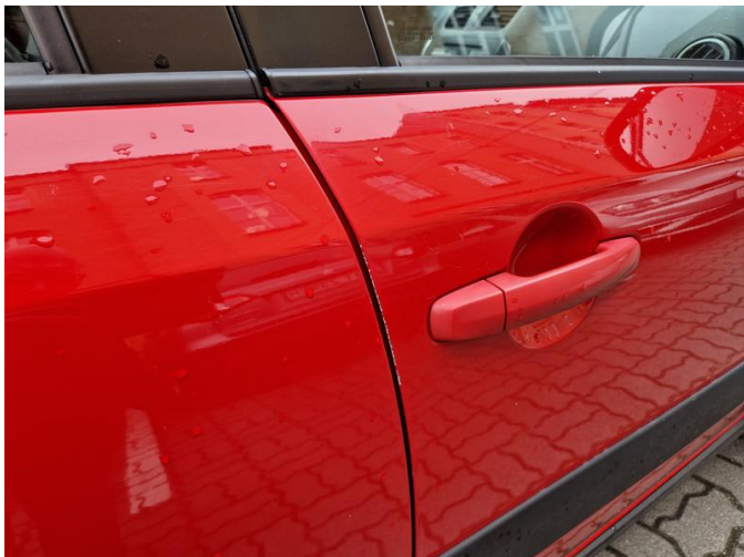
Dok. fot. z dnia 26.03.2024 fot. nr 19