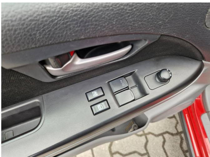
Dok. fot. z dnia 26.03.2024 fot. nr 11