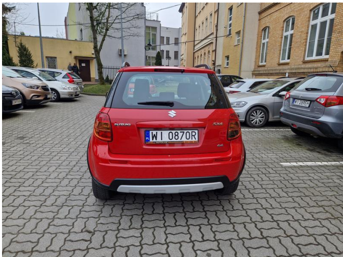
Dok. fot. z dnia 26.03.2024 fot. nr 7