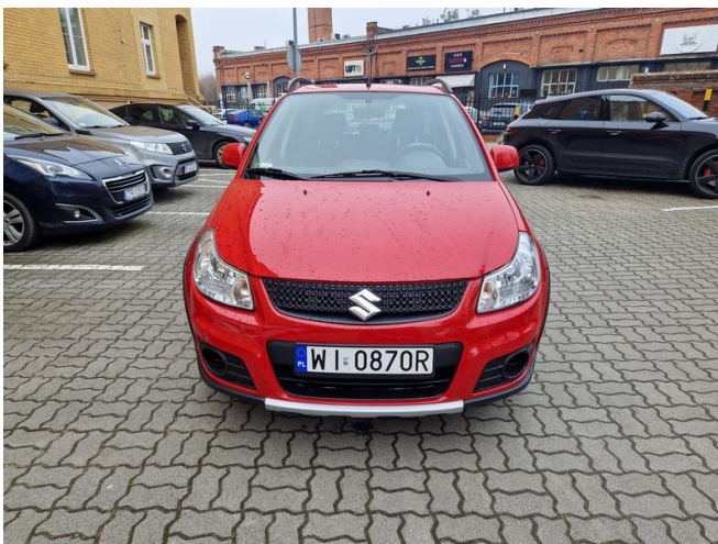
Dok. fot. z dnia 26.03.2024 fot. nr 5