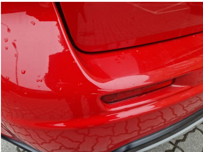
Dok. fot. z dnia 26.03.2024 fot. nr 17