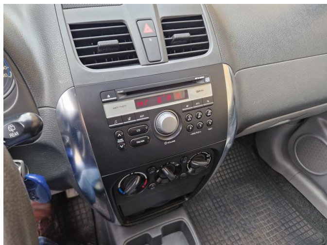
Dok. fot. z dnia 26.03.2024 fot. nr 12