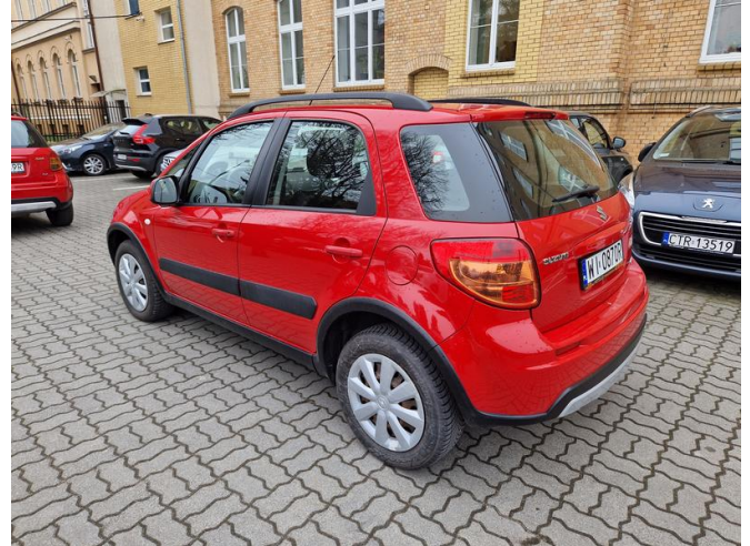
Dok. fot. z dnia 26.03.2024 fot. nr 2