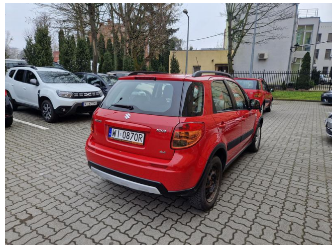
Dok. fot. z dnia 26.03.2024 fot. nr 4