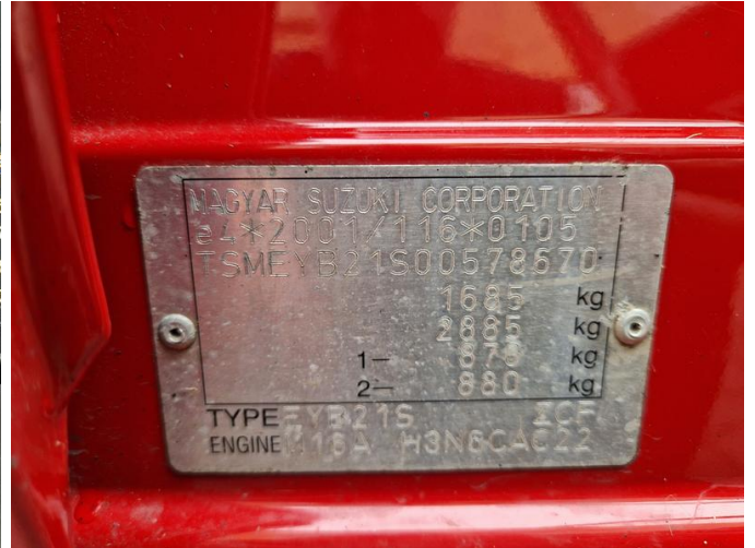
Dok. fot. z dnia 26.03.2024 fot. nr 14