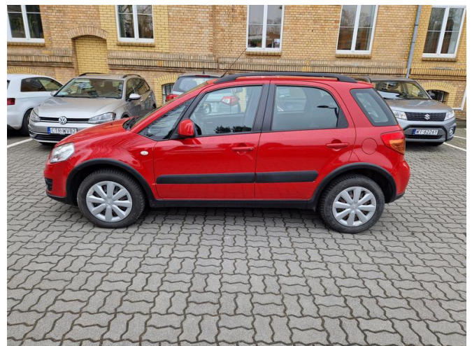
Dok. fot. z dnia 26.03.2024 fot. nr 6