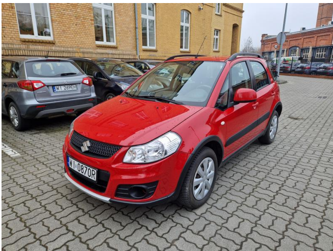
Dok. fot. z dnia 26.03.2024 fot. nr 3