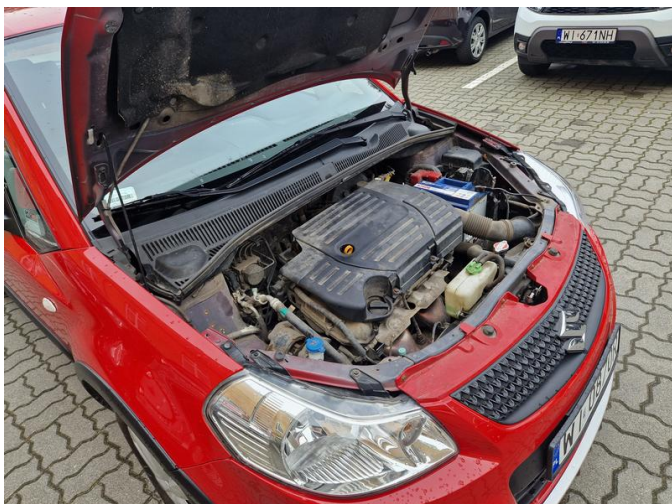
Dok. fot. z dnia 26.03.2024 fot. nr 21