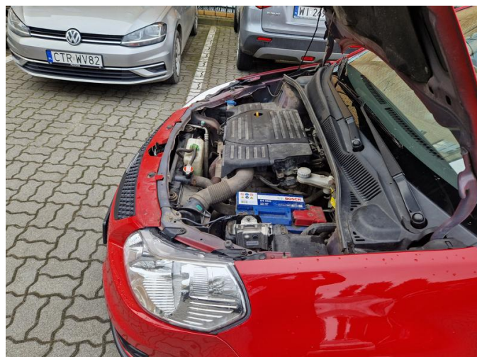
Dok. fot. z dnia 26.03.2024 fot. nr 24