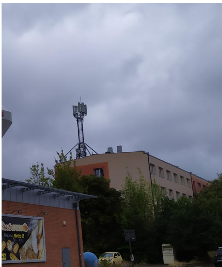
Fot. 1: Widok anten stacji bazowej ID: SZC1062_M, zlokalizowanej pod adresem: ul. Smolańska 4, 70-026 Szczecin