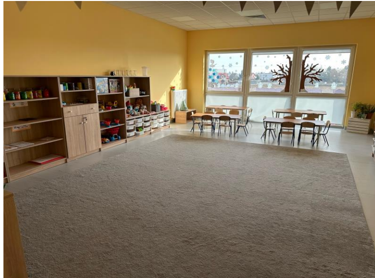
Zdjęcie nr 6. Sala zajęć w nowym Przedszkolu nr 5 w Kościanie „Łamiglówka”