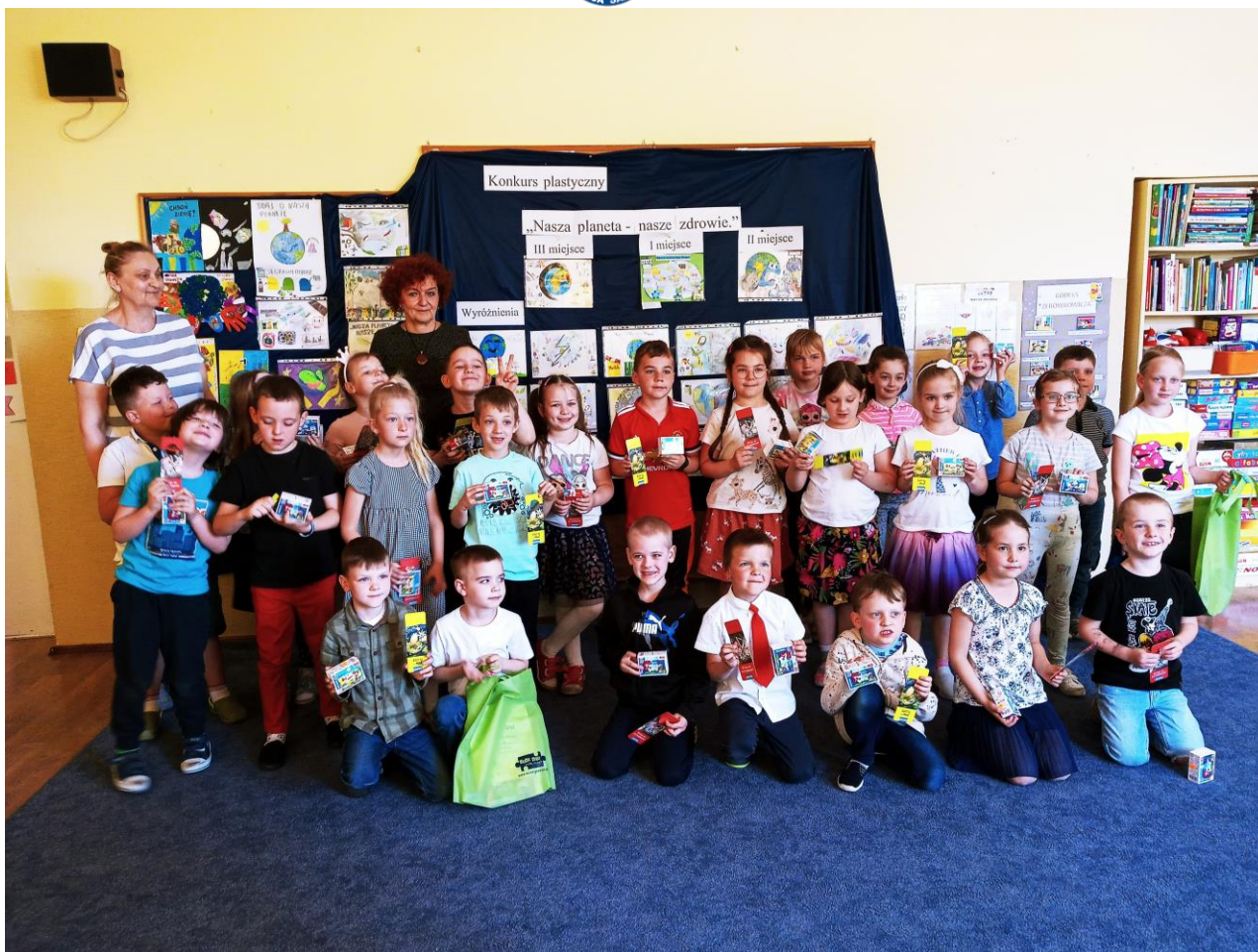
Zdjęcie nr 14 Konkurs „EKO jest lepsze!”