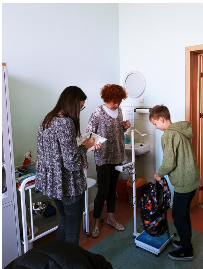
Zdjęcie nr 9. Ocena obciążenia uczniów ciężarem tornistrów przeprowadzona wśród uczniów Zespołu Szkół w Starych Oborzyskach.

W roku 2022 przeprowadzono w 5 placówkach oświatowych ocenę obciążenia uczniów ciężarem tornistrów szkolnych. Oceną objęto łącznie 45 oddziałów szkoły podstawowej, a badaniu poddanych zostało 776 uczniów. Przeprowadzone badanie wskazało, że prawidłową wagę tornistra szkolnego, która stanowiła do 10% masy ciała dziecka, posiadało 314 uczniów. Ponadto, przeprowadzone pomiary wskazały, że 329 uczniów posiadało tornister, którego waga mieściła się w zakresie 10-15% masy ciała danego dziecka. Wagę tornistra szkolnego, która stanowiła powyżej 15% wagi danego ucznia odnotowano w przypadku 133 osób.