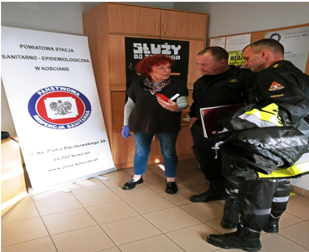
Zdjęcie nr 12 Punkt poradniczo – informacyjny w siedzibie PSSE w Kościance