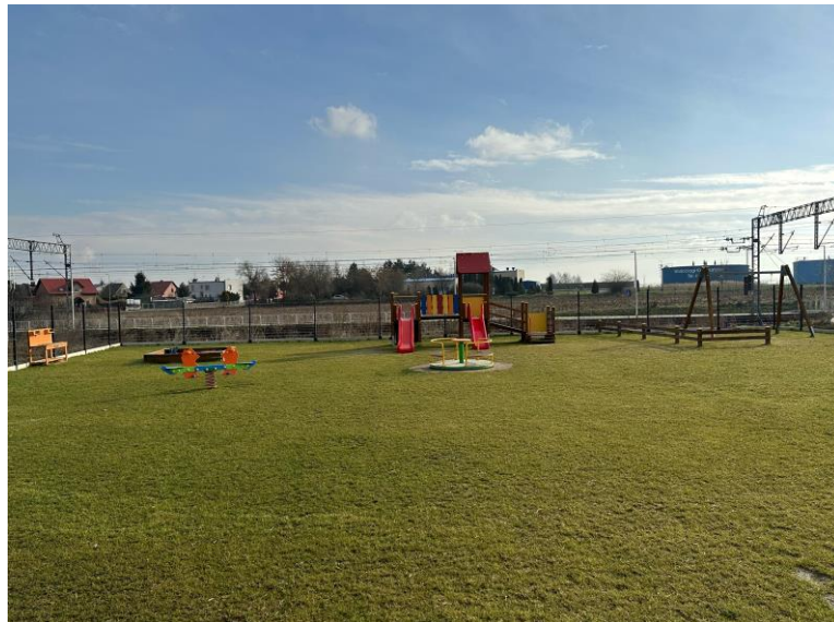
Zdjęcie nr 5. Plac zabaw i teren rekreacyjny przy nowym Przedszkolu nr 5 w Kościanie „Łamiglówka”