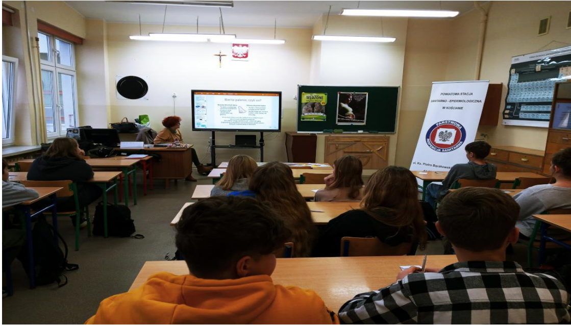
Zdjęcie nr 11 Szkolenie dla Młodzieżowych Liderów Zdrowia nt. tytoniu