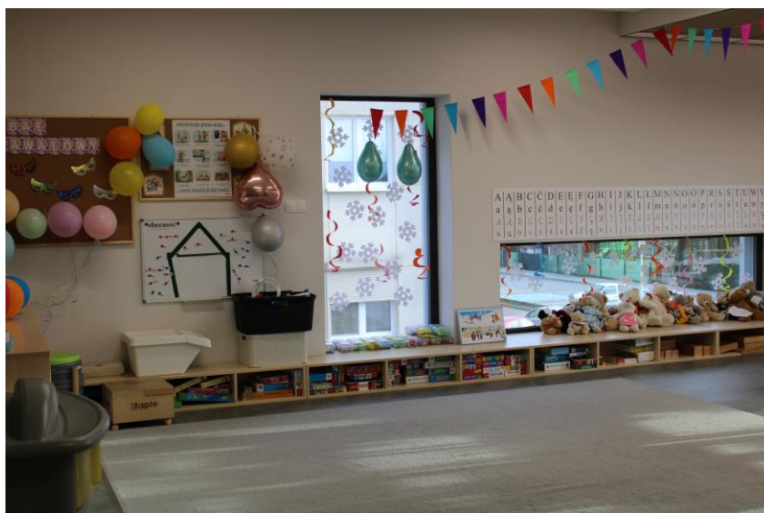
Zdjęcie nr 1. Sala zajęć w nowym budynku Samorządowego Przedszkola nr 2 w Kościanie

Z dniem 01 września 2022 roku Samorządowe Przedszkole nr 2 w Kościanie rozpoczęło działalność w nowej siedzibie. Nowy budynek przedszkola wykonany został w technologii pasywnej, która opiera się na założeniach minimalizowania zapotrzebowania na energię, maksymalizacji komfortu termicznego, wysokiej jakości powietrza wewnątrz budynku oraz trwałości budowlanej. Zaletą nowego budynku jest wykorzystanie w nim odnawialnych źródeł energii, które pozwolą na ograniczenie kosztów energii oraz zminimalizują emisję zanieczyszczeń.