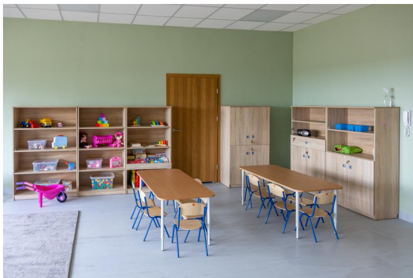
Zdjęcie nr 8. Sala zajęć w nowym Przedszkolu nr 6 w Kościanie „Kryjówka”