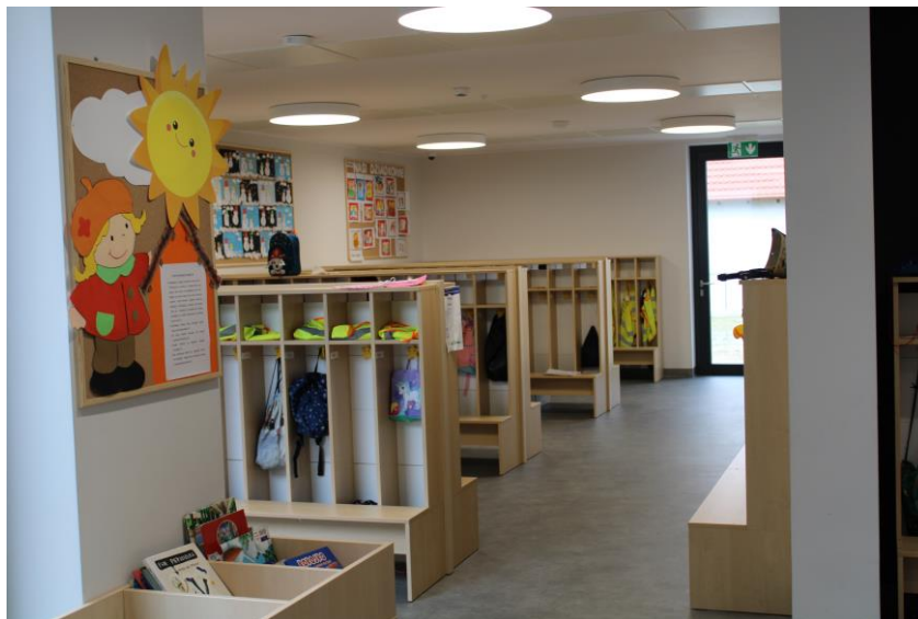
Zdjęcie nr 3. Szatnia dla dzieci w nowym budynku Samorządowego Przedszkola nr 2 w Kościanie

Ponadto, w roku 2022, na terenie miasta Kościana powstały dwa nowe przedszkola. Przedszkole nr 5 „Łamiglówka” zlokalizowane przy ul. Naclawskiej oraz Przedszkole nr 6 „Kryjówka” funkcjonujące przy ul. Czempińskiej to prywatne przedszkola publiczne.