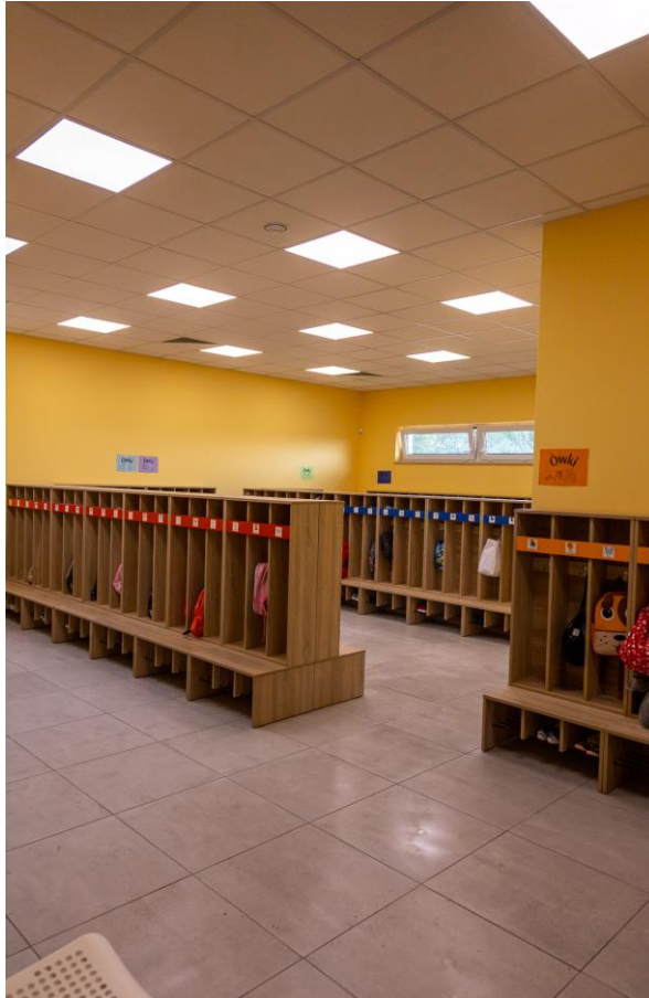
Zdjęcie nr 7. Szatnia w nowym Przedszkolu nr 6 w Kościanie „Kryjówka”