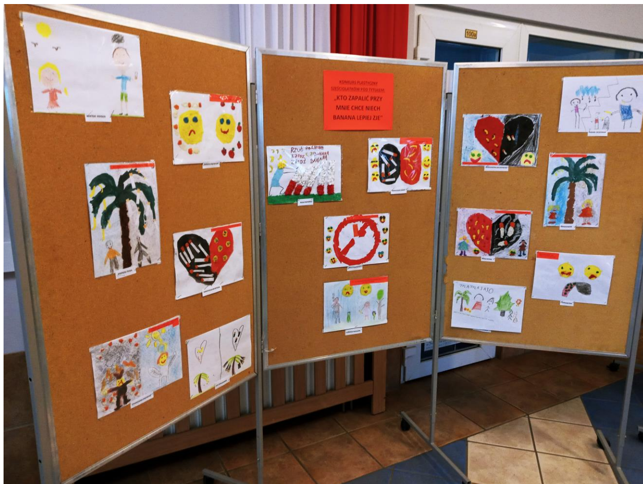
Zdjęcie nr 13 Konkurs plastyczny nt. szkodliwości palenia w przedszkolu