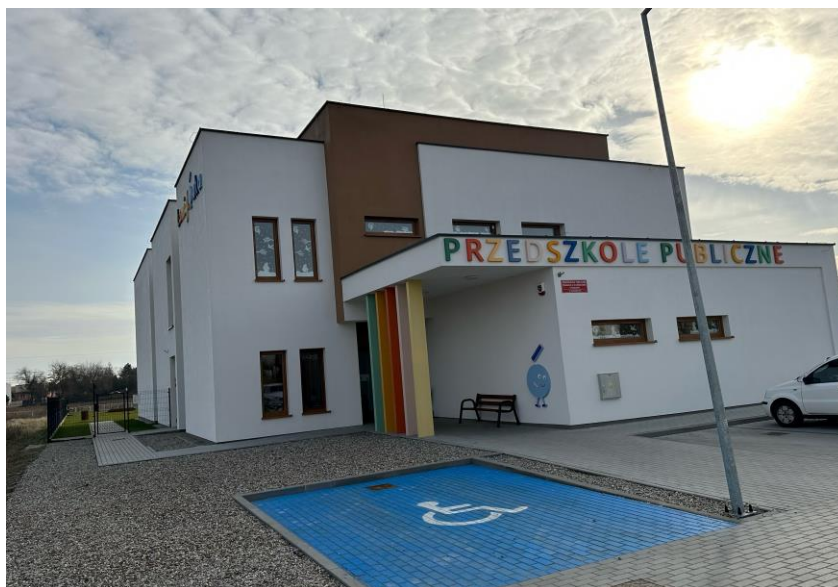
Zdjęcie nr 4. Budynek nowego Przedszkola nr 5 w Kościanie „Łamiglówka”

Ponadto, w roku 2022, na terenie miasta Kościana powstały dwa nowe przedszkola. Przedszkole nr 5 „Łamiglówka” zlokalizowane przy ul. Naclawskiej oraz Przedszkole nr 6 „Kryjówka” funkcjonujące przy ul. Czempińskiej to prywatne przedszkola publiczne.