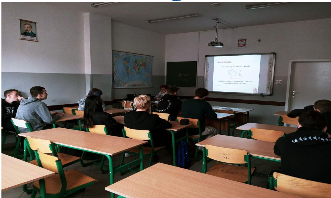
Zdjęcie nr 10 Szkolenie dla Młodzieżowych Liderów Zdrowia nt. HIV/AIDS