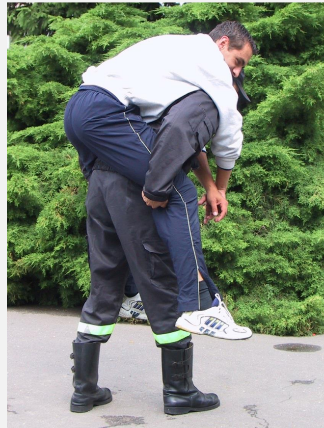
Chwył „na barana”