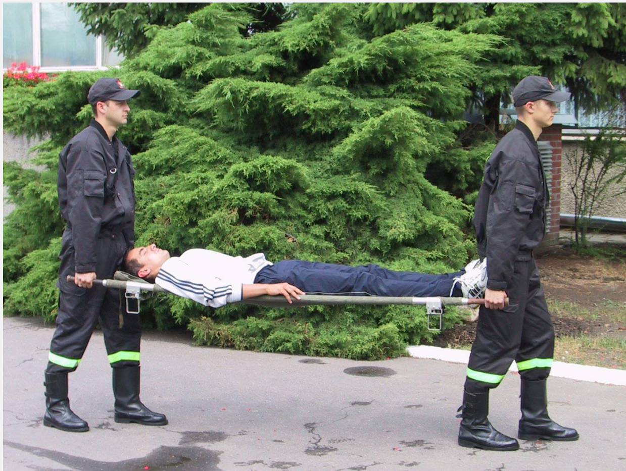
Transport za pomocą noszy