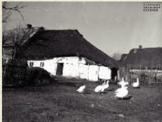
Podwórze wiejskie, 1932 r.

czyni tego stanu rzeczy tkwią w wolnym rozwoju pozarolniczych gałęzi gospodarki, czemu towarzyszyła powolna urbanizacja, i ostrożnej reformie rolnej.