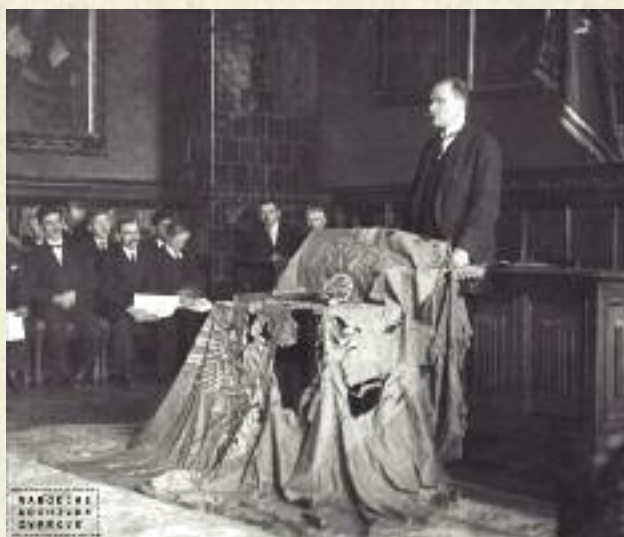
50-lecie Polskiego Towarzystwa Rybackiego w Krakowie - przemówienie ministra rolnictwa i dóbr państwowych Karola Niezabytowskiego, 1929 r.

Premier Leon Kozłowski powołał na kolejnego ministra rolnictwa i reform rolnych, Juliusza Poniatowskiego (1886-1975), który pełnił już wcześniej ten urząd. Poniatowski był ministrem także w kolejnych rządach Walerego Sławka, Zyndrama-Kościątkowskiego i Sławoja Składkowskiego. Urząd swój pełnił nieprze-