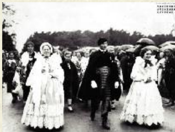
Dożynki w Spale. Pochód delegacji z Żywca, 1933 r.

Kultura na wsi, jak wcześniej wspominałem, często utożsamiana jest z kulturą ludową. Kultura ludowa, jest terminem wieloznacznym wchodzącym w zakres zainteresowania zarówno nauk etnologicznych jak i socjologii wsi 2 . Badacze nie są jednomyślni, co do znaczenia tego terminu. Analizując kulturę ludową