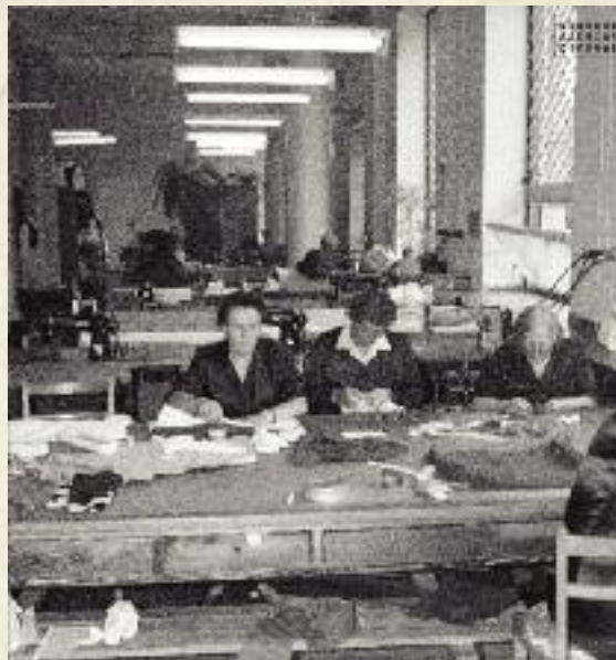
Zakład odzieżowy Cepelii, 1969 r.

nych treści i form folkloru, branych bądź jeszcze wprost z terenu i przenoszonych w sytuacje odmienne od naturalnych, bądź też czerpanych z folklorystycznej dokumentacji,