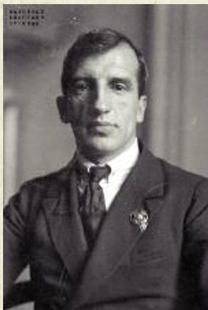
Juliusz Poniatowski - minister rolnictwa w sześciu gabinetach II Rzeczypospolitej

Juliusz Poniatowski (1886-1975) żołnierz Legionów Polskich i Polskiej Organizacji Wojskowej, działacz ludowy, pedagog, ekonomista, parlamentarzysta, wicemarszałek Sejmu, minister rolnictwa w sześciu gabinetach II Rzeczypospolitej, autor reformy rolnej w okresie międzywojennym, nauczyciel akademicki w okresie powojennym, był jednym z najwybitniejszych i najpopularniejszych polityków okresu międzywojennego. Dzisiaj Jego postać i dokonania są mało znane.