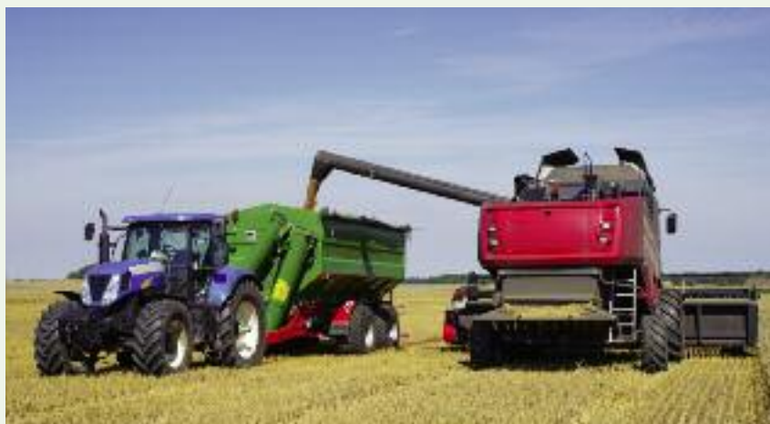
Dzięki inwestycjom, współfinansowanym przez Agencję, zmodernizowano tysiące gospodarstw, a także m.in. wyposażono je w nowoczesne maszyny i urządzenia

Wstąpienie do Unii Europejskiej w maju 2004 r. i tym samym objęcie polskiego rolnictwa instrumentami Wspólnej Polityki Rolnej (WPR) otworzyło w historii naszej wsi nowy rozdział. W 2004 r. ARiMR po raz pierwszy wypłaciła polskim rolnikom płatności bezpośrednie. Od tego czasu o takie dopłaty co roku ubiega się 1,3 mln rolników. Przez te wszystkie lata Agencja przekazała im łącznie ponad 162,5 mld zł. System dopłat zapewnia stabilność ekonomiczną w sektorze rolnictwa, obniża koszty prowadzenia gospodarstw i pozwala na utrzymywanie cen żywności na relatywnie niewysokim poziomie. Bez dopłat załamałyby się