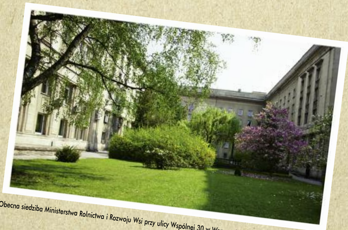
Obecna siedziba Ministerstwa Rolnictwa i Rozwoju Wsi przy ulicy Wspólnej 30 w Warszawie