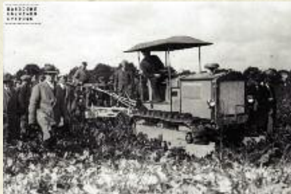
Pokaz orki za pomocą ciągnika mechanicznego w Wielkopolsce, 1928 r.