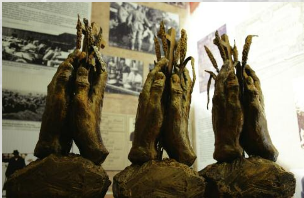
Symbol Kłosa Niepodległej RP autorstwa Maksymiliana Biskupskiego

stalowana w Polsce przez Stalina „władza ludowa” zaczęła likwidację własności prywatnej. W tym obszarze działalności znalazła się również ziemia polskich chłopów. Represje dotknęły mieszkańców polskiej wsi. Skalę i metody dyskryminacji działaczy ludowych i ludności wiejskiej ilustrują wydarzenia ujęte w kalendarium.