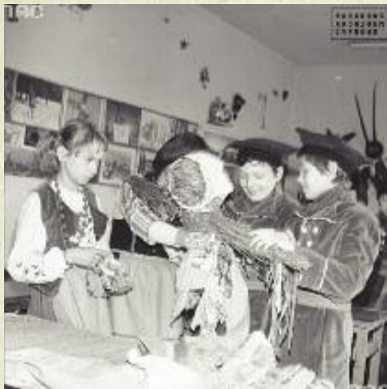
Harcerze wykonują kukłę Marzanny, 1979 r.