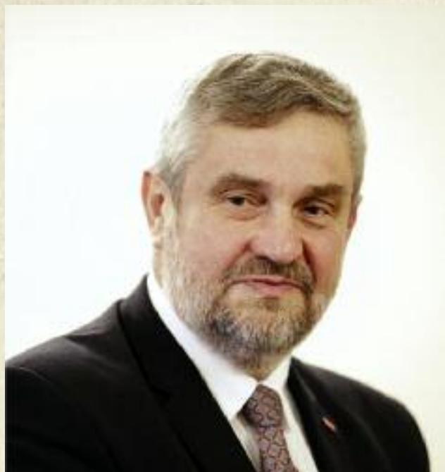
Jan Krzysztof Ardanowski, minister rolnictwa i rozwoju wsi