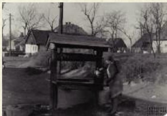
Kobieta przy studni, 1932 r.

Ocena ogólnego bilansu dwudziestolecia w dziedzinie produkcji rolnej jest niezmiernie złożona. Przy-