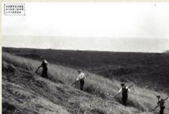
Żniwa nad Bałtykiem, 1932 r.

darstw specjalistycznych i koncentracji (skali produkcji) poprzez mechanizmy ekonomiczne (kredyt, ceny) i alokację środków do produkcji rolnej.