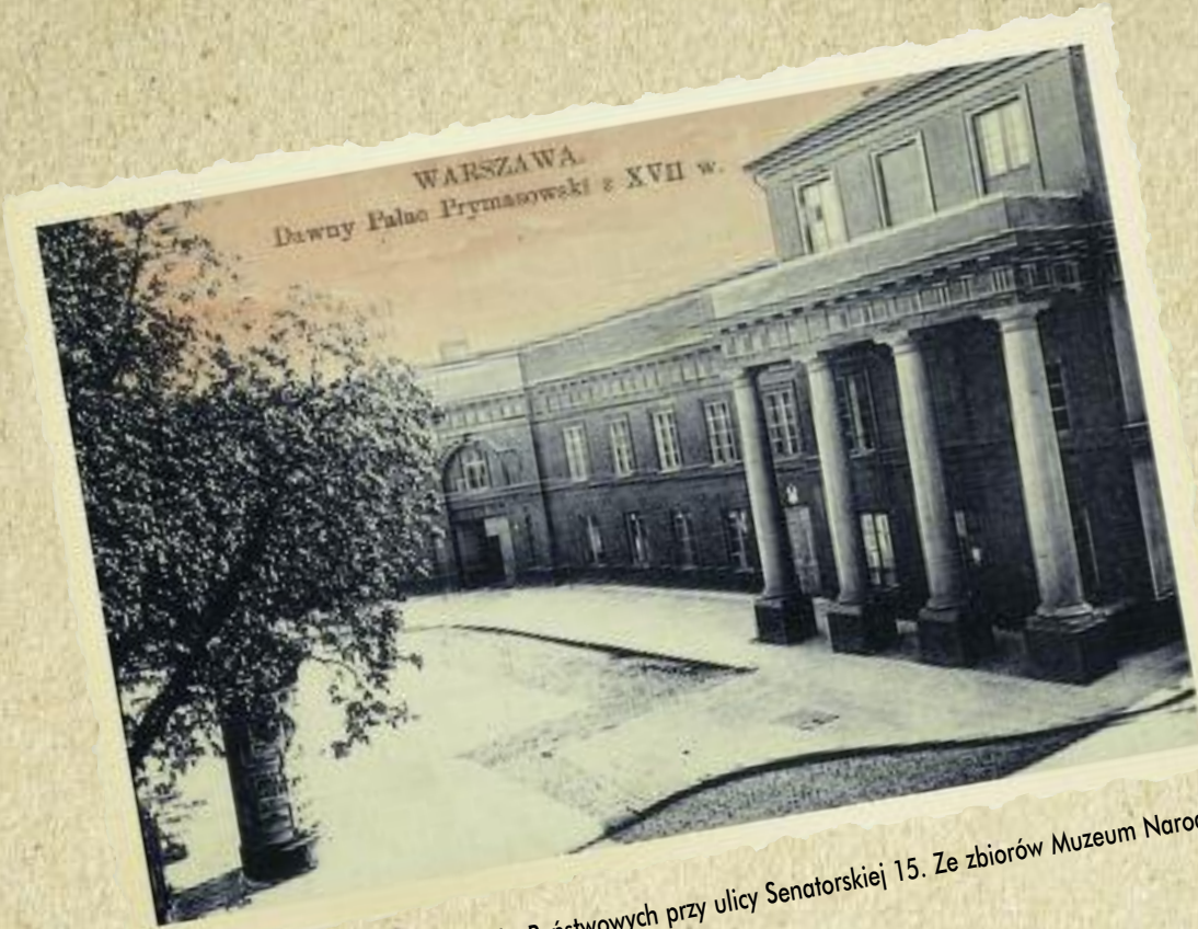
Siedziba Ministerstwa Rolnictwa i Dóbr Państwowych przy ulicy Senatorskiej 15.