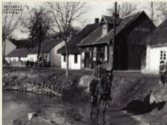
Zabudowania w obrębie wsi, 1932 r.

Ważnym problemem okresu międzywojennego było bezpieczeństwo żywnościowe, które wyznaczał wzrost demograficzny oraz postęp w produkcji rolnej. Mimo ogromnych strat wojennych oraz znacznego wzrostu liczby ludności w niepodległej Rzeczypospolitej,