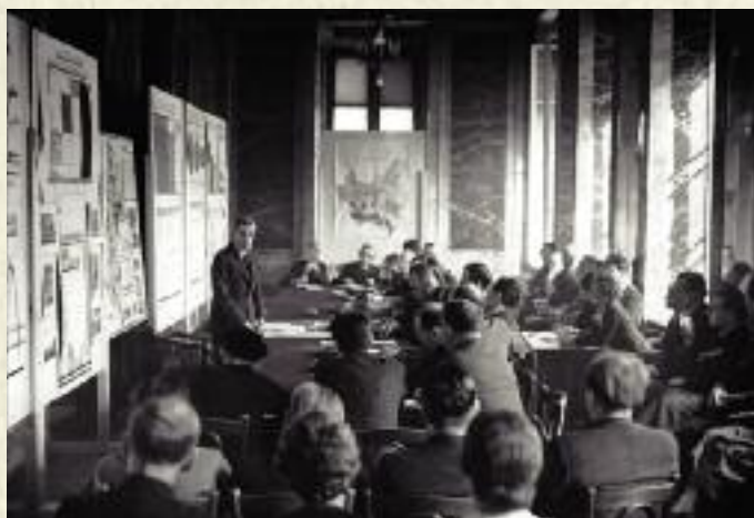
Konferencja w Ministerstwie Rolnictwa i Reform Rolnych w sprawie ustroju rolnego. Przemawia minister Juliusz Poniatoński, 1936 r.

Juliusza Poniatońskiego cechowała niezwykła odwaga cywilna i wierność swym ideałom. Jego poglądy