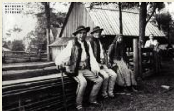
Grupa górali przed chatą, 1925 r.

(Burszta, 1974, s. 282). Prężnie już w tym okresie działające stowarzyszenia takie jak Polskie Towarzystwo Ludoznawcze czy Polskie Towarzystwo Krajoznawcze (późniejsze PTTK) tworzyło muzea regionalne, a także archiwa i biblioteki. Idee regionalistyczne stają się w różnym zakresie przez całe XX-lecie częścią państwowej polityki kulturalnej. Działalność ta szybko owocuje zwłaszcza w zakresie działalności artystycznej – sztuka ludowa staje się inspiracją oraz bezpośrednio wpływa na poetów, prozaików, malarzy, rzeźbiarzy, kompozytorów i twórców teatralnych. Jednocześnie zaczyna być ona utożsamiana ze sztuką użytkową. W ramach opieki nad nią powstają instytucje państwowe – instytuty (np. Państwowy Instytut Kultury Wsi), muzea (np. Skansen w Nowogrodzie), szkoły (np. Szkoła Instruktorów Tkactwa, Kilimiarstwa i Koszykarstwa) oraz zakłady produkcyjne. Sztuka ludowa uważana była za dział tzw. przemysłu ludowego i od 1924 roku regulowana ustawą sejmową. Przemysł ludowy w rozumieniu polskiej ustawy jest to wytwarzanie przedmiotów użytkowych i zdobniczych o cechach etnicznych z własnych lub nabytych surowców (nie dostarczonych przez nakładcę), o ile to wytwarzanie od-