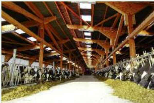
Wielkim, prorozwojowym impulsem dla polskiej wsi i rolnictwa stała się możliwość korzystania z unijnych środków, przeznaczonych na inwestycje na obszarach wiejskich

wsparciem w okresie jesienno-zimowym, w którym zazwyczaj rolnicy zapatrują swoje gospodarstwa w nawozy, środki ochrony roślin i zakupują sprzęt rolniczy. W bieżącym roku, po wielkiej suszy, która spustoszyła szereg upraw, poprawiają płynność finansową gospodarstw, powstrzymując proces ich upadku.