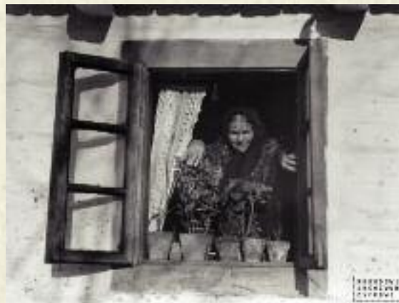
Mieszkanca wsi w oknie swojego domu, 1932 r.

Ziemiach Odzyskanych 100 ha. W latach 1945-1949 w wyniku parcelacji i osadnictwa w ręce chłopskie przeszło 6,1 mln ha ziemi; na 5,6 mln ha utworzono 814 tys. gospodarstw (z tego 347 tys. były to nowe gospodarstwa, głównie byłej służby folwarcznej, a 467 tys. to gospodarstwa na Ziemiach Odzyskanych), zaś 0,5 mln ha przeznaczono na powiększenie 250 tys. gospodarstw już istniejących; przeciętna powierzchnia nowo utworzonego gospodarstwa wyniosła 6,9 ha. Tak więc zasada reformy rolnej zapisana w dekreście PKWN, że ustrój rolny ma być oparty na silnych i zdolnych do wydajnej produkcji gospodarstwach stanowiących prywatną własność ich posiadaczy, nie została zrealizowana. Obdarowanie ziem chłopów nastąpiło zgodnie z dyrektywą polityczną, którą wyrażała tzw. trójjedyną formułą: obrona biedniaka, przy neutralizacji średniaka i walka z kułakiem. W istocie reforma rolna realizowała cel polityczny: likwidację ziemiaństwa i zjednanie dla nowego ustroju biedoty wiejskiej.