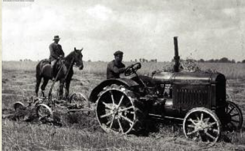
Orka traktorem, 1927 r.

twie i produkował wystarczającą ilość niezbędnych środków produkcji dla rolnictwa. W wyniku zniszczeń wojennych i rabunku Polska straciła około 1,7 mln szt. koni (48%), 3,6