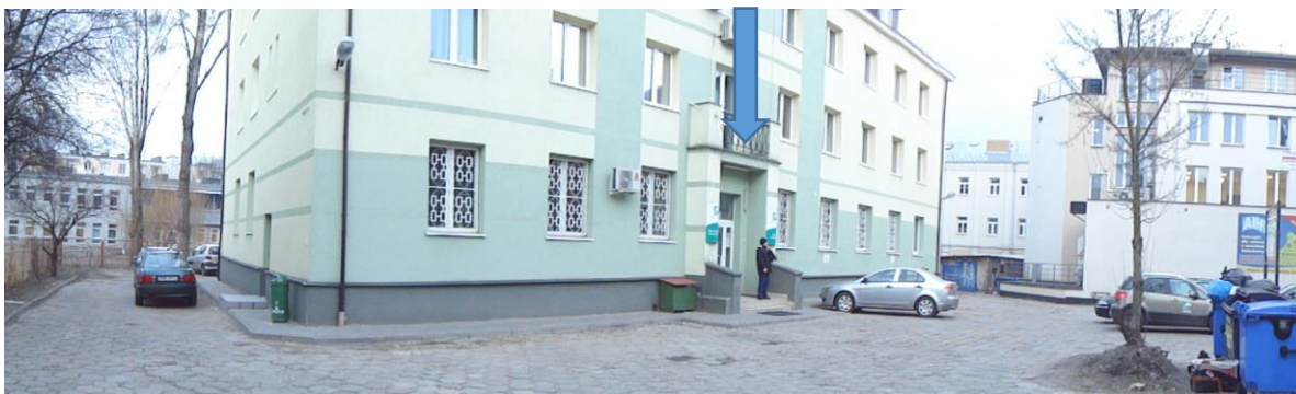
Wjazd na podwórkę od ul. Przejazd