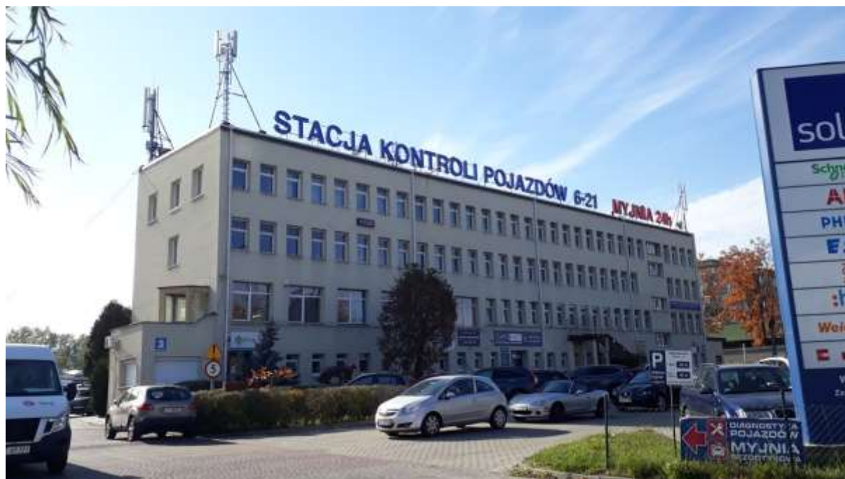
Fot. 1: Widoki anten stacji bazowej ID: BT14536, zlokalizowanej: al. Wincentego Witosa 3, 20-315 Lublin